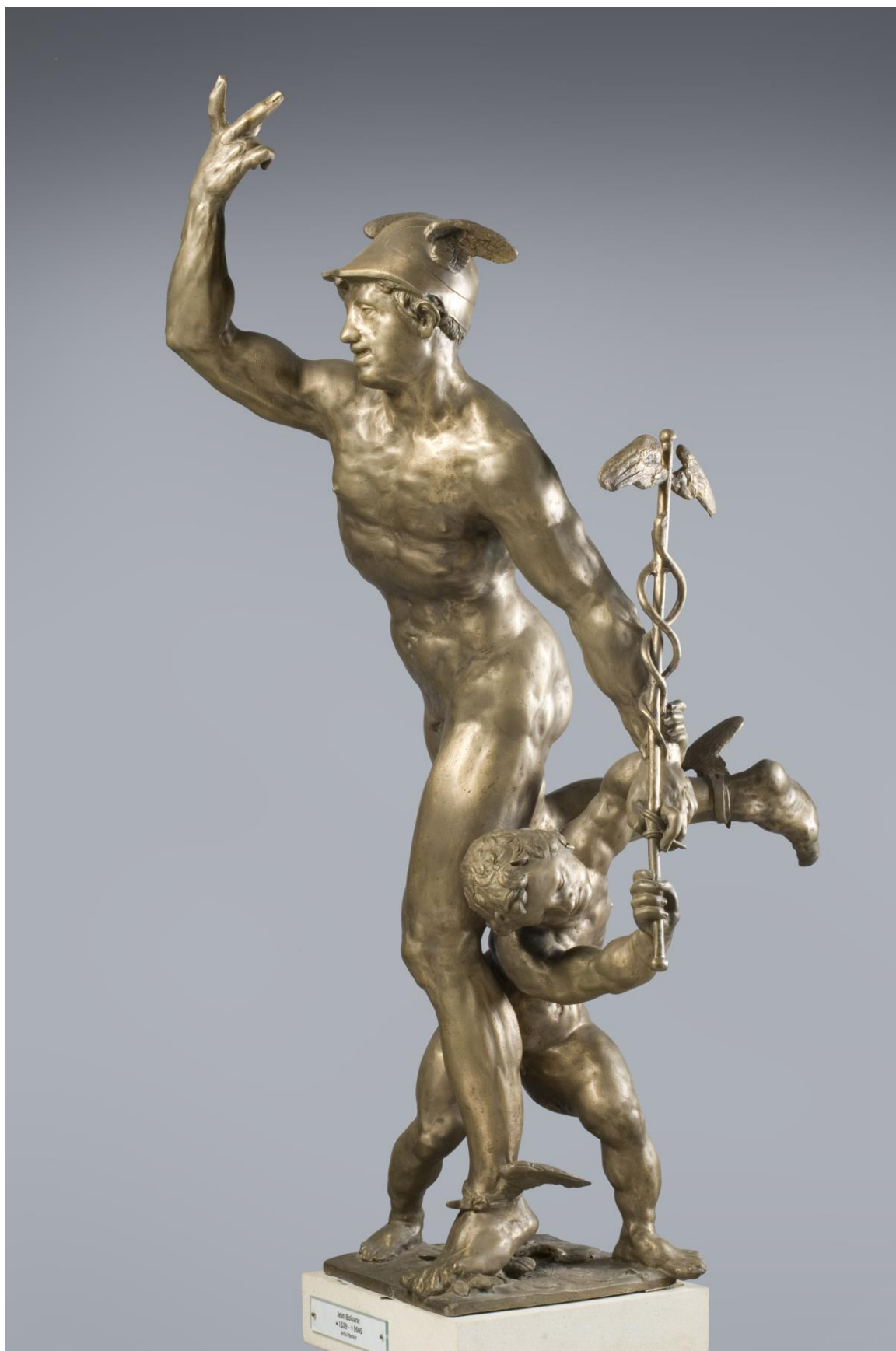
Obr. 5: Adriaen de Vries: Merkur, bronz, 1625–1616, zámek Karlova Koruna, Chlumeck nad Cidlinou