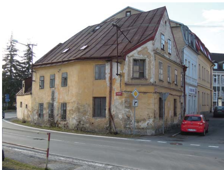
Městský dům čp. 476 v Tachově

V roce 2013 nebyly po územním odborném pracovišti v Plzni vyžadovány informace podle § 18 odst. 1 zákona 106/1999 Sb., o svobodném přístupu k informacím.