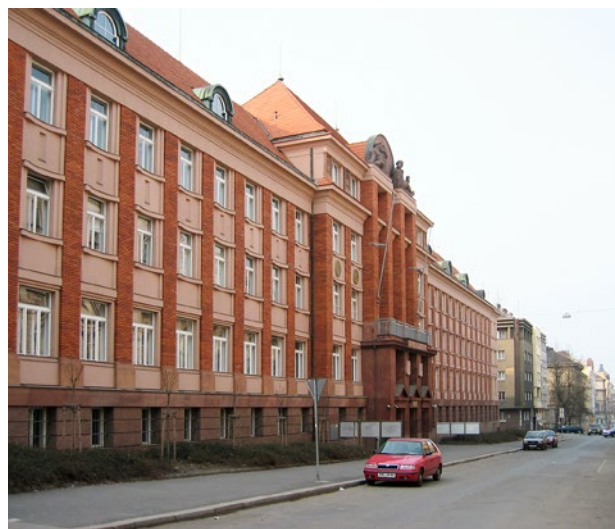
Obr. 3. Plzeň, Škroupova ul. čp. 1760, sídlo Krajského úřadu Plzeňského kraje, původně budova finančních úřadů, tzv. Rašínův dům, který byl vystavěn v letech 1924–1927 podle návrhu architekta Františka Roitha.

Text je provázen až opulentním množstvím fotografií, převážně dobových, někdy kvůli tomu jen nevelkých, ale vždy čitelných. A to nejen hotových staveb, ale i snímků z procesu výstavby, které zajímavě ukazují dobové technologie stavění. Zachycují nejen stavby, ale také společenské události, jako je třeba sokolské cvičení či kladení základního kamene nové školy, otevření obchodního domu Brouk a Babka či půvabný snímek z údržby veřejné zeleně.