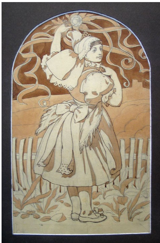
Obr. 4. Jan Koula, akvarel, 1910. Návrh intarzie pro dveře radnice. (Reprodukce z knihy, s. 124. Originál kresby ve sbírce ZČM v Plzni.)

a ve své podobě nejvýraznějším projevem národního ducha, který na renesanční tradice přímo či nepřímou navazuje.