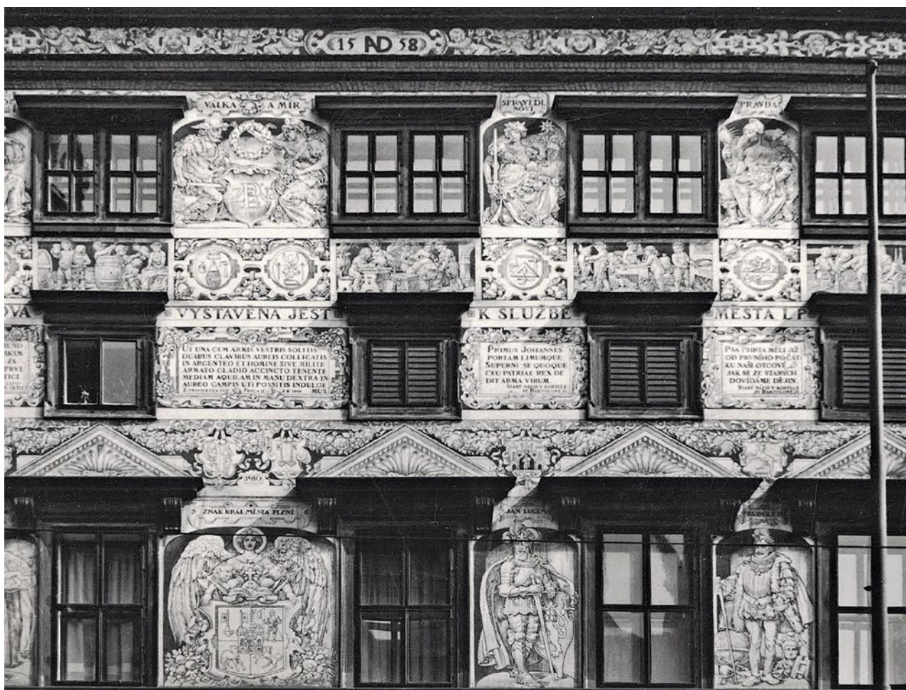
Obr. 3. Plzeň, budova radnice čp. 1 na náměstí Republiky. Sgrafitová výzdoba hlavního průčelí, zhotovená dle Koulova návrhu.

nalezl Koula především ve šlechtických sbírkách, které nejen studoval, ale především důkladně dokumentoval. Vlastním nákladem vydával obrazové album Památky umělecko-průmyslové v Čechách (1882–1887), jež dodnes zůstávají ojedinělým publikačním projektem. Druhým, možná ještě významnějším inspiračním impulsem bylo Koulovi studium lidové kultury. Opakovaně podnikal národopisné výpravy na Slovensko i Moravu, kde pořizoval důkladnou kresebnou i fotografickou dokumentaci.