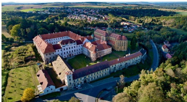
Obr. 2. Kladruhy (okr. Tachov), areál bývalého benediktinského kláštera. Klášter byl založen v roce 1115 poblíž obchodní evropské tepny, tzv. Norimberské obchodní stezky, která vedla od Norimberku přes Prahu až k Baltu. Letecký pohled. (Foto L. Šimo, 2021. Za poskytnutí fotografie redakce děkuje kladrubskému kastelánovi M. Zoubkovi.)