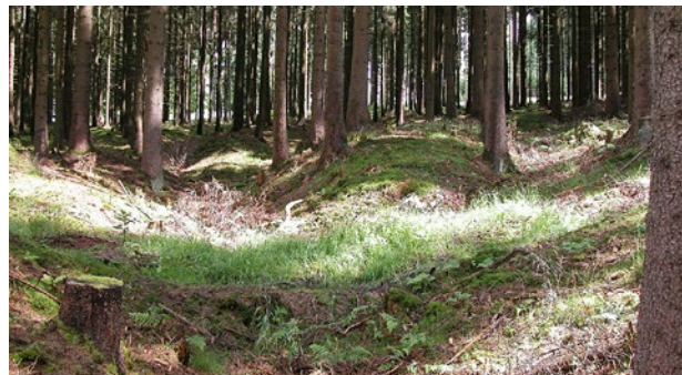
Obr. 3. Oborská hájenka, katastrální území Milíře (okr. Tachov). Svazek úvozů „tachovské větve Norimberské cesty“. (Foto P. Nový, 2008)