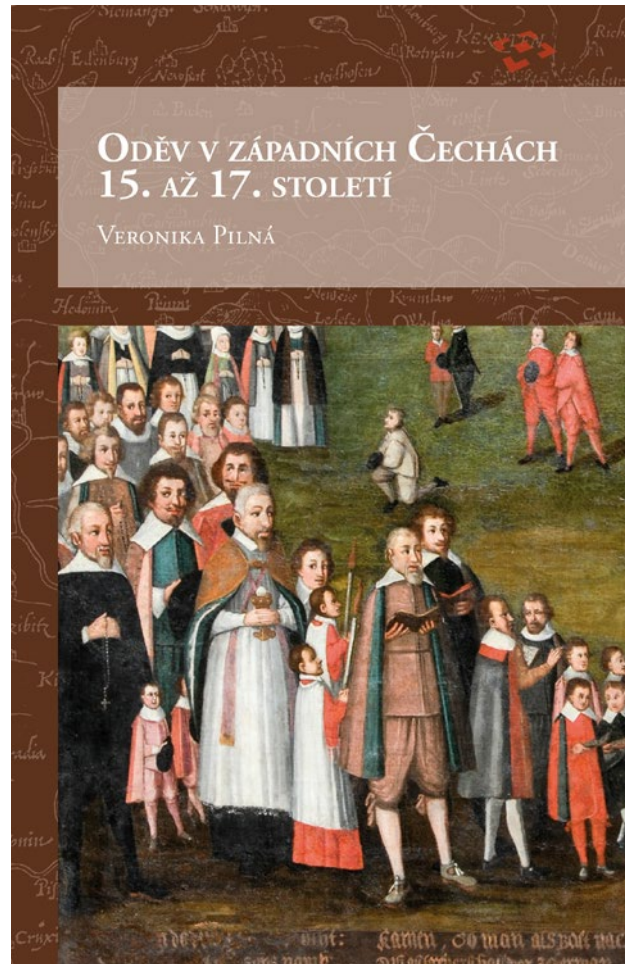
Obr. 11. Přední strana obálky knihy Oděv v západních Čechách 15. až 17. století.

Obsáhlá publikace, nazvaná Oděv v západních Čechách 15. až 17. století , je dílem Veroniky Pilné (obr. 11). 8 Tato monografie, čítající 369 stran, je zacílena do kategorie každodennosti – přináší poznatky z historie oděvu, kdy představuje ošacení užívané napříč společenskými