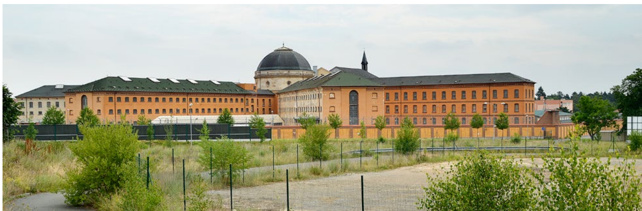
Obr. 8. Plzeň-Bory, věznice, pohled od západu.

národní osobnosti z řad bývalých vězňů. Zhodnocení areálu odůvodňuje podání návrhu na jeho prohlášení za nemovitou kulturní památku.