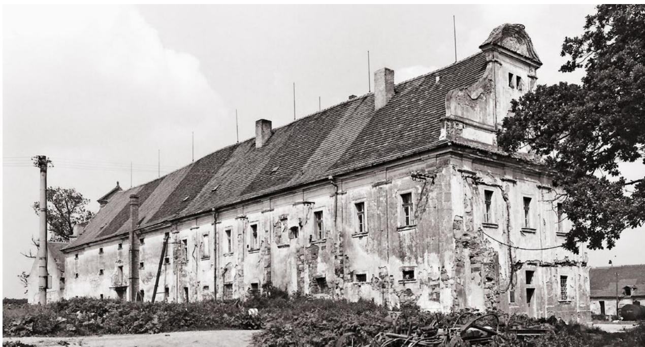
Obr. 9. Záluží (okr. Plzeň-jih), areál hospodářského dvora Gigant. Pohled na budovu „zámku“ od jihozápadu v době, kdy areál postrádal jakoukoliv stavební údržbu a na svou záchranu musel čekat ještě bezmála čtvrt století.