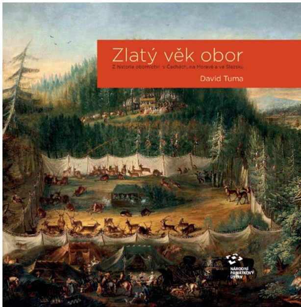
Obr. 10. Přední strana obálky knihy Zlatý věk obor. Z historie obornictví v Čechách, na Moravě a ve Slezsku.