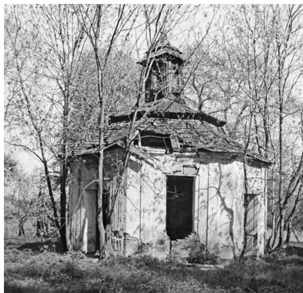
Obr. 7. Horšovská obora (okr. Domažlice), gloriet Annaburg. Na konci osmdesátých let 20. století se objekt nacházel v havarijním stavu.

Na začátku roku 2017 bylo vydáno sedmé lepoperele, zaměřené na kostel sv. Mikuláše v Čečovicích (okr. Domažlice; obr. 2), 3 jehož autorem je opět Jan Kaigl. Výjimečná sakrální památka gotického stavitelství překvapuje zejména svou architekturou vnějšího pláště, kde je působivě kombinováno režné cihelné zdivo a kamenosochařská výzdoba, uplatněná v podobě ostění oken, portálu vstupu, reliéfně zdobené hlavní římsy a nejvýrazněji pak u „předstěny“ západního štítu. Ta je složena z architektonických prvků (sloupků, prutů a kružeb), poskládaných do podoby tříetážové arkády, jež je završena profilovanou kamennou římsou a kamenným křížem ve vrcholu štítu. Vysoká úroveň pojednání kamenických prvků se odráží i v interiéru kostela, např. u poprsné zábradlí kruchty. Ten tvoří spolu s dalšími prvky a restaurovanou figurální malířskou výzdobou působivý celek. Kostel nechali vystavět majitelé poblíž ležící někdejší tvrze, páni z Velhartic, a při stavbě je, díky určitým společným znakům, předpokládána účast stavební huti katedrály v německém Řezně či kostela v Nabburgu. V závěru publikace jsou přiblíženy výsledky náročné, velmi zdařilé obnovy této významné památky.