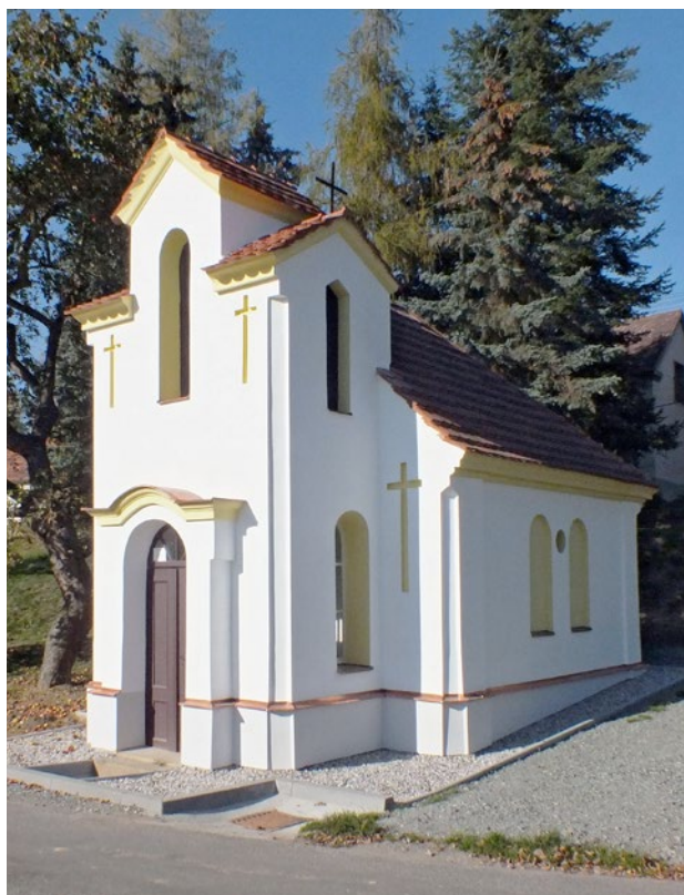
Obr. 4. Hradecko (Kralovice, okr. Plzeň-sever), kaplička a požární zbrojnice, celkový pohled. (Foto P. Vlček, 2015)

i dokončena. 8 Poslední zjištěnou kaplí tohoto typu byla kaplička Srdce Ježíšova, postavená v Blešně (okr. Hradec Králové) roku 1913. 9 Proti předešlým kapličkám je tato robustnější a větší, jinak je u ní také vyřešeno zavěšení zvonku. Naopak nejstarší touto zjištěnou stavbou, pokud je datace do roku 1866 správná, je kaple v Michálkovicích (dnes součást Ostravy). 10