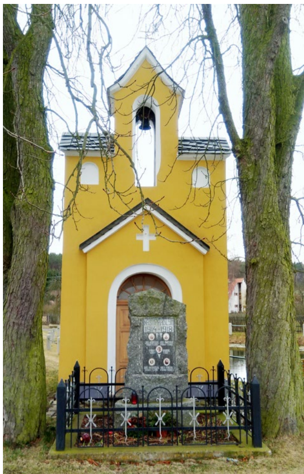
Obr. 2. Brodeslavy (okr. Plzeň-sever), kaplička, průčelí. (Foto P. Vlček, 2020)