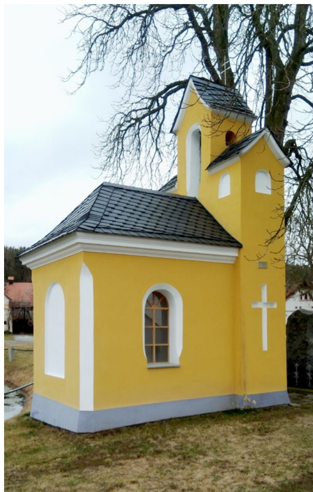
Obr. 3. Brodeslavy, kaplička, celkový pohled.