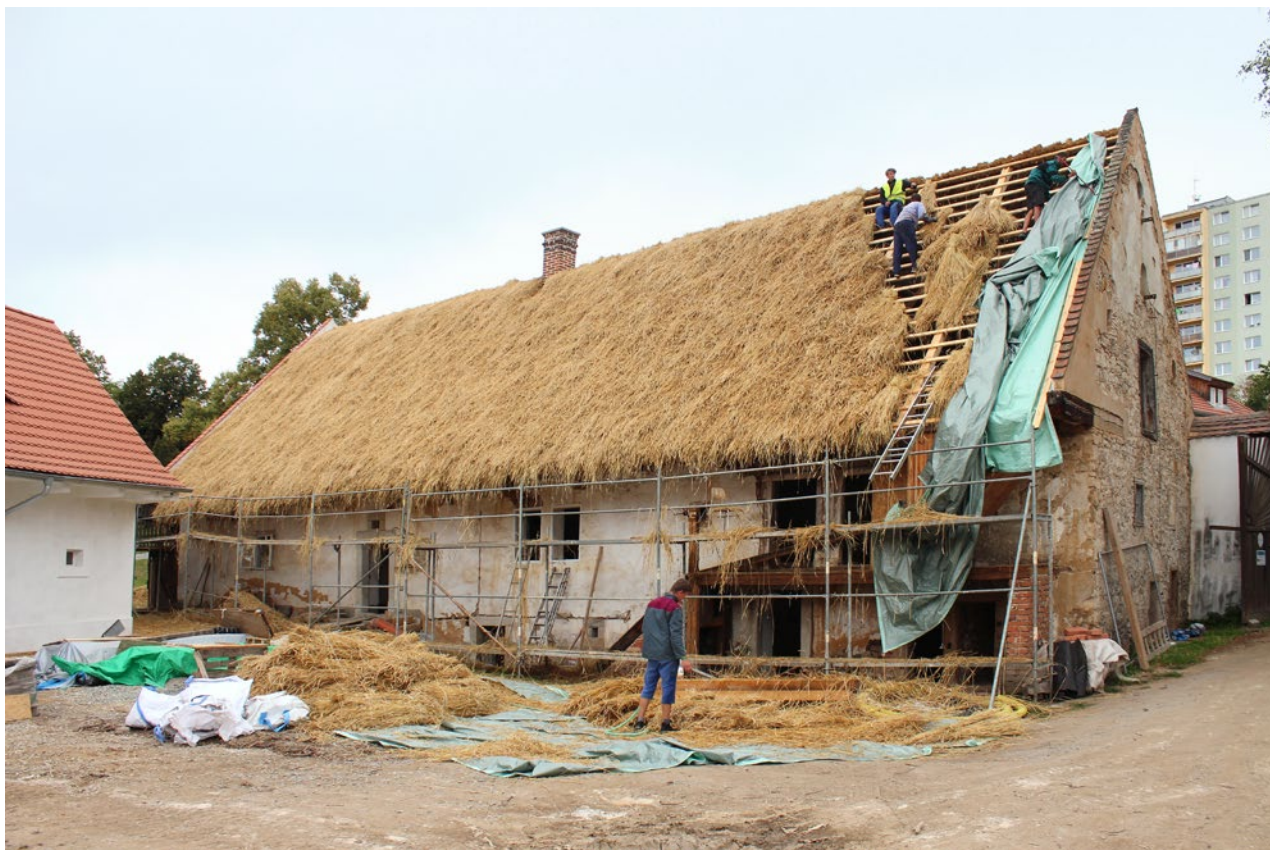
Obr. 14. Plzeň-Bolevec, selský statek U Matoušů čp. 1. Pokládka doškové krytiny střechy obytného stavení. Pohled ze dvora.