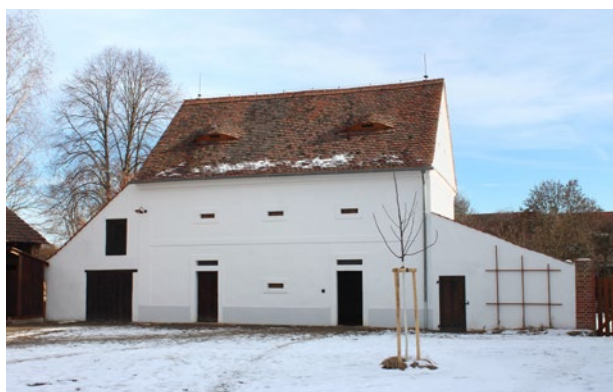
Obr. 8. Plzeň-Bolevec, selský statek U Matoušů čp. 1. Sýpka, pohled ze dvora, stav po obnově. (Foto K. Foud, 2021)

Krátce po roce 2002 se majitelé (restituenti) rozhodli dvůr prodat městu Plzeň s podmínkou, že bude obnoven a zpřístupněn veřejnosti. K prodeji došlo již v roce 2004, samotný převod majetku na stát, resp. Ministerstvo kultury a Národní památkový ústav (NPÚ), byl dokončen až v roce 2007. V letech 2007–2008 byl již pod správou NPÚ, územního odborného pracoviště v Plzni, obnoven krov stájí a chlévů. Následně byl obnoven střešní plášť z tašek bobrovek, včetně rekonstrukce vikýřů typu volského oka. V období let 2010–2018 se opravy dočkala krovová konstrukce a střešní plášť stodoly, opravovalo se schodiště do sklepa a také