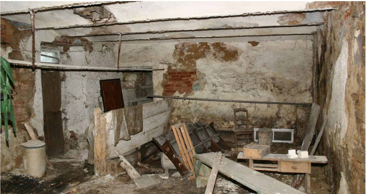
Obr. 5. Plzeň-Bolevec, selský statek U Matoušů čp. 1. Interiér chlévů v roce 2005.