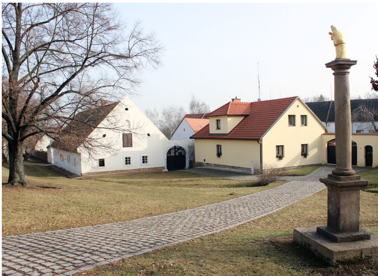
Obr. 1. Plzeň-Bolevec, selský statek U Matoušů čp. 1. Pohled z návsi.