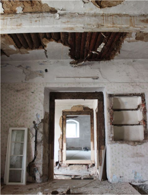
Obr. 4. Plzeň-Bolevec, selský statek U Matoušů čp. 1. Obytné stavení, průhled ze zadní světnice do síně.

a modernizaci dvora. Vyčlenil také část zahrady ležící východně od sýpky pro svého nejstaršího syna Martina (jenž pojal za ženu Annu Pechmannovou z boleveckého statku čp. 3), kde byla následně vyzdvížena menší usedlost