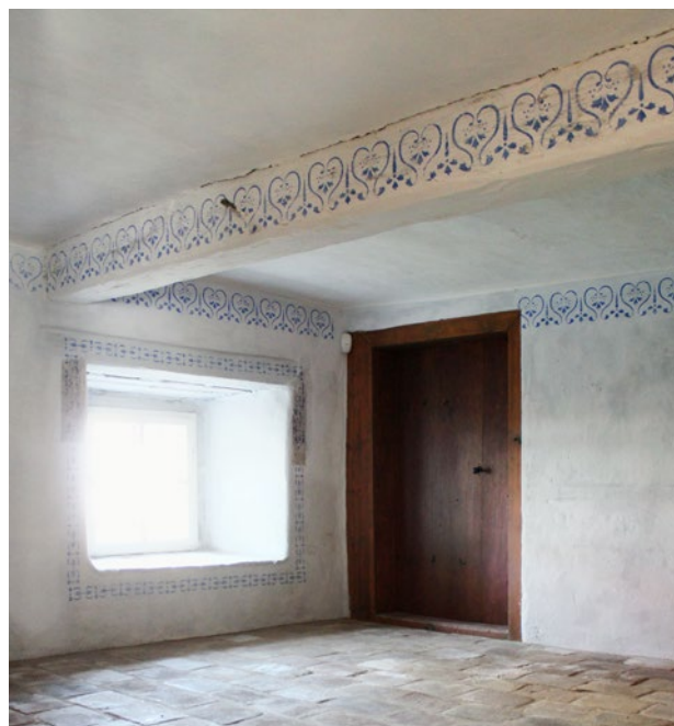
Obr. 10. Plzeň-Bolevec, selský statek U Matoušů čp. 1. Obytné stavení, restaurovaná výmalba komory za zadní světnici.

Rozsáhlejší stavební úpravy proběhly ve stájích, do kterých bylo vloženo sociální zázemí pro návštěvníky. Chlévy zůstaly ve své podstatě zachovány, bylo ale třeba obnovit zdivo, podlahu a klenby. V průběhu stavebních prací na