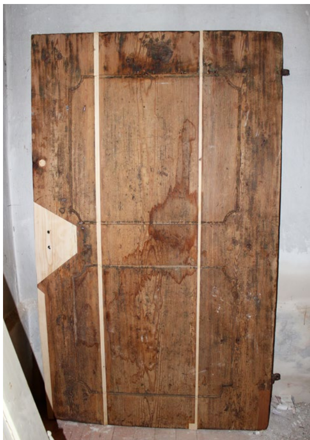
Obr. 12. Plzeň-Bolevec, selský statek U Matoušů čp. 1. Restaurování vstupních dveří, stav v průběhu prací.

bylo po vzoru z roku 1833 obohaceno tesaným vročením 2020. Do nejjihněji situované části stavby bylo vloženo dřevěné schodiště do podkroví, kde vznikl prostorný depozitář. Upravován byl také povrch a niveleta rejničky (úzké uličky) mezi chlévy a stavením sousedního dvora čp. 2. Nevhodně provedené zpevnění terénu zde spolu s absencí okapných žlabů a svodů způsobovalo doslova enormní zamokření stavby. Tomu také následně odpovídal rozsah sanačních prací.