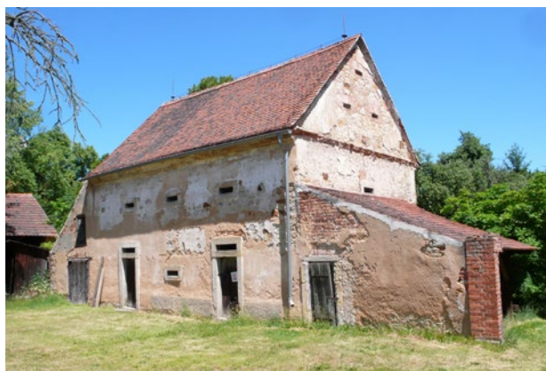
Obr. 7. Plzeň-Bolevec, selský statek U Matoušů čp. 1. Sýpka, pohled ze dvora, stav před opravou.