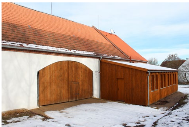
Obr. 6. Plzeň-Bolevec, selský statek U Matoušů čp. 1. Stodola s dřevěnou přístavbou, kde vzniklo zázemí pro aktivitu objektu.