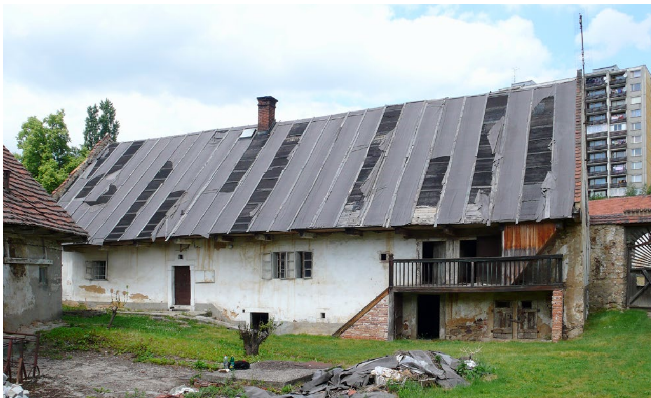
Obr. 13. Plzeň-Bolevec, selský statek U Matoušů čp. 1. Pohled ze dvora na obytné stavení, stav před zahájením obnovovacích prací.