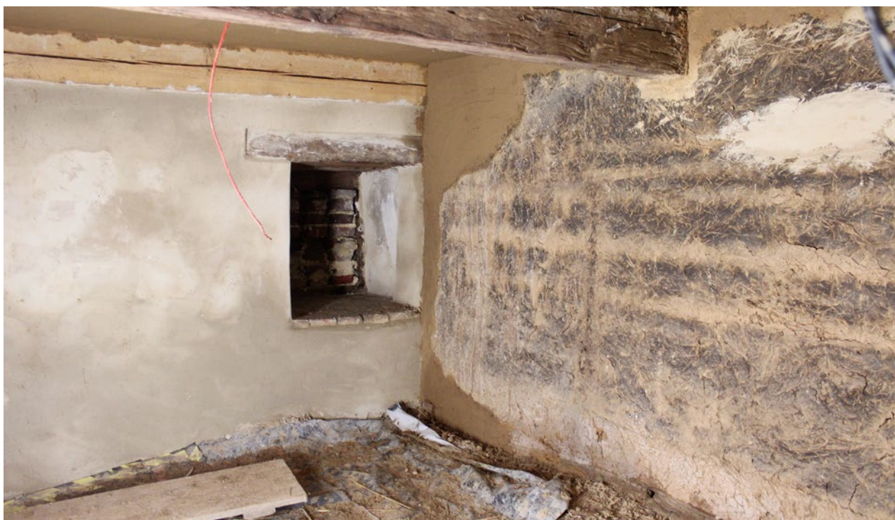
Obr. 11. Plzeň-Bolevec, selský statek U Matoušů čp. 1. Na srubové stěně zadní komory se dochovaly hliněné omítky, které byly zachovány a doplněny. Stejně bylo přístupováno i u omítek vápenných.

objektu byl na dochovaném kamenném klasicistním ostění okénka objeven letopočet 1833. Protože ostatní okenní otvory objektu chlévů a stájí byly degradovány dřívějšími nevhodnými úpravami včetně odstranění kamenného ostění, přistoupilo se k jejich rekonstrukci. Jedno z okének