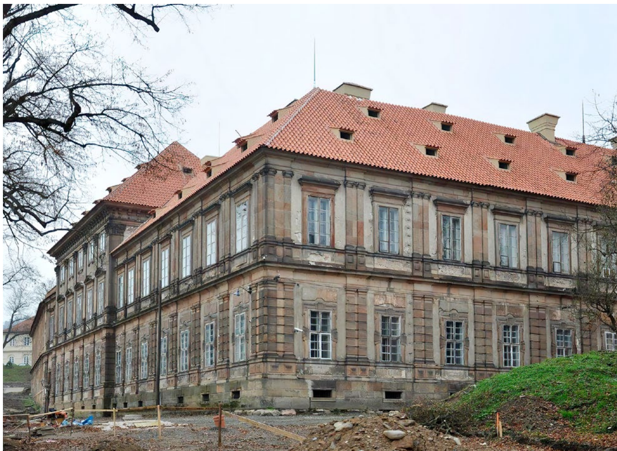
Obr. 6. Plasy, klášter. Prelatura po dokončení obnovy krovu a krytiny, pohled od jihozápadu. (Foto Z. Chudárek, 2014)

zvýšeno o celé patro, čímž získalo velmi nepříznivé hmotové proporce.