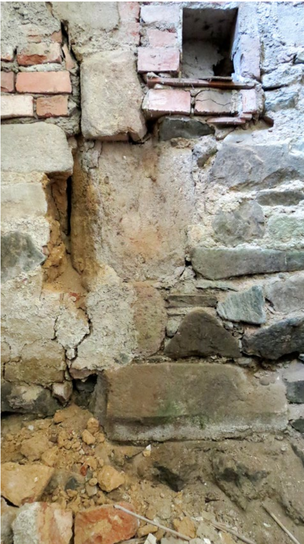
Obr. 7. Plasy, klášter. Staré opatství, přízemí, nález fragmentu armování špalety průjezdu ze 13. století, jenž umožnil základní identifikaci dispozice hostinského domu.

kláštera v dosti neutěšeném stavu. Z omezených finančních prostředků Programu záchrany architektonického dědictví se podařilo postupně opravit krov a krytinu konventu. Technický stav některých objektů však bylo možno shledat jako havarijní. Kromě hospodářského dvora (který byl až do roku 2006 v soukromých rukách) se jednalo o budovu starého opatství. Ta zůstala navíc dlouhodobě bez využití. Areál kláštera se tak stal jednou z nejvíce ohrožených významných monastických památek v českých zemích. V roce 2006 se podařilo rozšířit financování oprav areálu kláštera z dotačního Programu záchrany architektonického dědictví i na postupnou sanaci krovů a opravu střež hospodářského dvora a prelatury, včetně starého opatství. V případě prelatury byla rok na to dokončena mimořádně náročná první etapa, a to oprava stropu a krovu schodiště prelatury, v té době s ohroženou nástrojnou malbou od Jana Kryštofa Lišky. Úspěšně zahájené práce byly přerušeny po převzetí bývalého opatského areálu NTM. Po navrácení části budov do správy NPÚ bylo možno dokončit opravu krovu a krytiny prelatury až v roce 2014.