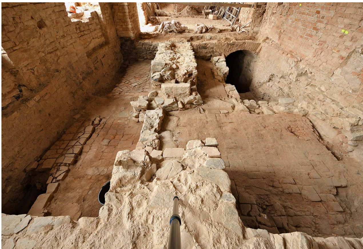
Obr. 10. Plasy, klášter. Přízemí starého opatství, část odhalené dispozice středověkého opatského domu.