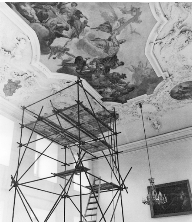
Obr. 5. Plasy, klášter. Prelatura, opatská aula, restaurování štukové výzdoby stropu.

prohloubilo poznání stavebního vývoje areálu, a zejména starého opatství. Jeho dnešní budova zahrnuje ve svých zdech nejen torzo středověkého hostinského domu opatského dvorce, ale také torzo vstupní budovy kláštera, která s opatským dvorcem původně stavebně nesouvisela. Výstavbou prelatury došlo k zásadní proměně opatského sídla. Autorství je přičítáno architektu Janu Baptistu Matheyovi, 6 elegantní zahradní pavilon je možno bez větších pochyb připsat Janu Santinimu.