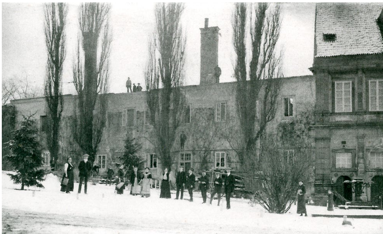
Obr. 2. Plasy, klášter. Staré opatství po požáru, pohled od západu. (Archiv autora, foto b. a., 1913)