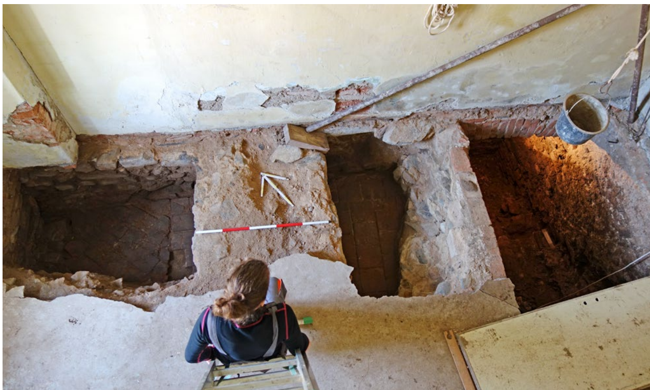
Obr. 9. Plasy, klášter. Přízemí starého opatství, archeologický výzkum hostinského domu v návaznosti na odhalený dveřní otvor z přilehlého sklepa.