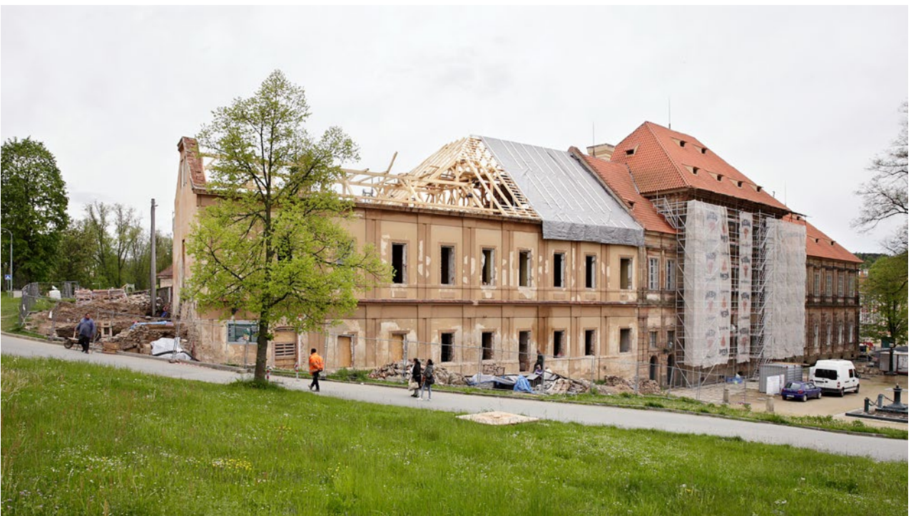
Obr. 15. Plasy, klášter. Areál prelatury od západu.

Zpevněné plochy budou dlážděny především z druhotně použitých kamenných desek. V méně exponovaných plochách, především u okapových chodníků, bude dlažba ze štětu z lomového kamene a částečně z valounů. Podél obvodových zdí budov areálu opatského domu bude terén výškově redukován na původní úroveň, především s cílem snížit zavlhání dolní partie zdí. Dosavadní terén