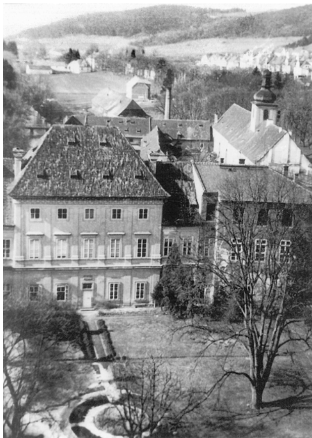
Obr. 3. Plasy, klášter. Pohled na prelaturu a její zahradu z věže sýpky. Za zemědělským dvorem kláštera je vidět středověká klášterní stodola, zbouraná v roce 1947.

byla jeho hospodářská část předána Národnímu technickému muzeu (dále NTM). 3