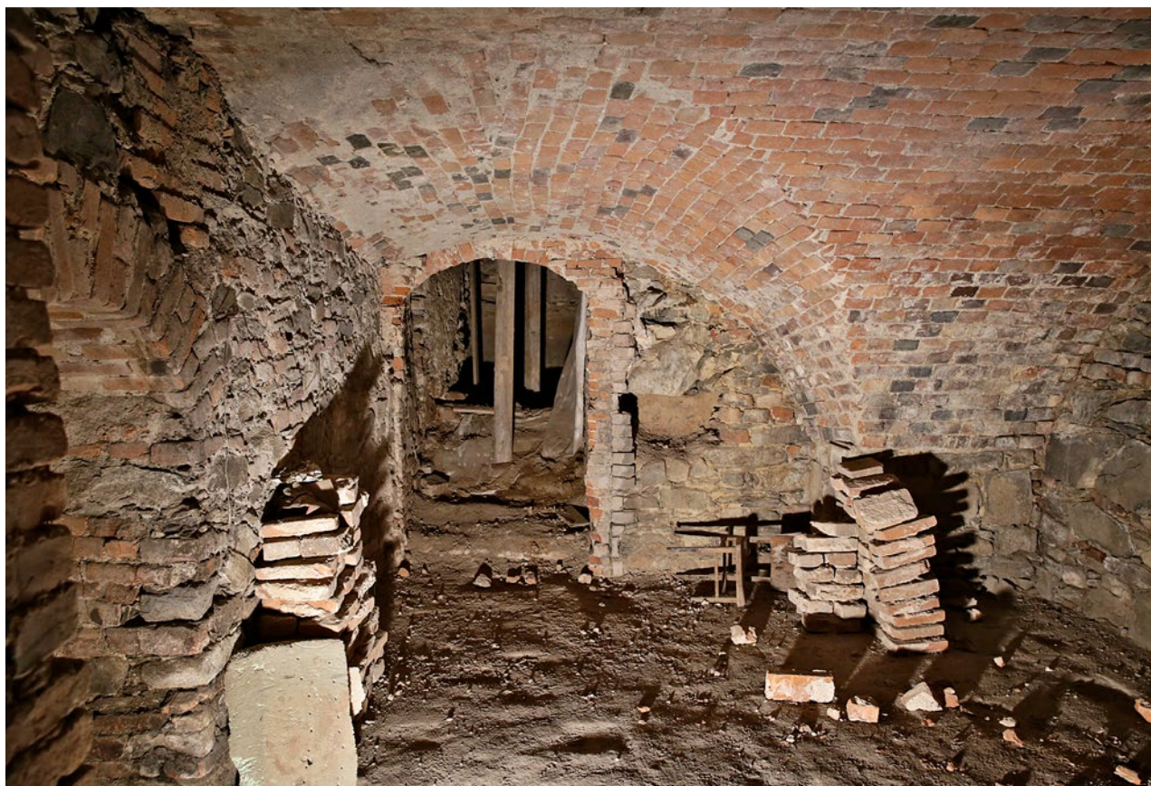
Obr. 8. Plasy, klášter. Sklep starého opatství, odhalený barokní dveřní otvor byl podnětem pro zahájení archeologického výzkumu středověkého opatského domu.