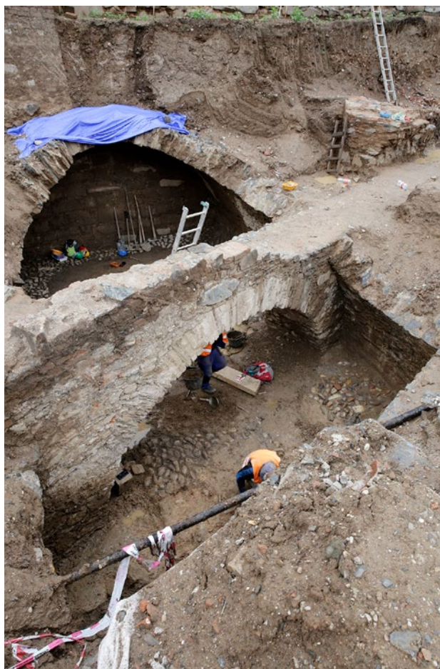
Obr. 13. Plasy, klášter. Opatská zahrada, výzkum zaniklého středověkého objektu, protknutého základem zdi zbouraného severního křídla barokní arkádové chodby.

bez nových architektonických úprav a dispozičních změn. Větším stavebním zásahem, kromě sanace stropů, je pouze odstranění vestavby novodobého sociálního zařízení, vybudovaného pro provoz městské knihovny. Tato vestavba způsobila napadení hrázděných konstrukcí „metternichovských“ příček dřevokaznou houbou (dřevomorkou domácí). Základním principem probíhající obnovy je volba tradičních technologických postupů a materiálů. Stejný přístup je zvolen i u konstrukcí, které jsou skryty (například skladby stropních konstrukcí). Mimořádná pozornost je také věnována uchování torzálně dochované štukové výzdoby reprezentačních sálů, skryté pod omítkou z 19. století. Tu se již podařilo zachovat i v místech, kde došlo k výměně částí stropních trámů a prkenných a lištových konstrukcí podhledů v rámci sanace ohnisek dřevomorky. 16 V reprezentačních sálech a obytných místnostech prvního patra je zajištěn podrobný průzkum výmalby stěn a stropů z různých období 19. století. Cílem je malby co nejvěrněji rekonstruovat. Vzhledem k umělecké hodnotě nalezené nástrojní malby v nárožním sále zde výjimečně bude částečně rekonstruována i původní štuková výzdoba. Z hlediska ochrany tohoto výjimečného stavebního díla je mimořádně obtížným úkolem obnova vnějších fasád s dominantním podílem mistrovsky