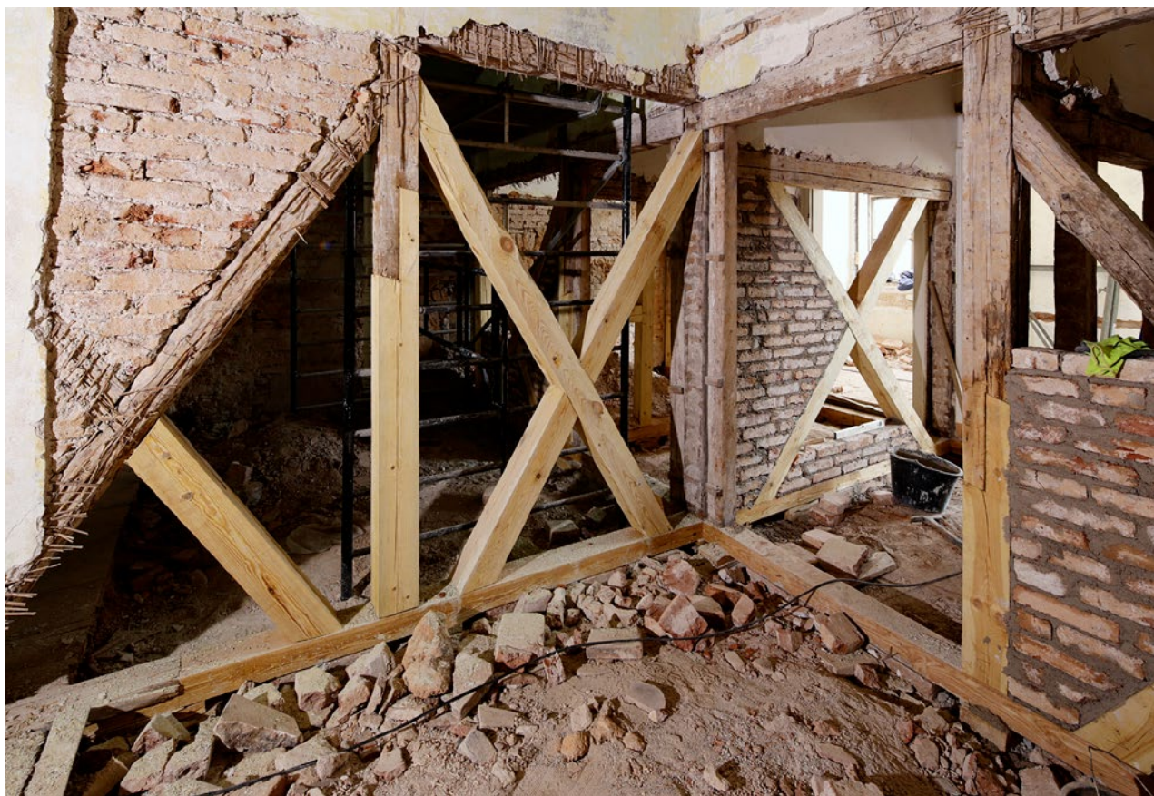
Obr. 11. Plasy, klášter. První patro prelatury, oprava hrázděných příček z třicátých let 19. století, napadených dřevomorkou.

zahradu s ohradní klášterní zdí (včetně pozemku mezi ohradní zdí a ulicí Lipovou a vstupu do tzv. ledových sklepů). Stavba byla na základě výběrového řízení zahájena v říjnu 2020. 14