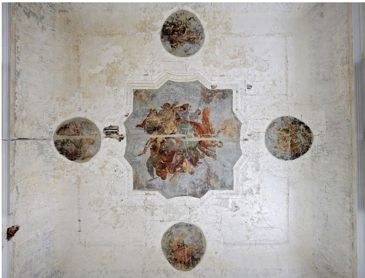
Obr. 12. Plasy, klášter. První patro prelaty, reprezentační sál, nálezy malby stropu od J. K. Lišky.

stavební činností téměř nedotčeny. Provedou se jen nutné konzervační úpravy.