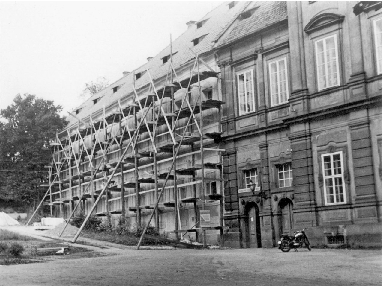
Obr. 4. Plasy, klášter. Oprava západní fasády starého opatství. (Archiv autora, foto b. a., 1956)