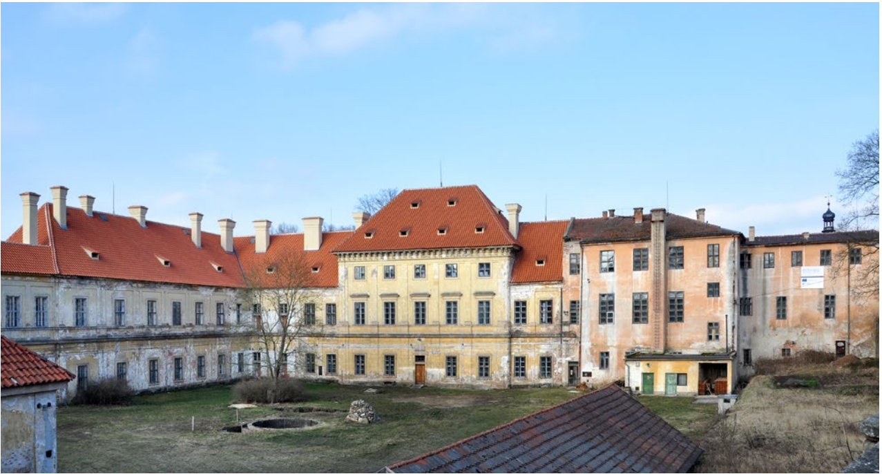
Obr. 14. Plasy, klášter. Areál prelatury od severovýchodu.