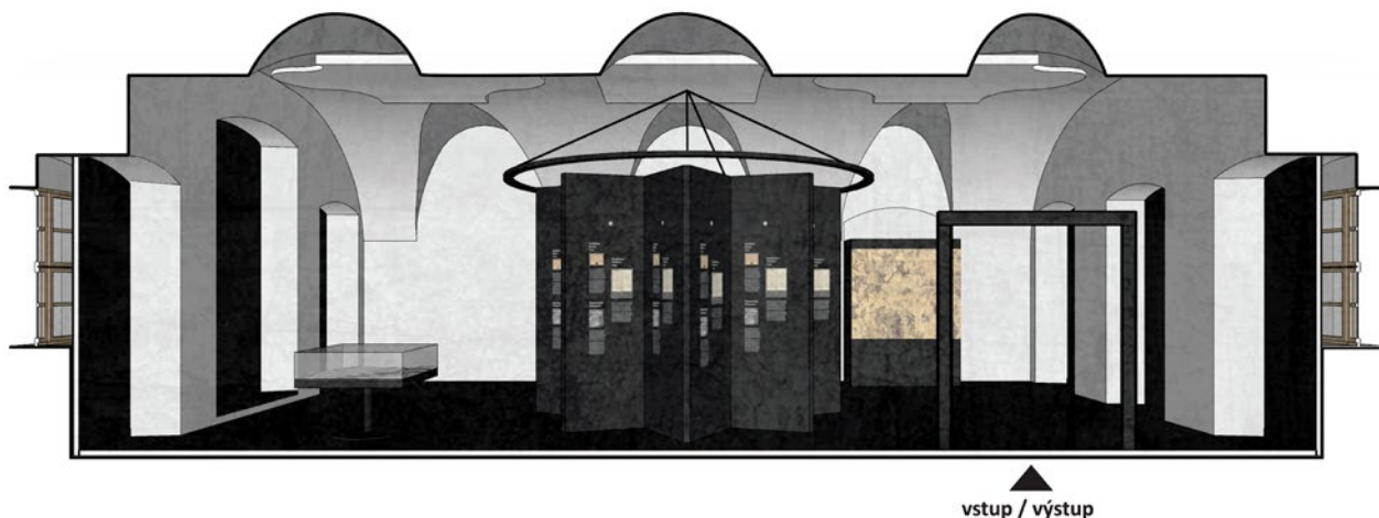
Obr. 1. Kladruby (okr. Tachov), klášter. Stará prelatura, pohled do expozice historie kláštera. (Převzato z Ateliér K světu: Expozice v Kladrubském klášteře – architektonická studie v rozpracovanosti , 2020)