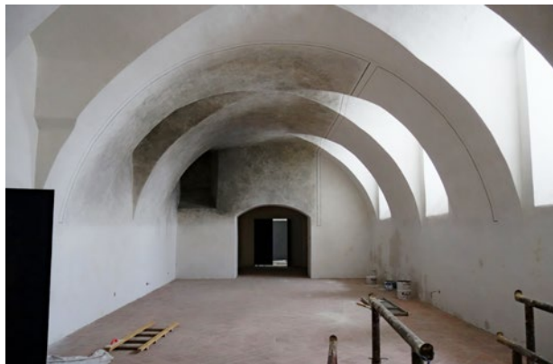
Obr. 6. Kladruby, klášter. Nový konvent, bývalá klášterní kuchyně v přízemí severního křídla – září 2020 a prosinec 2021.