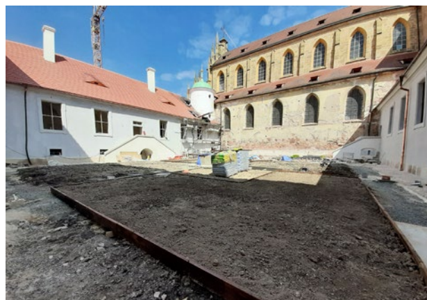
Obr. 12. Kladruby, klášter. Rajský dvůr starého konventu s obnovenými schodišti - stav v červenci 2021.

Projekt zahrnuje i obnovu rajského dvora starého konventu, která v návaznosti na náplň expozice o životě mnichů navrácí rajskému dvoru původní barokní úroveň (obr. 11) 21 včetně obou přístupových schodišť (obr. 12). Obvodová zeď severní kryté ambitové chodby je připomenuta, jak již bylo výše uvedeno, náznakovým způsobem