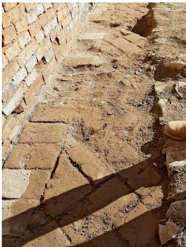
Obr. 3. Kladruby, klášter. Rajský dvůr starého konventu, nálež původní, patrně raně barokní cihelné dlažby někdejšího severního ambitu – dlažba byla obnovena jako replika v nové vrstvě. Stav v říjnu 2020.

kladrubského areálu, Ing. arch. Z. Chudárek. 1 Za všechny vzpomeňme dva velké záměry.