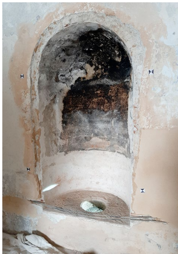
Obr. 10. Kladruby, klášter. Jeden z nových nálezů ve starém konventu – nika, patrně pro umístění nedochovaného ohříváček.

některé pivovarské stavební zásahy budou ponechány. 12 Dále bude obnoveno obslužné schodiště k refektáři a rehabilitován prostor někdejší konventní kuchyně (obr. 6, 7) – s novým využitím pro edukační sál, doplněný hygienickým zázemím, vloženým v navazující chodbě starého konventu 13 . Počítalo se též s náročnou obnovou sály terreny, 14 která měla navrátit tomuto prostoru jeho původní význam, a přitom umožnit konání reprezentativních akcí pro veřejnost (například svatby, oslavy). V patře severního křídla bylo navrženo ošetření konventní kaple konzervačním způsobem 15 (obr. 8) či prezentování unikátních barokních toalet s dochovaným spadištěm v navazující části západního křídla (které měly být veřejnosti volně přístupné) a také pozůstatků pivovarské technologie ve vystupujícím jihovýchodním rizalitu v rámci jedné z expozic. Bývalé mnišské cely, sousedící s kaplí, budou prezentovány v jedné z nových expozic. 16