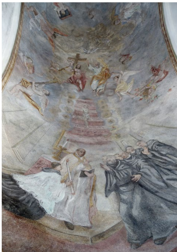
Obr. 9. Kladruby, klášter. Starý konvent, freska Smrt sv. Benedikta v kapli, stav po restaurování v červnu 2021.