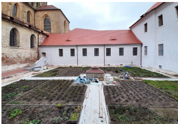
Obr. 13. Kladruby, klášter. Obnova rajského dvora starého konventu - stav v listopadu 2021.

a prostory někdejšího infirmaria 18 budou včetně prezentace odhalené barokní výmalby klenby malé kaple součástí expozice o životě mnichů (obr. 9). Dveřní výplně a výmalba prostorů budou přizpůsobeny období baroka. 19 Součástí zůstává i rehabilitovaná a doplněná druhotně vložená toaleta z 19. století, 20 včetně vstupních dveří nebo oken s vnitřními okenicemi ze stejného období, jako připomínka využití tohoto objektu pro expozituru, respektive městskou faru. Část přízemí je díky reliéfu terénu sklepem a bude přístupná formou speciálních komentovaných prohlídek, včetně otevřené části odvodňovací štol z rajského dvora. Navržena byla i obnova západní, tedy vnější fasády tohoto objektu. Během realizace došlo i zde k nečekaným objevům, které kromě rozšířeného stavebně historického poznání oživí i vlastní expozici (obr. 10).