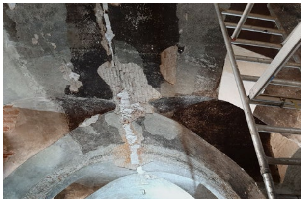
Obr. 7. Kladruby, klášter. Nový konvent, bývalá klášterní kuchyně v přízemí severního křídla. Detail stropu bývalé kuchyně v místě odbouraného dymníku.

po úvaze rozhodnuto o rehabilitování barokní podoby rajského dvora někdejšího raně barokního konventu s náznakovou prezentací severní ambitové chodby v dlažbě,