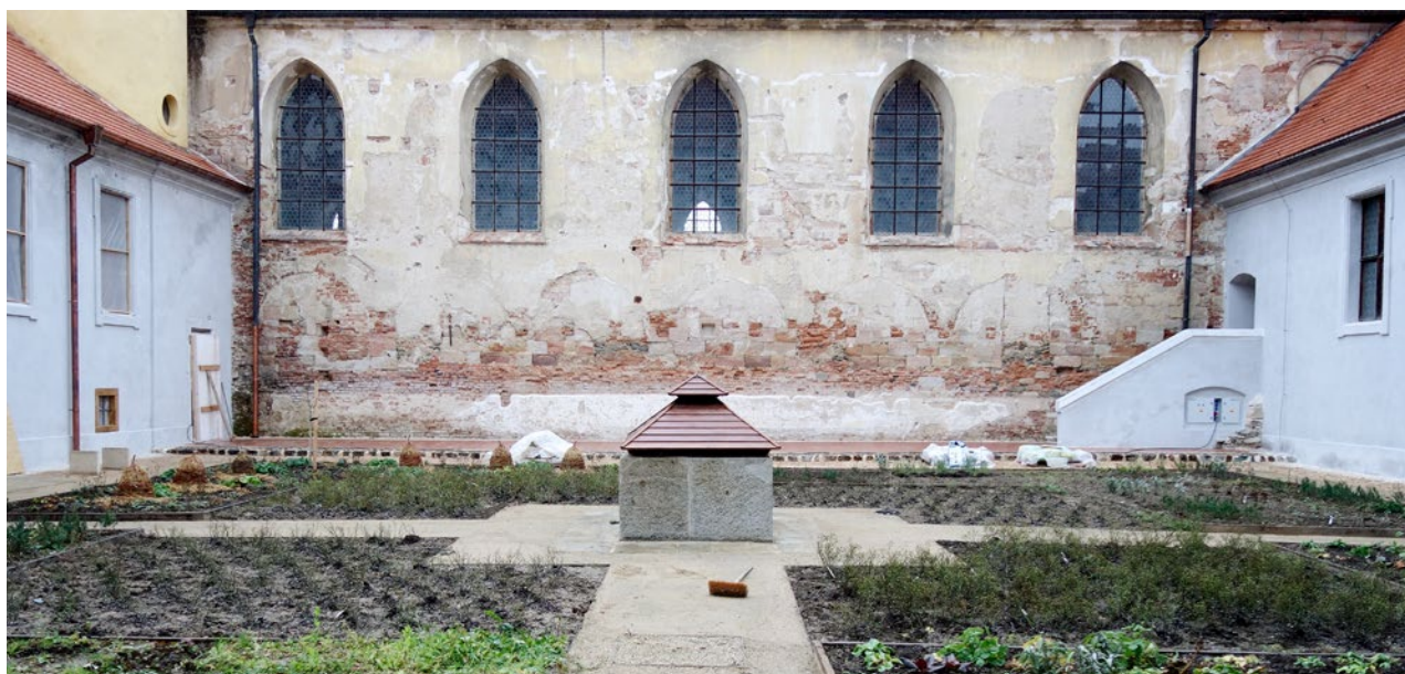
Obr. 4. Kladruba, klášter. Rajský dvůr starého konventu, stav dvora v letech 1951, 2020 a 2021.