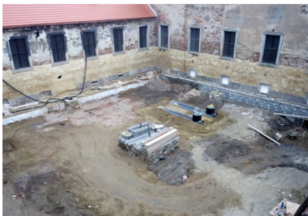
Obr. 11. Kladruby, klášter. Rajský dvůr starého konventu, pohled na dvůr - snížení „pivovarské“ přizdívky na východní (a severní) straně dvora, vybudování odvětrávacího kanálu na straně jižní (a západní), osazení nádrží pro zachytávání dešťové vody a budování základu pro kamennou nádrž ve středu dvora - stav obnovy v říjnu 2020.