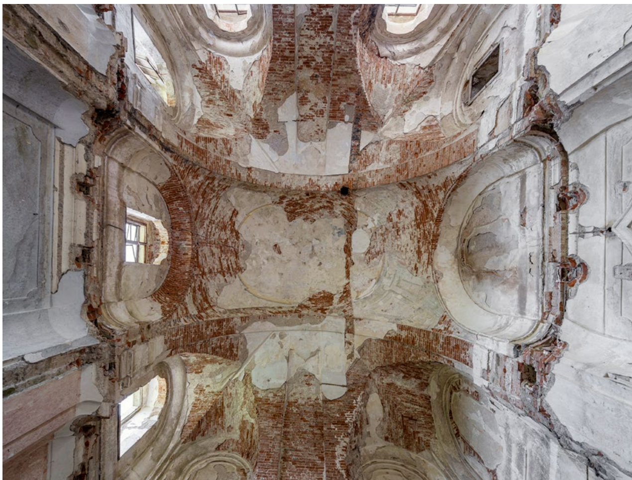
Obr. 8. Kladruby, klášter. Pohled do interiéru kaple nového konventu.

kteřá plně koresponduje s obnovovanou barokní podobou budov (obr. 4).