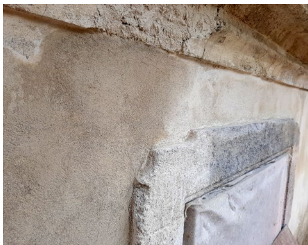
Obr. 14. Kladruby, klášter. Rajský dvůr starého konventu, postup obnovy fasády staré prelatury / východního křídla starého konventu – ponechání soudržných vrstev očištěných původních omítek a doplnění novými, stav v dubnu a květnu 2021.

V rámci návrhu měly být obnoveny všechny do dvora obrácené fasády (obr. 14) 25 , tedy i fasáda jižní lodi kostela, která měla být restaurována konzervační metodou. Okna slohově „očistěných“ fasád starého konventu (západní křídlo raně barokního konventu), staré prelatury (východní křídlo někdejšího raně barokního konventu) a nového konventu (severní křídlo) mají být vyměněna za kopie barokních oken s vitrážovým (šestiúhelníkovým) zasklením do oliva a kopiemi slohového kování 26 . Dešťové vody ze všech přilehlých střech a povrchů budou svedeny do dvou podzemních nádrží a shromažďovány pro závlivku a kamennou vodní nádrž. V rámci úprav dvora je navrženo doplnění části odvodňovací stoly, svedené přes starý konvent do páteřního kanálu. Zpracovány jsou návrhy nezbytné technické infrastruktury včetně doplnění provizorní trafostanice, která bude v rámci některé další