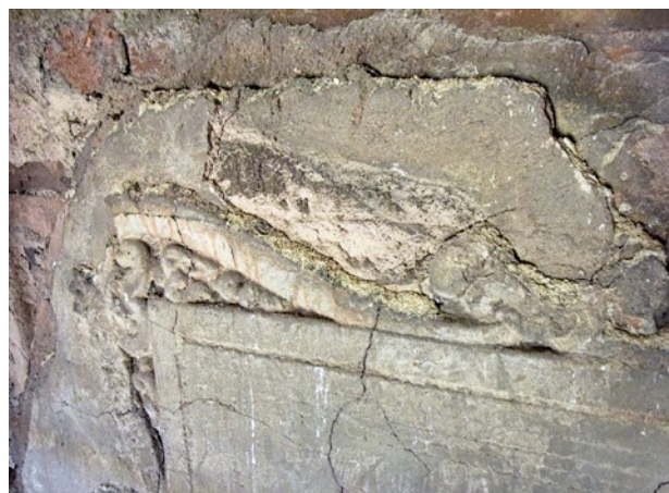
Obr. 3c. Kaceřov, zámek. Krb v prvním patře severního křídla, detail části štukového zrcadla s rytým rámováním a štukovým nástavcem.

Štukovou výzdobu měl možná ještě krb ve velkém sále západního křídla, u nějž Carl Laužil uvádí, že štukové