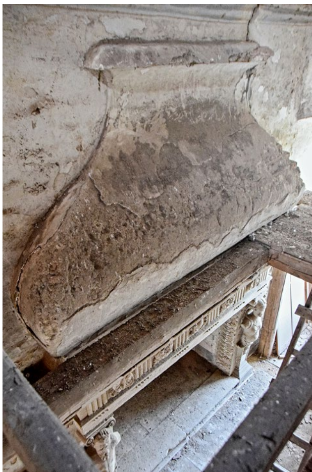
Obr. 6. Kaceřov, zámek. Dymník velkého krbu v reprezentačním sále východního křídla, pohled shora.