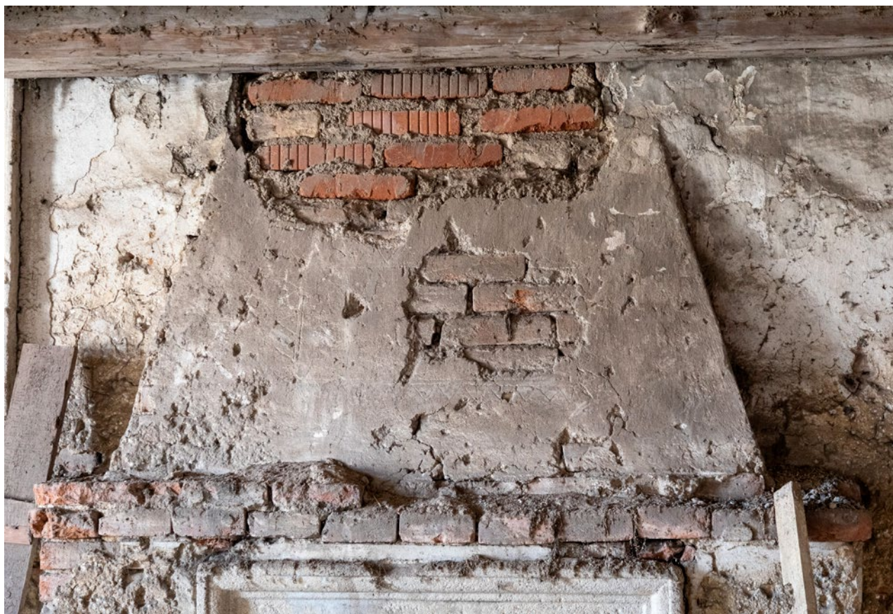
Obr. 7b. Kaceřov, zámek. Malý krb v reprezentačním sálu východního křídla, detail čela dymníku s rytým rámováním zrcadla. (Foto M. Micka, 2021)

tvůrce architektonické koncepce musel pocházet z pražského dvorského prostředí. 41 Tento vztah v jistém smyslu podporuje drobný detail, zvlněný tvar u krbového nástavce v hlavním sále na Kaceřově, který se zcela vymyká serliovskému pojetí 42 a jenž je miniaturní zmenšeninou střechy Letohrádku královny Anny (obr. 6). 43 Štuková výzdoba krbových nástavců na Kaceřově patřila pak mezi nemnoho unikátů (podobně jako na zámcích v Kratochvíli nebo Jindřichově Hradci) mezi dochovanými příklady renesančních krbů v Čechách, kde před rokem 1600 stále převažovala kamenická tradice. 44