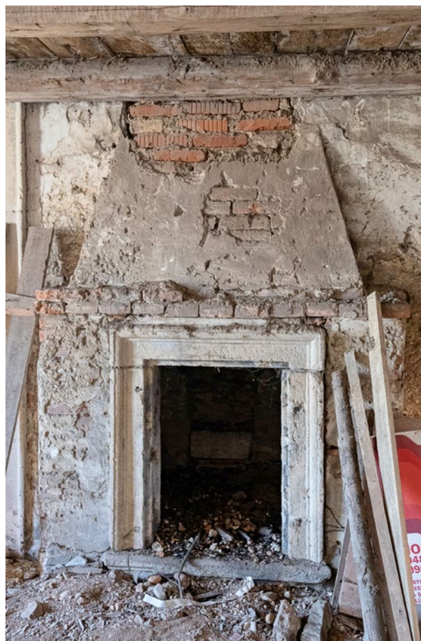
Obr. 7a. Kaceřov, zámek. Celkový pohled na jižní krb v reprezentačním sále východního křídla. (Foto M. Micka, 2021)

vzory pro kompozici kuchyňského krbu s volutovým štukovým rámcem na pyramidálním dymníku nalezneme u korintského krbu v Regole generali (spodní část) či u čtyř krbů dle italského způsobu v Il settimo libro (pyramidální nástavec). 37 Samotný štukový ornament uprostřed dymníku se inspiroval Serliovými vzory již jen volně a jako celek jej snad lze přičíst invenci kaceřovského umělce či jiné neznámé předloze. 38 Tento přístup je ostatně plně v intencích Serliových doporučení, jež v případě menších detailů opakovaně nechávaly svobodný prostor individuálnímu uměleckému ztvárnění.