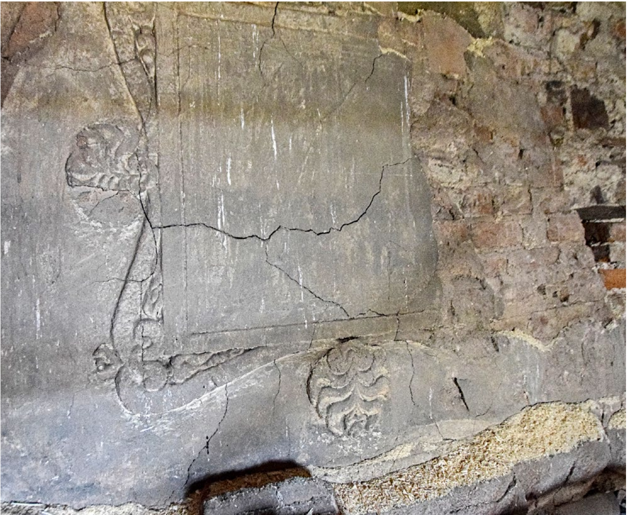
Obr. 3a. Kaceřov, zámek. Krb v prvním patře severního křídla, čelo dymníku se štukovým rámem a palmetami.

tohoto období se datuje začátek postupného chátrání zámku, např. k roku 1785 je uváděn propadlý strop západního sálu. V dalších letech, kdy bývalý klášterní majetek přešel do správy Náboženského fondu, se stav zámku výrazně zhoršoval. Klášter Plasy i s Kaceřovem následně v roce 1826 zakoupil rakouský státní kancléř Klement Václav Metternich-Winnenburg a Metternichové pak drželi kaceřovský zámek téměř sto let, od roku 1826 do roku 1922. Za nich se honosné prostory prvního patra využívaly jako sýpka a skladiště sena. 11 V přízemí byla obecní škola. Z důvodu statiky musela být snesena barokní báh z věže a později byla v roce 1875 snížena i výška věžního zdiva. Kvůli zcizování železných táhel byly také oslabovány konstrukce zavěšených stropů. Chátrání budovy vyvrcholilo devastujícím požárem v roce 1912. 12 Nevalný zájem majitelů o zámek a s tím související absence stavebních úprav paradoxně způsobily, že se stavba do dnešní doby dochovala ve víceméně původní renesanční dispozici.