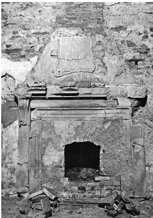
Obr. 3b. Kaceřov, zámek. Krb v prvním patře severního křídla, pohled na krb od západu.

Co se interiérového vybavení týče, jsou výtvarné kvality shledávány zejména ve výjimečně skupině bohatě zdobených krbů, jejichž dymníky nesly v nejednom případě štukovou výzdobu (obr. 1). Z dvanácti honosných krbů se do dnešních dnů bohužel dochoval jen zlomek (nejcelistvěji dva krby ve velkém sále východního křídla), přičemž ty se štukovou výzdobou jsou dnes ztraceny zcela. 14 Představu o jejich vzhledu si tak můžeme učinit již jen z fotodokumentace či starších nákresů. 15 Náročný vytápěcí systém zámku doplňovala původně vedle krbů také kachlová kamna, která se ovšem žádná nedochovala. 16 Většina z nich se nacházela v obytném prvním patře. Typologicky můžeme rozdělit krby do dvou skupin: první sestává z krbů s architektonicky řešenou představenou konstrukcí dymníku s kladím a konzolami, 17 druhou skupinu tvoří pouhé niky ve zdi s jednoduchým ostěním a krbovou římsou. 18 Římsy, konzoly, ostění krbů a v jednom případě i architektonizovaný nástavec byly z pískovce, pláště dymníků z omítnutého cihelného zdiva a někdy také s ornamentální štukovou výzdobou, rámuující malířský či sgrafitový dekor. 19