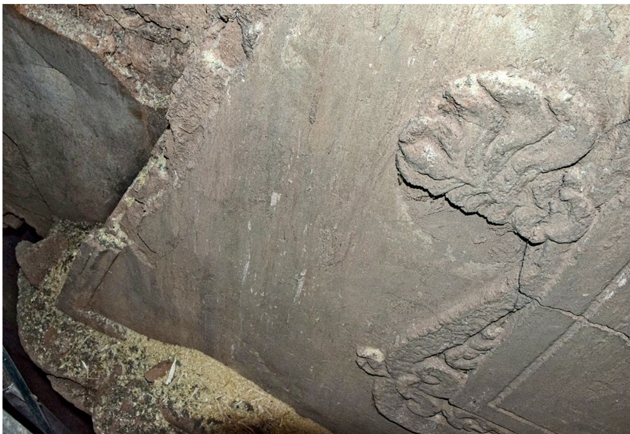
Obr. 4. Kaceřov, zámek. Krb v prvním patře severního křídla, detail poškozené palmety a rámu na východní straně dymníku.

pravouhlým profilovaným odstupňovaným ostěním, jež je zdobeno dvěma řadami perlovce. Na něm spočívá soudkovitý vlys. Pískovcovou římsu podpírají navíc po stranách dvě stojky s volutovými konzolami pokrytými listy s akanťovým přívěskem (obr. 2a, b). Na ní stojí zděný dymník, na hranách s maltovým rámem, v jehož středu se nachází velká plocha zrcadla, rámovaná čtvercovou štukovou lištou s volutami a palmetami (obr. 3a, b). Dle provedených sond se ve středu štukového zrcadla nenacházela žádná výplň, ani letopočet. 23 Patrně je však ryté rámování na vnitřní straně štukové kartuše (obr. 3c). Palmety a zřejmě i další náročnější štukové plastické články byly nalepeny do připraveného maltového lože na povrchu dymníku (obr. 4). Jeho povrch byl později několikrát přebílen. Samotný dymník dlátovitého tvaru je do hloubky velice subtilní.