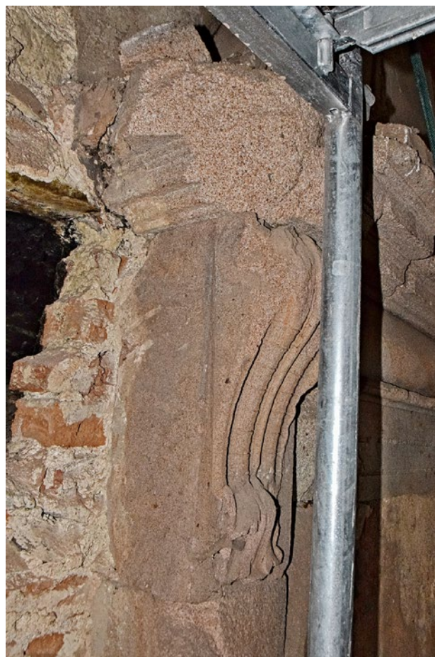
Obr. 2a, b. Kaceřov, zámek. Krb v prvním patře severního křídla, levá konzola.

S novým vlastníkem nastalo nejzářnější období v dějinách kaceřovského statku a zejména velkorysá přestavba stávajícího sídla na „moderní“ zámek. Korespondencí s českou královskou komorou lze doložit intenzivní stavební činnost od jara roku 1540 až do roku 1563. Ferdinand povoloval zvyšovat zástavní částku vždy na základě přesného vyúčtování investic. Ty směřovaly zejména do přestavby středověké tvrze, která zde stála snad již ve druhé polovině 14. století. 3 Jejím nejvýznamnějším pozůstatkem je věž, prostupující v celé výšce východní části severního křídla renesanční novostavby. 4 Jako zámek je objekt poprvé zmíněn v roce 1544. Zástavní suma se do roku 1563 zvýšila z původních 2 750 kop českých grošů na závratnou sumu 13 585 kop. 5 V roce 1549 muselo být jedno, patrně východní křídlo zámku téměř hotovo, jak napovídá objednávka kmenů pro stavbu krovu. 6 Poté se zřejmě pokračovalo výstavbou jižního křídla, což dokládá letopočet 1552 na dnes již nedochovaném dymníku krbu v kuchyni. 7 Do roku 1549 je dále datován údaj v povolovacím majestátu, zmiňující „stavění nemalé k bezpečnějšímu bytu“ na Kaceřově, což snad můžeme dát do souvislosti s výstavbou důmyslného opevňovacího systému zámku, na jehož realizaci muselo Gryspekovi záležet zvláště po událostech roku 1547, kdy byl na krátkou dobu uvězněn protestantskými stavy jako exponent Ferdinanda I. 8 V roce 1558 se uvádí v urbáři, že zámek Kaceřov „jest všecken z gruntu nově znamenitým nákladem velikým vystavěn“. 9