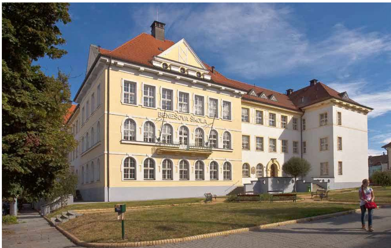
Obr. 2. Plzeň, budova čp. 1692 – Benešova škola, 1923–1925. Navrhl H. Zápál. Pohled na západní průčelí z Doudlevecké třídy.

renomovaní architekti. Obdobně tomu bylo například ve Vídni. O to je vlastně záslužnější, že v Plzni na stavebním úřadě působil tak dobrý architekt, jakým H. Zápál bezpochyby byl.