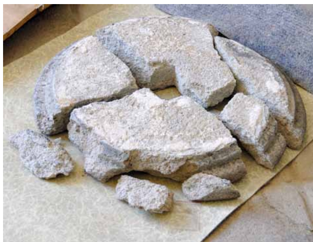
Obr. 10. Stříbrná, sloup se sochou Panny Marie Immaculaty. Část dřívku s prstencem umístěným pod hlavicí. Stav po demontáži.

O nově zhotovených sochách se zmiňuje i soupis památek z roku 1908: „Dole na nárožích stojí sochy sv. Floriána, Václava, Šebastiána a Rocha, nově vytesané při poslední opravě r. 1868; uprostřed stran spodku stojí sochy sv. Antonína, Prokopa, Jana Nepom. a Františka, na menším spodku sv. Barbory, Voršily, Rosalie a neznámé světice, také obnovené při opravě.“ 21 Autoři soupisu tedy nové Wilfertovy sochy, navíc nepřesně konkretizované,