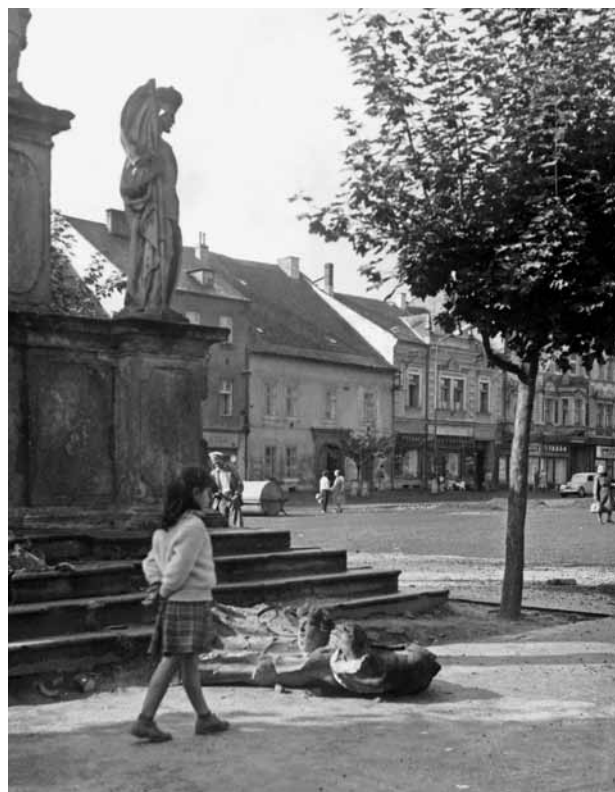
Obr. 6. Stříbrno, sloup se sochou Panny Marie Immaculaty. Pohled od severovýchodu na podstavec sloupu po vandalském útoku. (Městské muzeum ve Stříbře, foto b. a., 1962)

díla by tak spadal ještě do doby života K. Widemanna, který zemřel právě v roce 1725.