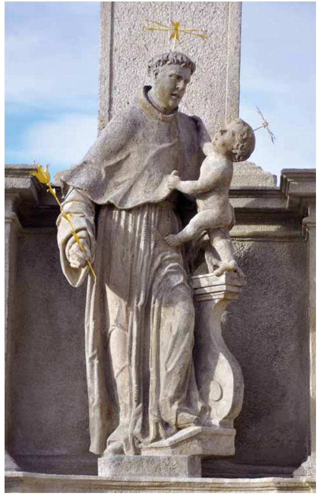
Obr. 14. Stříbro, sloup se sochou Panny Marie Immaculaty. Socha sv. Antonína Paduánského s Ježíškem. Stav po restaurování.