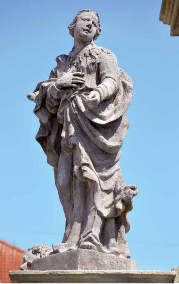
Obr. 17. Stříbro, sloup se sochou Panny Marie Immaculaty. Socha sv. Máří Magdalény.