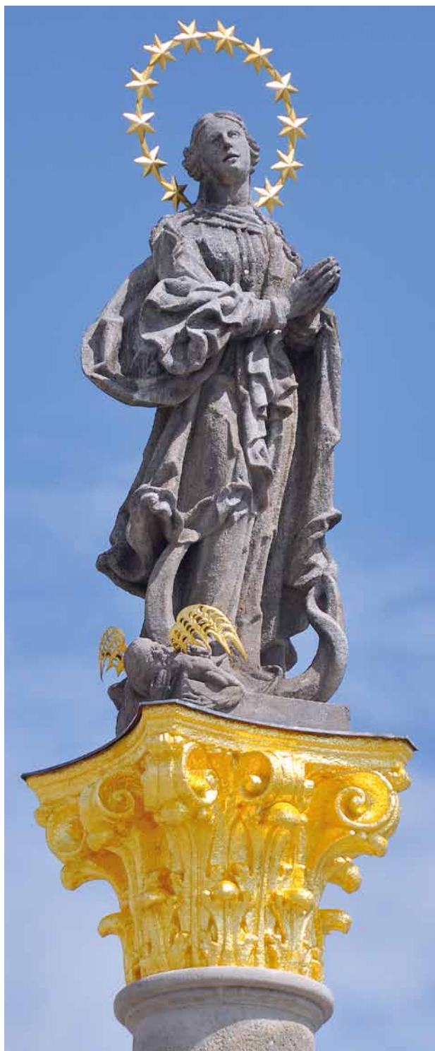
Obr. 4. Stříbro, sloup se sochou Panny Marie Immaculaty. Mariánská socha při pohledu od severozápadu.

Jak už bylo výše naznačeno, k sochařské výzdobě patřily také čtyři nevelké, ale živě působící figury andělů sedící na římsě při patce sloupu, které se nedochovaly a které byly odstraněny zřejmě během výměny soch v letech 1893–1894.