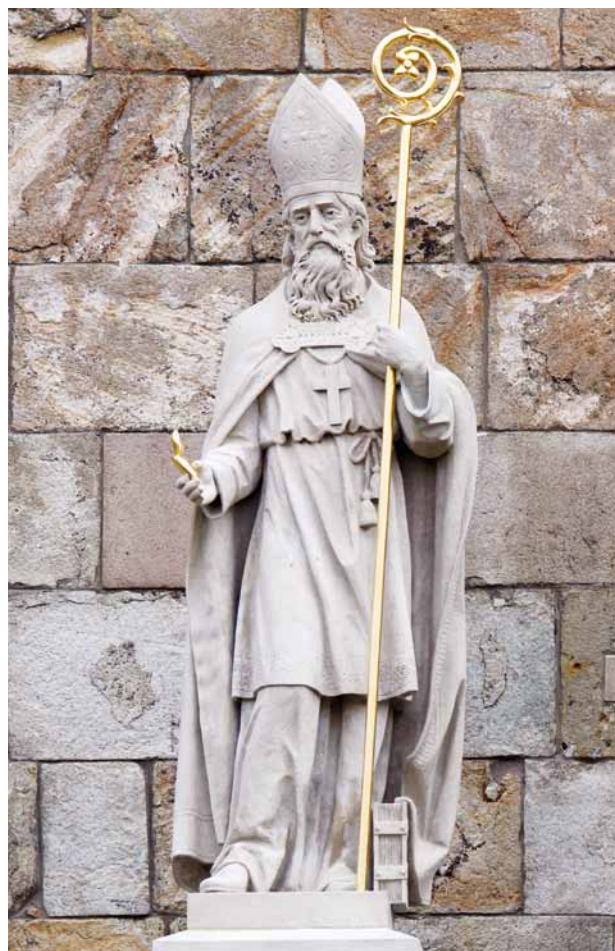
Obr. 8. Teplá (okr. Cheb), klášter premonstrátů, kostel Zvěstování Panny Marie. Socha sv. Augustina. (Foto J. Štěrba, 2014)