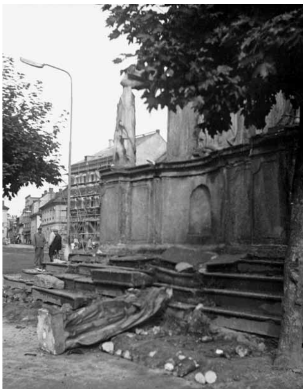
Obr. 5. Stříbrno, sloup se sochou Panny Marie Immaculaty. Pohled od jihovýchodu na podstavec sloupu po vandalském útoku.