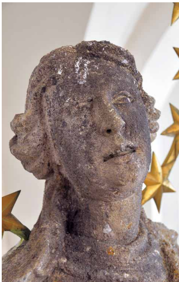
Obr. 11. Stříbro, sloup se sochou Panny Marie Immaculaty. Detail hlavy mariánské sochy. Stav po sejmutí sochy před jejím očištěním.

má být „ochráněn před rozpadem brzkým restaurováním“ a že tamní obec se již v této záležitosti obrátila na Státní památkový úřad. Mayerl tedy prosil o sdělení, do jaké míry jsou tyto informace pravdivé, případně kdy je možno počítat se zahájením prací, a sděloval, že on sám má živý zájem o získání této práce, „pokud tam jde také o doplnění chybějících částí figur.“ K. Kühn odpověděl 28. 4. 1931. Uvedl, že při své poslední návštěvě ve Stříbře již dal pokyny k opravě památky. 22 Informace o případné realizaci této opravy však nemáme a zdá se, že k ní nakonec vůbec nedošlo.