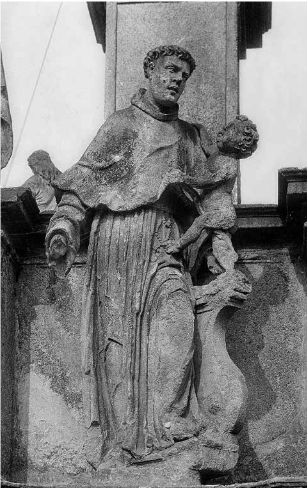
Obr. 13. Stříbro, sloup se sochou Panny Marie Immaculaty. Socha sv. Antonína Paduánského s Ježíškem.