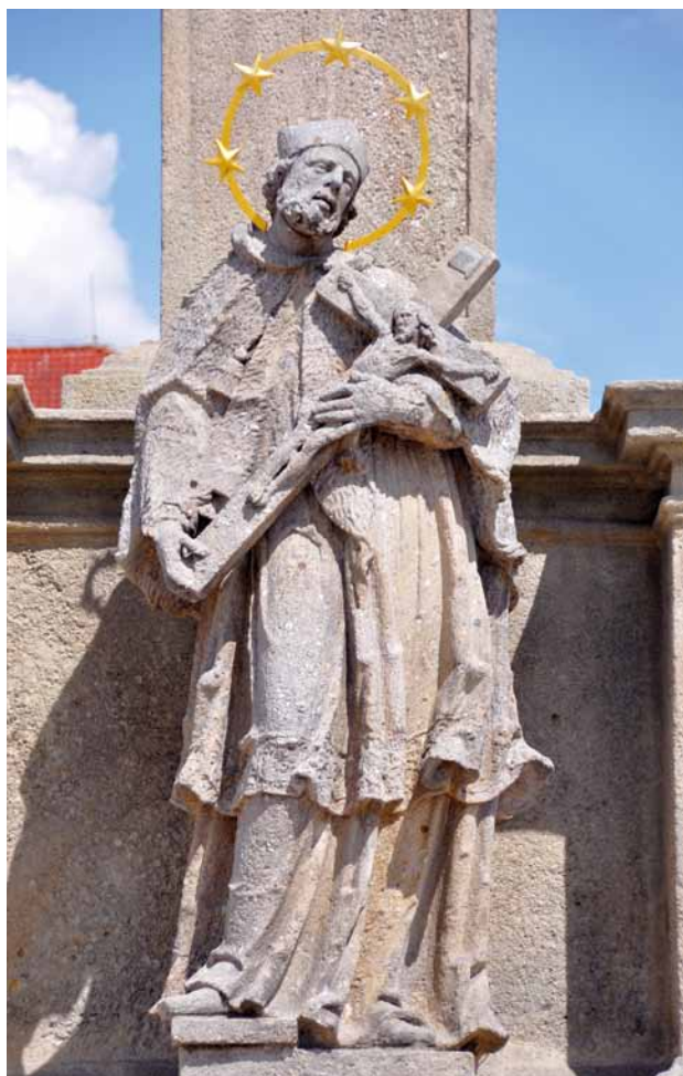
Obr. 15. Stříbro, sloup se sochou Panny Marie Immaculaty. Socha sv. Jana Nepomuckého.