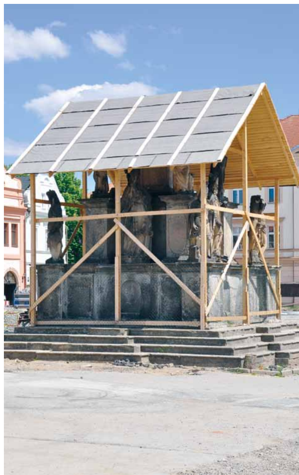
Obr. 12. Stříbro, sloup se sochou Panny Marie Immaculaty. Provizorní zakrytí spodní části včetně sochařské výzdoby během restaurování.

V roce 1962 bylo rozhodnuto o restaurování sousoší. Restaurátorská komise Českého fondu výtvarných umělců pověřila provedením díla ak. soch. A. Tintěru a R. Kabeše, kterým to bylo oznámeno 30. 8. 1962. Oba restaurátoři si