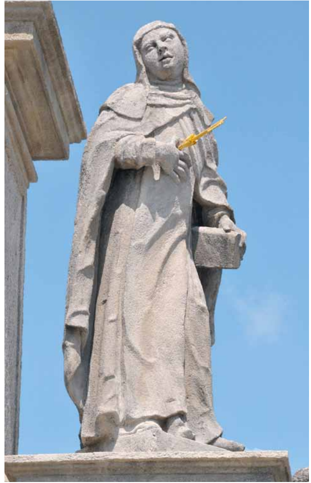
Obr. 18. Stříbro, sloup se sochou Panny Marie Immaculaty. Socha sv. Terezie z Ávilý.

provedeno mnohonásobnou fixáží vápenným mlékem. Po dohodě s historikem Dr. Pavlíkovou, která měla nad touto akcí dozor, nebyla provedena rekonstrukce rukou u čtyř plastik. Rovněž u sochy sv. Antonína nebyla provedena rekonstrukce dítěte (není dochována fotodokumentace o původním stavu). 27 – K právě uvedené restaurátorské akci (obr. 9) se váže, ovšem až zpětně a se špatným datem, stručný zápis v kronice města Stříbra z roku 1974: „[...] Tyto sochy byly v roce 1964 [!] Fichtlem a spol. strženy a památková správa ve spolupráci s městským národním výborem nechaly udělat opravu soch v hodnotě 450 000 Kč.“ 28