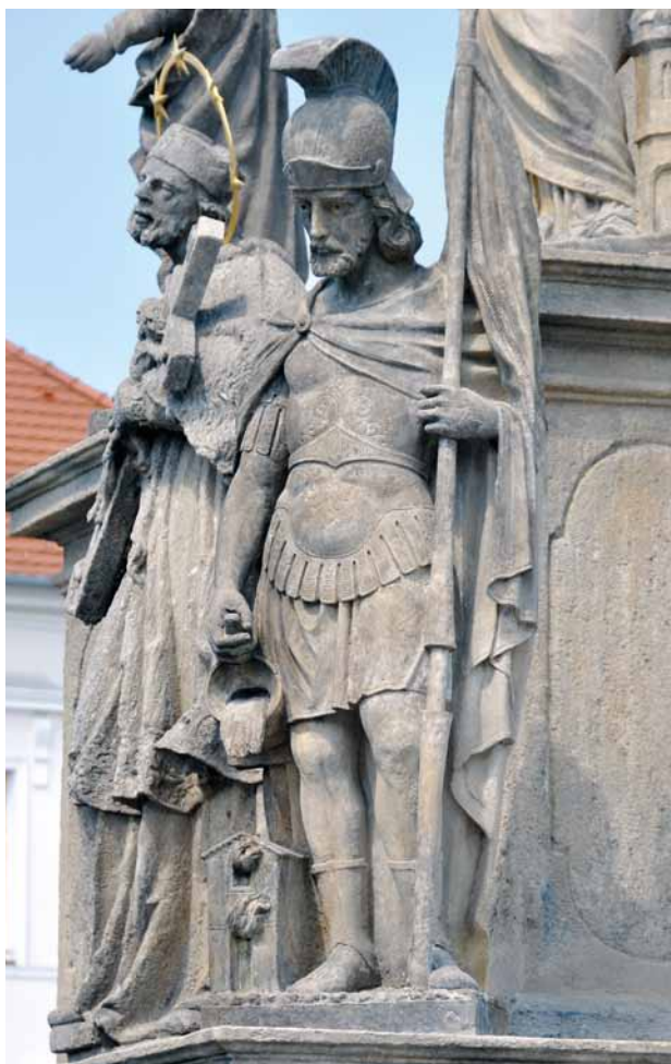
Obr. 19. Stříbro, sloup se sochou Panny Marie Immaculaty. Socha sv. Floriána. V pozadí socha sv. Jana Nepomuckého.

schody byly mechanicky značně poškozeny, jejich spárování uvolněné a nefunkční, takže dešťová voda pronikala do základů. Kámen celé statue byl povrchově korodován, četné byly plomby různého stáří. Směrem k radnici se na dřívku – u jeho paty a uprostřed – nalézaly dvě lasovité trhliny. Sloup byl podle K. Granáta dokonce „viditelně nakloněn do strany“. 29 Na povrchu dřívku se dochovaly zbytky vápenných nátěrů světle modré barvy, u hlavice tmavých nátěrů a zlacení. Mariánská socha byla silně poškozena; na zádech jí chyběla velká část modelace drapérie. Na křídlech draka pod nohama Panny Marie provedených z kovu ulpávaly vrstvy rozsáhlé koroze. Zřejmě nejhorší byl stav sochy sv. Rozálie – eroze ji poničila do hloubky a celá plastika byla na hranici své životnosti. Souhrnně K. Granát vyhodnotil stav mariánského sloupu jako havarijní s tím, že je třeba neprodleně přikročit k jeho záchrane a restaurování.