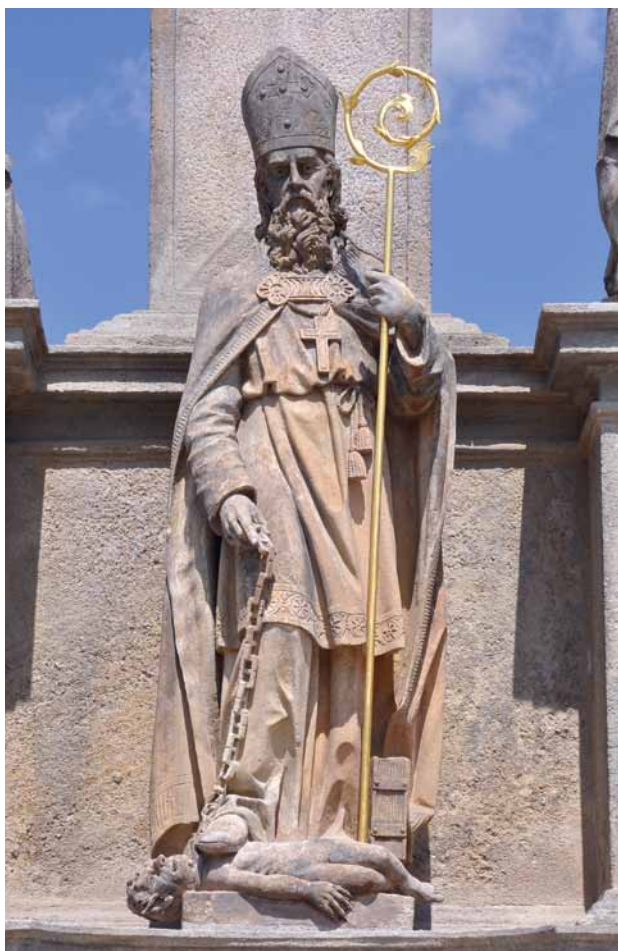
Obr. 7. Stříbro, sloup se sochou Panny Marie Immaculaty. Socha sv. Prokopa.