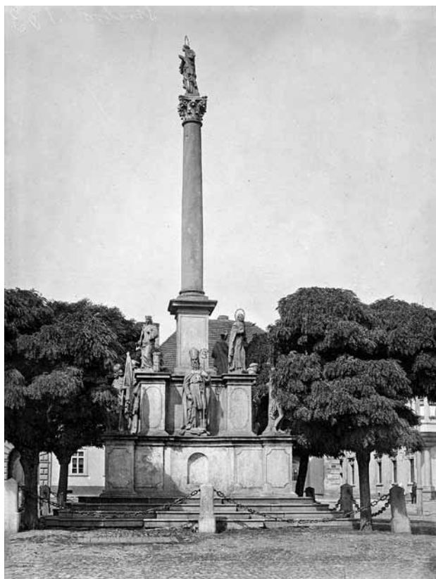
Obr. 2. Stříbro, sloup se sochou Panny Marie Immaculaty. Pohled od jihu.