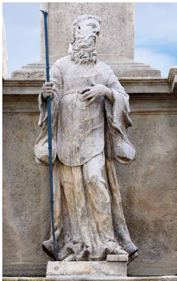
Obr. 16. Stříbro, sloup se sochou Panny Marie Immaculaty. Socha sv. Františka z Pauly.

naštěstí téměř vodorovnou a osazení půjde provést rovněž autojeřábem. K alternativě provedení kopie, kterou uvádí Dr. Pavlíková, mohu po prohlídce doplnit, že socha Barbory (19. stol.) je sice silně poškozena, přeražena, rozbita a otlučena, ale kámen je zdravý a sochu bude možno sesadit a restaurovat. Vzhledem k novým skutečnostem bude třeba, aby restaurátoři, provádějící opravu, předložili nový rozpočet na zbývající torso sloupu a na restaurování soch poškozených pachatelů. 24