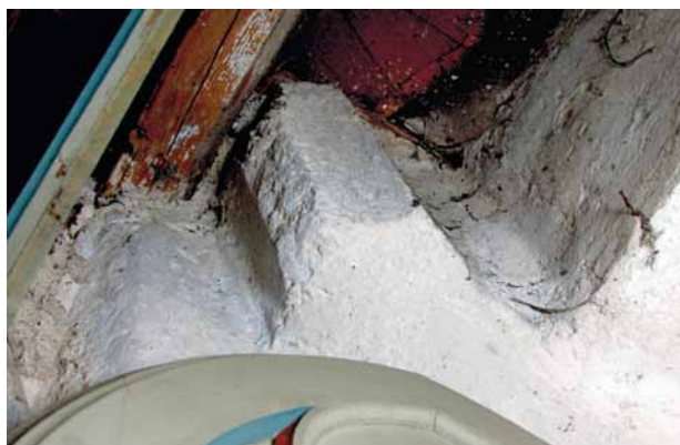
Obr. 5. Nezamyslice, kostel Nanebevzetí Panny Marie. Torzo žebra gotické klenby v severozápadním koutu kněžiště při vstupu na kazatelnu.

Předchozí badatelé si sice povšimli negativu odstraněného krovu kněžiště, ale jejich interpretace nálezové situace není přesná. 17 Severní krokev je otisknuta nejen ve hmotě štítu, ale její pata i v navazující stěně zvonice, což prozrazuje, že krov byl dokončen už v době, kdy ještě nestála vyšší patra věže a štít. Svislá spára a chybějící severní pata štítu potvrzují, že nejdříve zedníci provedli věž. A až po jisté době, v blíže neznámém odstupu několika týdnů, měsíců nebo spíše let, byl k ní přiložen štít, jenž předstupuje před průčelí věže o 5–10 cm. Ze zaměření chrámové stavby včetně jihovýchodního nároží lodi vyplývá, že východní zeď lodi a západní zeď věže mají stejnou tloušťku a teprve na korunu východní zdi lodi byl postaven