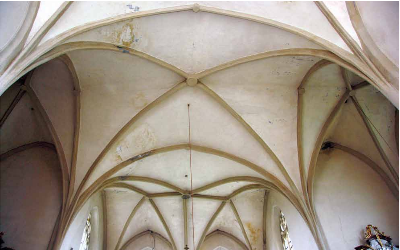
Obr. 13. Nezamyslice, kostel Nanebevzetí Panny Marie. Klenba střední části a závěru kněžiště.

O zvýšení a zapojení západní části staršího presbytáře do novostavby kněžiště na křížovém půdorysu na konci 14. století svědčí odhalené ostění menšího lomeného okna na jižním průčelí, jak již bylo zmíněno výše. V interiéru je kromě toho vidět odlišné provedení klenební konstrukce, kterou v rozích klenebních polí nové části podchycují při stěnách válcové přípory vyrůstající od podlahy a přízední žebra polovičního profilu. Naproti tomu v západním poli vybíhají klenební žebra při vítězném oblouku z kuželových konzol zapuštěných do obvodového zdiva; z pochopitelných důvodů se zde rezignovalo na vybourání kapes v existujícím lomovém zdivu a na vsazení opracovaných prvků klenebních přípor.