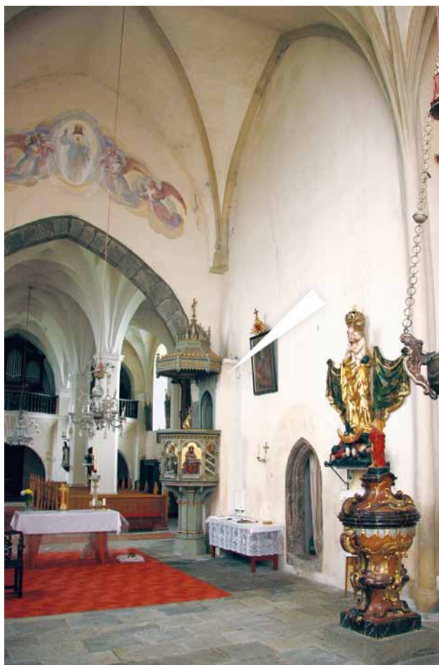
Obr. 4. Nezamyslice, kostel Nanebevzetí Panny Marie. Pohled z ol-tářního prostoru směrem ke kazatelnu a do lodi. Šipkou při vstupu na kazatelnu je označeno místo nálezu pozůstatku žebra klenby, kterou bylo kdysi opatřeno kněžiště staršího gotického kostela.

až k jižní stěně kněžiště. Je známkou toho, že kostel zprvu postrádal dělicí střešní štít nad vítězným obloukem a že krov zaniklého kněžiště původně vnikal bez přerušení do valbové střechy lodi. Teprve při další úpravě byl nad vítězným obloukem vyzděn štít nevelké tloušťky, v jehož hmotě se na západní straně zachoval otisk vazby krovu. Naopak západní průčelí kostela uvedenou profilovanou korunní římsu postrádá. Pokud nedošlo k jejímu odstranění, je velmi pravděpodobné, že již od počátku měla loď na západní straně zděný štít.