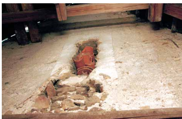
Obr. 6. Nezamyslice, kostel Nanebevzetí Panny Marie. Otisk vrcholu sedlové střechy staršího kněžiště pod větracím okénkem ve štítu nad vítězným obloukem. Pohled od východu. (Foto R. Lavička, 2015)

trojúhelníkový štít přibližně poloviční tloušťky. Nejasná však zůstává situace v jižní spodní čtvrtině štítu, kde při pohledu od západu schází otisk dolní části jižní krokev a plocha je omítnuta. Při jižním okraji se nalézá segmentově klenutá nika s kamenným okoseným ostěním vsazeným do východního líce štítu. Způsob vyzdění a poloha ukazují, že otvor vznikl současně se štítem a uplatňoval se při pohledu z exteriéru nad starší střechou kněžiště. Menší měřítko a otvory v kamenném ostění vedou k interpretaci otvoru nejspíš jako zamřížovaného okna. Stavba štítu nad vítězným obloukem souvisí s blíže neznámou úpravou střechy ještě před vybudováním nového kněžiště na konci 14. století, tedy v době, kdy se ukázalo jako potřebné obě konstrukce krovů oddělit navzájem pomocí zděného střešního štítu.