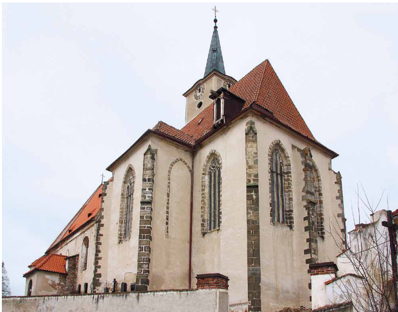
Obr. 14. Nezamyslice, kostel Nanebevzetí Panny Marie. Pohled na kněžiště od jihovýchodu.

kostel sv. Jiljí; Bavorov, kostel Nanebevzetí Panny Marie; Miličín, kostel Narození Panny Marie; Soběslav, kostel sv. Petra a Pavla a další, 43 je pravděpodobnějším vysvětlením, že všechny uvedené stavby byly inspirovány a ovlivněny prostřednictvím svých patronů (klášter v Břevnově, Rožmberkové) dílem soudobých stavebních hutí přímo z Prahy a bez bližších souvislostí navzájem. 44