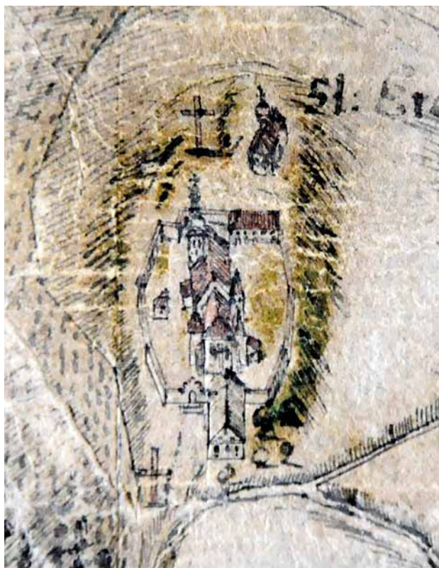
Obr. 12. Isidor Peller: Přehledná mapa panství Žichovice, Žihobce a Rabí v Prácheňském kraji. 1755. Kolorovaná kresba, 3,42 × 2,35 m. Měřítko nečitelné. Detail s vyobrazením kostela v Nezamyslicích. SOA Plzeň, pracoviště Klášter, Velkostatek Žichovice, inv. č. 1712, M 1.

Jihozápadní věž kostela v Nezamyslicích mohla sloužit ve svém prvním patře jako tribuna nebo její součást. Ve vyšších patrech mohla obsahovat depozitář náležitě zabezpečený pro uložení majetku. Na barokním obraze s vedutou kostela z doby po roce 1626 má věž asi dřevěné nebo hrázděné, zčásti konzolovitě vysazené poslední patro s jehlancovou střechou. Obrannému charakteru věže i celého kostela by mohla nasvědčovat rovněž ohradní hřbitovní zeď, v jejíž hmotě jsou na stejném obraze vidět střílny (obr. 11, 12). 32