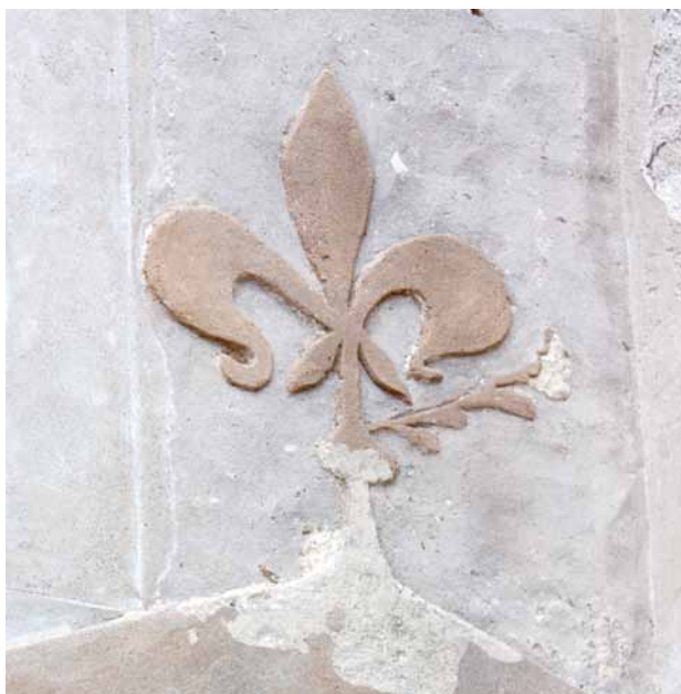
Obr. 15. Nezamyslice, kostel Nanebevzetí Panny Marie. Zazděný gotický vstupní portál na jižní straně lodi – detail vrcholu pasparty s motivem lilie.

portál časově zařadit do doby přestavby kostela v letech 1390–1400. Nejspíš stejně starý je kružbový vlys s motivem lilie, téměř stejným jako ve vrcholu pasparty jižního portálu, namalovaný na omítce stěn uvnitř lodi po celém obvodu jejího kdysi plochého dřevěného stropu, včetně stěn koutové věže (obr. 16).