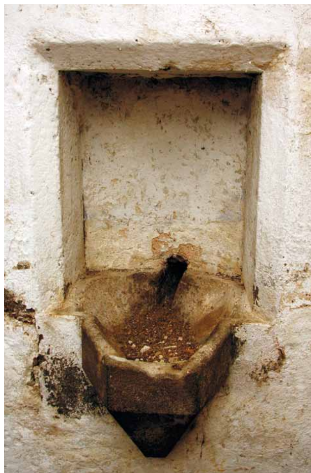
Obr. 8. Nezamyslice, kostel Nanebevzetí Panny Marie. Přízemí severní zdi věže. Nika s lavabem v tlouštku severní zdi.

pozdně románská z druhé, nejpozději třetí třetiny 13. století. 19 Okosená kamenná římsa soklu, jež plynule přechází ze severní stěny lodi na západní, severní a východní vnější stěnu zvonice, vypovídá, že věž byla postavena současně s plochostropou lodí a nižším klenutým, zřejmě polygonálně ukončeným kněžištěm. Přízemí věže je přístupné z presbytáře lomeným profilovaným portálem, jenž byl znovu odhalen při opravách stavby v první polovině šedesátých let 20. století. 20 Interiér je sklenut křížovou klenbou s klínovými, oboustranně vyžlabenými žebry o průřezu 20 × 14 cm, která vybíhají v koutech přímo ze stěny bez konzol, jsou složena z tvarovek o délce přibližně 50–60 cm a ve vrcholu se nepravidelně napojují na kruhový svorník (obr. 7). Tato žebra se neshodují co do rozměrů a profilu s pozůstatkem gotického klenebního žebra nad vstupem na kazatelnu; navíc vrchol klenby zasahuje do prostoru prvního patra věže tak, že jeho strop musel být odstraněn. Lze tedy předpokládat, že přízemí věže bylo zaklenuto s jistým časovým odstupem po dokončení stavby. S tím ostatně souvisela i změna úrovní jednotlivých podlaží ve věži. Pozůstatky dvou trámků a zazděné kapsy ve východní a západní stěně prvního patra ukazují polohu zaniklé podlahy, která odpovídá prahu zazděného vstupu v jižní obvodové zdi, jímž se vcházelo do prostoru nad klenbou kněžiště. K zaklenutí přízemí a úpravě vyšších podlaží na