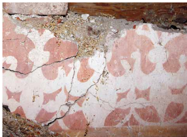
Obr. 16. Nezamyslice, kostel Nanebevzetí Panny Marie. Půda lodi. Pozůstatky kružbového pásu s motivem lilii malovaného na omítce svislých stěn včetně koutové věže.