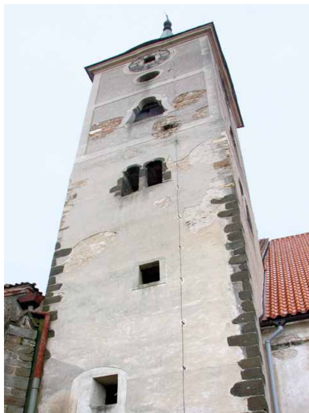
Obr. 10. Nezamyslice, kostel Nanebevzetí Panny Marie. Severní věž při pohledu od severozápadu. Těsně pod zvonovým patrem s podvojnými okny je patrná změna v charakteru nárožní armatury.

Proti předpokladu tradovanému v literatuře, že severní věž nezamyslického kostela je původem pozdně románská, mluví nepřerušovaný průběh a navázání soklu, jenž je společný pro severní zeď lodi a věž. Mimo sdružených okének s půlkruhovými záklenky v původním zvonovém patře a malého půlkruhově ukončeného okénka ve východní zdi přízemí není ve věži nic, co by bylo možno označit za románské tvarosloví. Kamenná ostění s půlkruhovými oblouky, místy s okosenou hranou, jsou vsazena do vnějšího líce obvodového zdiva, kdežto v interiéru se uplatňují segmentové niky se zřetelnými otisky