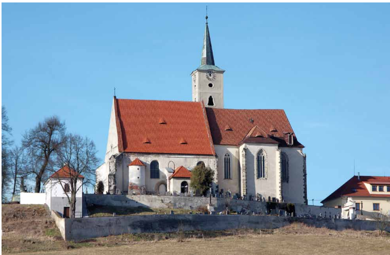
Obr. 1. Nezamyslice (okr. Klatovy), kostel Nanebevzetí Panny Marie. Pohled od jihozápadu.

a poměrně příkrém návrší, což nepochybně působilo potíže při jejím založení a dosud vyvolává statické problémy, zejména ve východní části kněžiště. 10