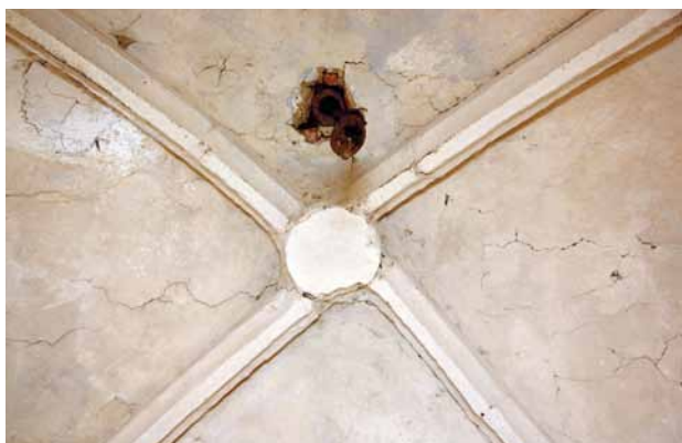
Obr. 7. Nezamyslice, kostel Nanebevzetí Panny Marie. Vrchol křížové klenby v přízemí věže.