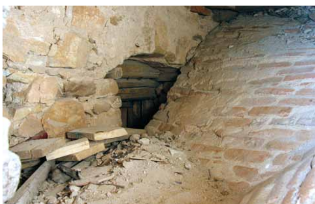
Obr. 9. Nezamyslice, kostel Nanebevzetí Panny Marie. Pohled v půdním prostoru nad kněžištěm na průchod umístěný v jižní zdi věže, jenž zanikl koncem 14. století.

pozdně románská z druhé, nejpozději třetí třetiny 13. století. 19 Okosená kamenná římsa soklu, jež plynule přechází ze severní stěny lodi na západní, severní a východní vnější stěnu zvonice, vypovídá, že věž byla postavena současně s plochostropou lodí a nižším klenutým, zřejmě polygonálně ukončeným kněžištěm. Přízemí věže je přístupné z presbytáře lomeným profilovaným portálem, jenž byl znovu odhalen při opravách stavby v první polovině šedesátých let 20. století. 20 Interiér je sklenut křížovou klenbou s klínovými, oboustranně vyžlabenými žebry o průřezu 20 × 14 cm, která vybíhají v koutech přímo ze stěny bez konzol, jsou složena z tvarovek o délce přibližně 50–60 cm a ve vrcholu se nepravidelně napojují na kruhový svorník (obr. 7). Tato žebra se neshodují co do rozměrů a profilu s pozůstatkem gotického klenebního žebra nad vstupem na kazatelnu; navíc vrchol klenby zasahuje do prostoru prvního patra věže tak, že jeho strop musel být odstraněn. Lze tedy předpokládat, že přízemí věže bylo zaklenuto s jistým časovým odstupem po dokončení stavby. S tím ostatně souvisela i změna úrovní jednotlivých podlaží ve věži. Pozůstatky dvou trámků a zazděné kapsy ve východní a západní stěně prvního patra ukazují polohu zaniklé podlahy, která odpovídá prahu zazděného vstupu v jižní obvodové zdi, jímž se vcházelo do prostoru nad klenbou kněžiště. K zaklenutí přízemí a úpravě vyšších podlaží na