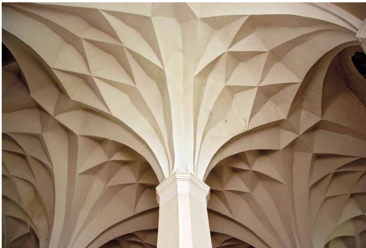
Obr. 17. Nezamyslice, kostel Nanebevzetí Panny Marie. Trojlodní síň. Sklípkové klenby v pohledu od jihozápadu.

Dendrochronologická analýza přinesla zásadní poznatky o stáří krovů a o stavebních úpravách kostela v první a druhé čtvrtině 16. století. Dnešní krov nad presbytářem provedli tesaři z jedlí skácených mezi lety 1512–1514, nejspíš jako náhradu za snad už staticky nevyhovující nebo poškozenou konstrukci krovu a střechy z konce 14. století. 52