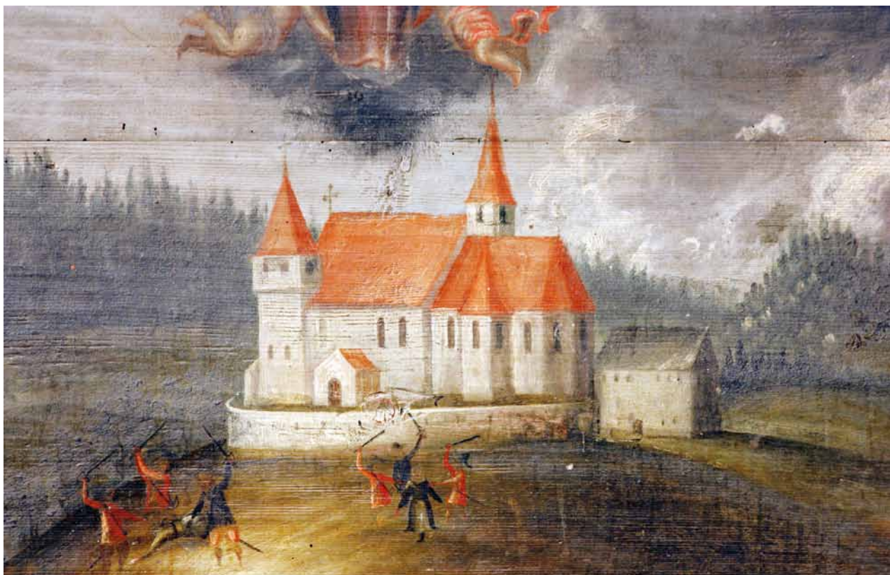
Obr. 11. Anonym: Nezamyslický zázrak. Olejomalba na dřevěné desce, 108 × 153 cm. Votivní obraz z roku 1626 nebo z doby o něco pozdější. Detail s vyobrazením kostela v Nezamyslicích. Muzeum Lamberská stezka Žihobce.

okny až v polovině osmdesátých let 15. století. 25 Zjištěné skutečnosti pak nebrání chápat tato zdánlivě románská sdružená okna s půlkruhovými záklenky jako projev historismu známého i z jiných staveb té doby, například věže nedalekých kostelů ve Zdouni a v Petrovicích. 26