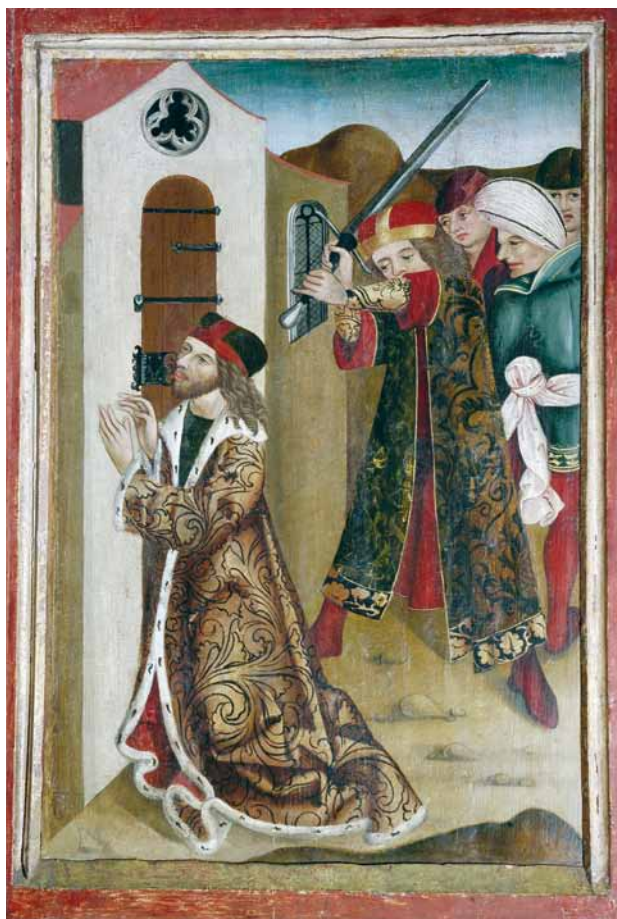
Obr. 8. Oltářní archa Panny Marie Ochránitelky v Kašperských Horách. Deska znázorňující vraždu sv. Václava.