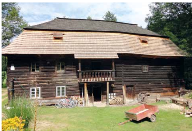
Obr. 5. Ostrovec (okr. Rokycany), budova čp. 12 – vodní mlýn. Pohled od jihozápadu. (Fotoarchiv Národního památkového ústavu, ú. o. p. v Plzni, foto S. Plešmíd, 2012)