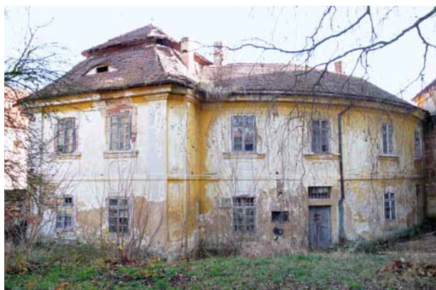
Obr. 2. Chotěšov, areál bývalého kláštera, zahradní pavilón. Pohled od západu na část zadní fasády.