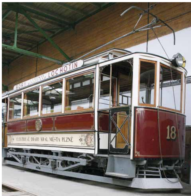
Obr. 9. Tramvajový vůz č. 18 „Brožík-Křížík“ elektrické dráhy v Plzni.