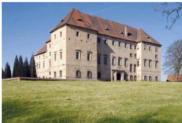
Obr. 3. Kaceřov (okr. Plzeň-sever), zámek. Pohled od jihovýchodu.