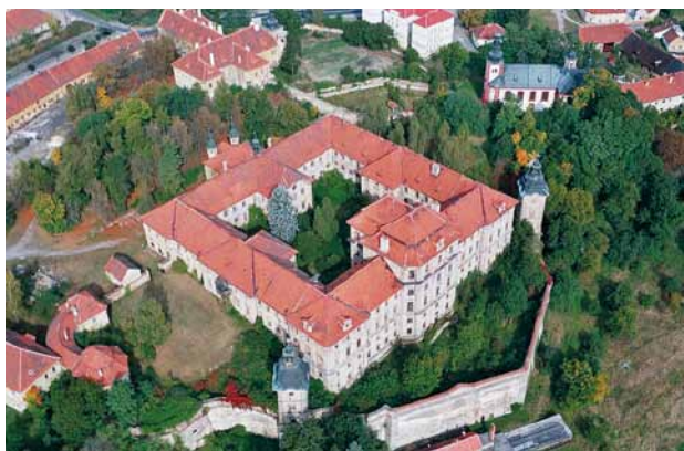
Obr. 1. Chotěšov (okr. Plzeň-jih), areál bývalého kláštera. Letecký pohled. Zahradní pavilón je na snímku vlevo dole.