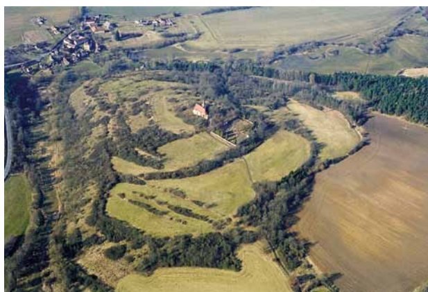
Obr. 1. Tasnovice (u Štítar, okr. Domažlice), ostrožna hradiště s kostelem sv. Vavřince. Letecký pohled od jihovýchodu. (Fotoarchiv Národního památkového ústavu, ú. o. p. v Plzni, foto P. Braun, 2002)