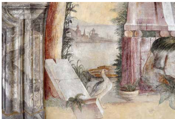
Obr. 4. Nebílovy, zámek, Taneční sál. Iluzivní nástěnná a nástropní výmalba – detail.

Obnovu Tanečního sálu v Nebílovech, jenž byl letos znovu zpřístupněn pro veřejnost, lze považovat za jeden