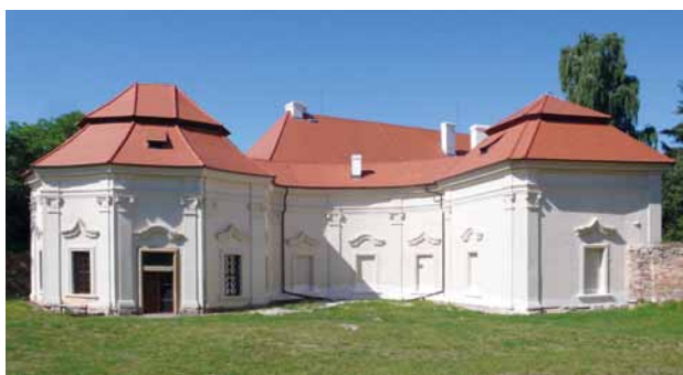
Obr. 3. Chotěšov, areál bývalého kláštera, zahradní pavilón. Pohled od severovýchodu. Stav před celkovým dokončením obnovy památky.

Od té doby až do roku 2010 už jen chátral. Zatékání do střechy a škodlivé biotické vlivy se negativně promítly do technického stavu památky.