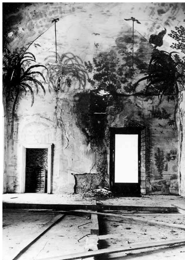
Obr. 1. Nebílovy (okr. Plzeň-jih), zámek, Taneční sál. (Foto b. a., asi 1943)

zájem. Byl pro ně příležitostí, jak se přímo seznámit s pracovními postupy restaurátora, jež jsou svým způsobem unikátní. Proto byly uspořádány v Nebílovech Národním památkovým ústavem, územním odborným pracovištěm v Plzni, hned dvě specializované exkurze. První z nich se konala 8. 10. 2012, při umístování transferů maleb zpět na strop Tanečního sálu. Druhá proběhla 16. 12. 2013, krátce po zdárném dokončení celého díla (obr. 2).