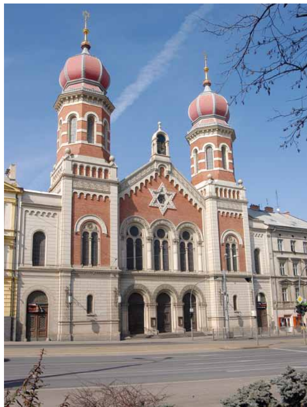
Obr. 7. Plzeň (Jižní Předměstí), Velká synagoga. Pohled od jihovýchodu.