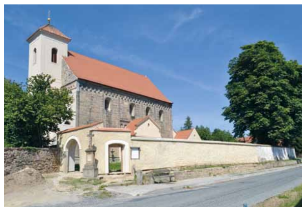
Obr. 2. Potvorov (okr. Plzeň-sever), kostel sv. Mikuláše a hřbitov. Pohled od jihozápadu.