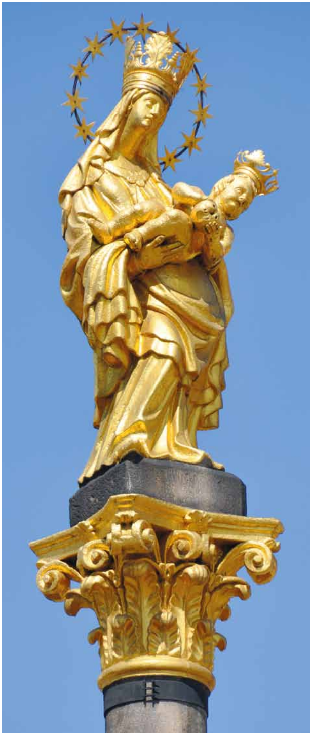
Obr. 2. Plzeň, náměstí Republiky, sloup se sochou Madony plzeňské. Mariánská socha při pohledu od jihovýchodu.

na vrchol sloupu byla objednavateli určena ze zbožných, ale současně jistě i patriotických důvodů socha Madony, replika takzvané Madony plzeňské, opukové skulptury pocházející od Mistra Krumlovské madony snad z roku 1384(?) a umístěné na hlavním oltáři v městském kostele (katedrále) sv. Bartoloměje. Tato milostná socha, jejíž kult se nově rozvinul na konci 17. a během 18. století, byla hojně ctěna, vyhledávána poutníky z blízkého i vzdálenějšího