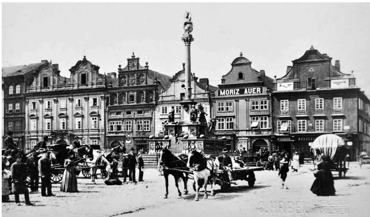
Obr. 5. Plzeň, náměstí Republiky, sloup se sochou Madony plzeňské. Pohled od severovýchodu. (po roce 1900)

práce. Tento zvýšený náklad (nad 20 000 Kč) na sebe vzítí nemohu.“