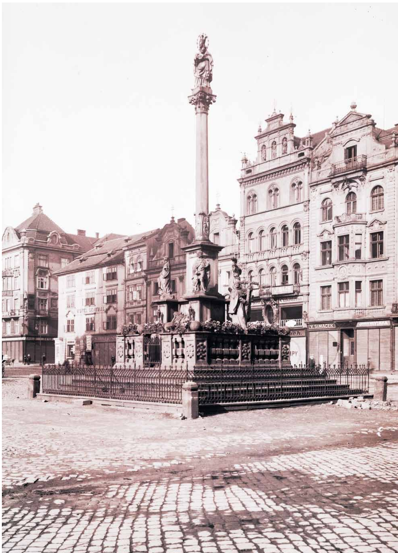
Obr. 7. Plzeň, náměstí Republiky, sloup se sochou Madony plzeňské. Pohled od severovýchodu, na kterém se uplatňuje soudobá květinová výzdoba památky. (Západočeské muzeum v Plzni, foto Balley, 1. třetina 20. století)