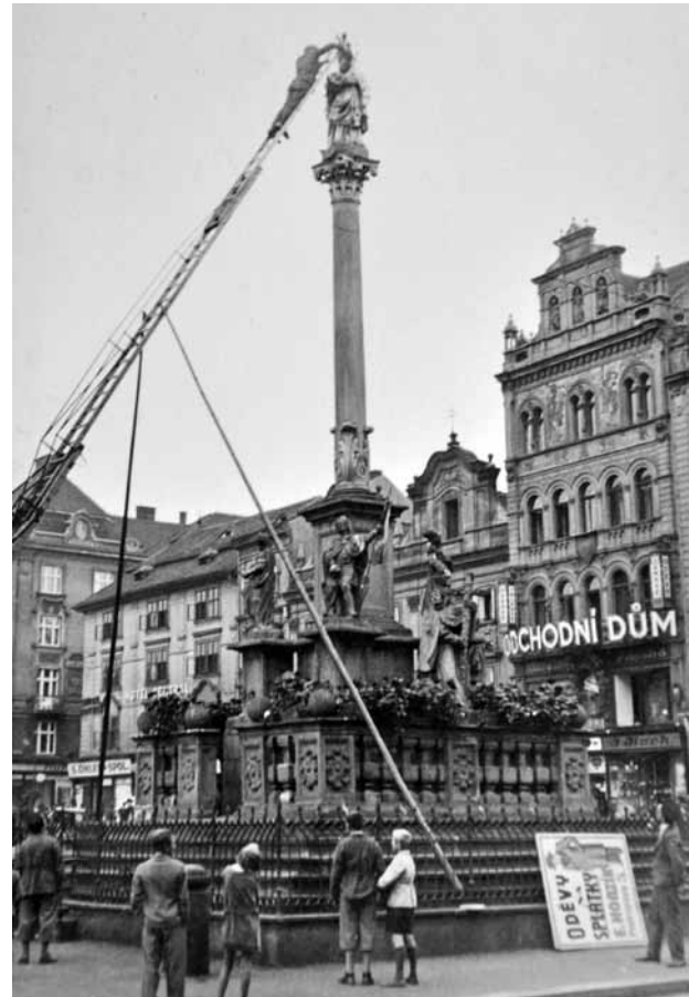
Obr. 9. Plzeň, náměstí Republiky, sloup se sochou Madony plzeňské. Pohled od severovýchodu. Dokončovací restaurátorské práce na kovových prvcích mariánské sochy v roce 1931(?).

Architektonické prvky byly očištěny a zbaveny přírodních nečistot, uvolněné vysprávky a zkorodovaný kámen byly odstraněny. Na místech, kde vznikla potřeba větších donášek, se v souladu s tehdejší restaurátorskou praxí použila měděná armatura kotvená olovem. Byly odstraněny zbytky železných konzol někdejších luceren, jejichž kotvení korodovalo a působilo praskliny na pilířcích pod sochami sv. Bartoloměje a sv. Václava (na výrobu a osazení nových luceren na sloup zpět už nedošlo). Všechny chybějící části architektury byly doplněny. Byly vytmeleny praskliny a spáry kvádrů v základně památky. Byla domodelována plastická část podstavce sochy sv. Rozálie, jakož i zdobné prvky na sloupcích balustrády. Devět nejvíce poškozených původních baluster bylo odstraněno a vyměněno za výdusky. Zbývající poškozené balustry byly dotmeleny. Část obvodového schodiště byla rozebrána a znovu uložena do betonu. Obvodová betonová zídka