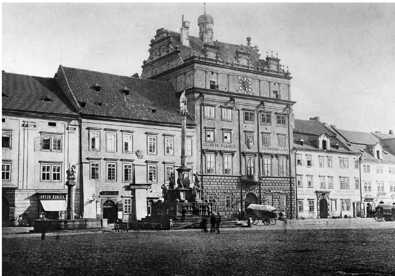
Obr. 4. Plzeň, náměstí Republiky, sloup se sochou Madony plzeňské. Pohled od jihozápadu. (Fotoarchiv Národního památkového ústavu, generální ředitelství, foto F. Fridrich, kolem roku 1865)