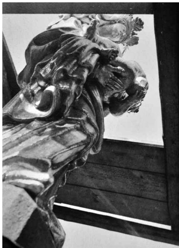
Obr. 8. Plzeň, náměstí Republiky, sloup se sochou Madony plzeňské. Průhled lešením vzhůru na nově pozlacenou mariánskou sochu při jejím restaurování v roce 1931(?). (asi 1931)

V roce 1986 se uskutečnila druhá etapa akce. Týkala se restaurování a nového osazení celé zbylé sochařské výzdoby. Sochy byly podle restaurátorské zprávy před zásahem ve velmi špatném stavu; pískovec podléhal lokálně silně