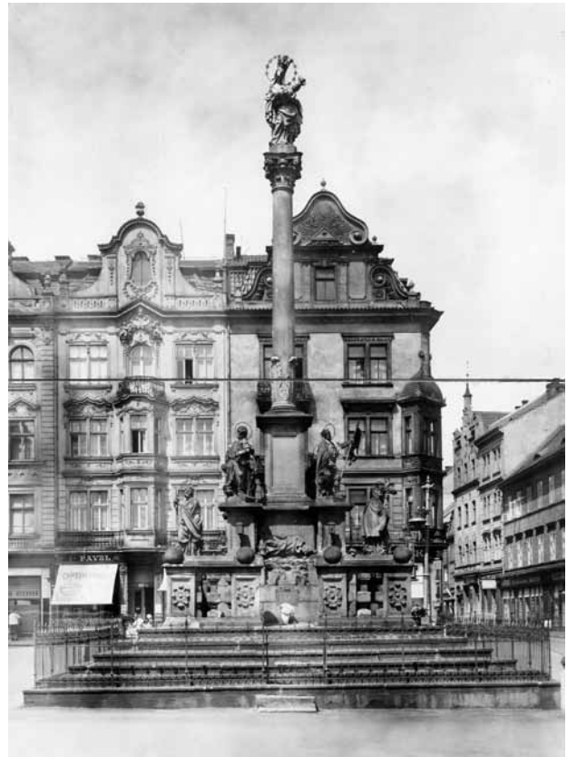
Obr. 10. Plzeň, náměstí Republiky, sloup se sochou Madony plzeňské. Čelní (východní) pohled.

Stav mariánského sloupu na náměstí Republiky v Plzni je dnes takový, že naléhavě vyžaduje odpovědný a kvalitní restaurátorský zásah, jenž by zabezpečil další trvání této jedné z nejvýznamnějších plzeňských sochařských památek na jejím místě. V památkové a restaurátorské praxi by měly být podle našeho názoru preferovány spíše