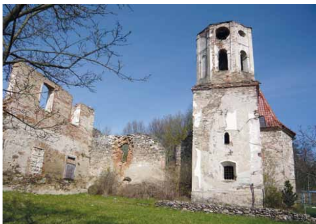
Obr. 3. Šitboř (okr. Domažlice), areál zříceniny kostela sv. Mikuláše. Pohled od jihu.

však převážnou většinou hlasů, se uplatnil názor, že lze zřídit nástup do věže v jejím přízemí – v klenuté sakristii s využitím vnějšího vstupu do sakristie na východní straně. V sakristii by vzniklo lehké točité, nebo spíš žebříkové schodiště, dřevěné nebo kovové, po němž by turisté stoupali novým otvorem (průrazem) v klenbě sakristie vzhůru do vyšších podlaží věže.