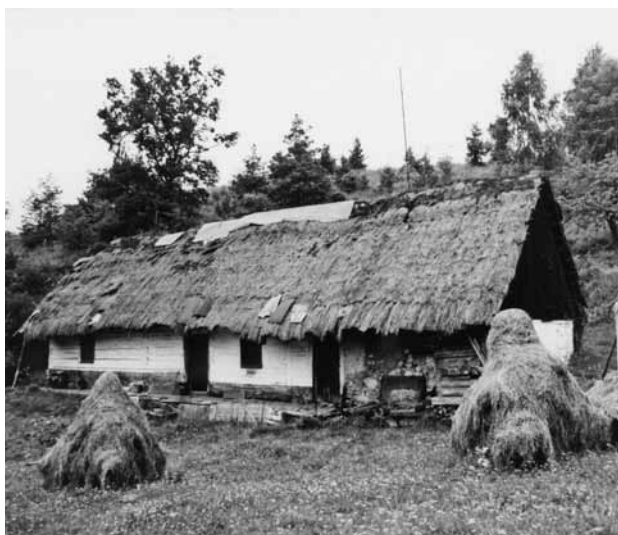
Obr. 9. Všehrdy (okr. Plzeň-sever), chalupa čp. 8. Roubená stavba s doškovou střechou, pocházející z 19. století, byla po předchozím zrušení památkové ochrany v roce 1981 odstraněna. (Foto J. Gryc, 1975)

chráněny památkovým zákonem. Kromě toho další tvoří součást památkových rezervací a zón. Ještě větší počet ale na svou ochranu teprve čeká. Masivní úbytek historické vesnické zástavby v posledních několika desetiletích potvrdil o to větší potřebu chránit a především co nejvíce poznat objekty, které zůstaly zachovány. Je smutnou skutečností, že ze souboru roubených stodol polygonálního půdorysu, kdysi relativně rozšířených jak na severním, tak i jižním Plzeňsku a na Klatovsku, dnes prokazatelně existuje jediný zástupce – stodola statku čp. 4 v Borku u Kozojed (okr. Plzeň-sever). Již jen na desítky se počítají staré roubené stodoly obdélného půdorysu. Zcela výjimečné jsou stavby s doškovou střechou.