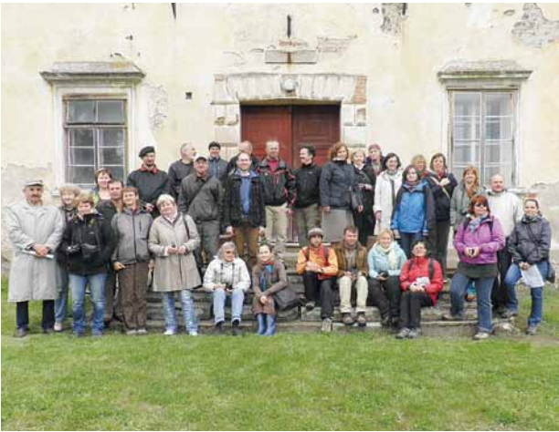
Účastníci 7. pracovního setkání s názvem Historické oranžerie a zahradní stavby určené pro pěstování rostlin, které se konalo v západních Čechách ve dnech 21.-23. 5. 2013, před budovou zámku v Červeném Poříčí.

v České republice věnované historickým stavbám, které v západních Čechách sloužily pro pěstování rostlin. Setkání bylo připraveno Národním památkovým ústavem – územními odbornými pracovišti v Brně a Plzni ve spolupráci se správami státních zámků Kozel, v Manětíně, Valči, Horšovském Týně a v Červeném Poříčí a se správou bývalého kláštera Kladruby u Stříbra.