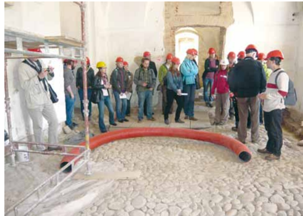
Teplá (okr. Karlovy Vary), klášter premonstrátů. Společná odborná exkurze zaměstnanců územních odborných pracovišť v Plzni a Lokti Národního památkového ústavu. Prohlídka jedné z místností v přízemí jižního křídla kvadratury barokního konventu s nálezem původní dlažby z kamených valounů.

První etapa stavební a restaurátorské obnovy kláštera v Teplé byla dokončena v roce 2009. Hned v následujícím roce začal projekt s názvem Vzorová obnova národní kulturní památky Klášter premonstrátů Teplá , jehož cílem je zachránit a obnovit do 30. 6. 2015 vybrané budovy a vytvořit při tom podmínky pro širší spektrum nekomerčních kulturních a vzdělávacích aktivit. 1 Obnova se týká především jižního a jihozápadního křídla prelatury,