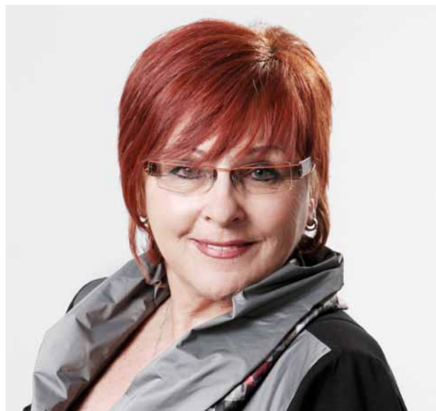
A. Svobodová. (Fotoarchiv redakce)