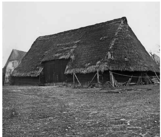
Obr. 6. Dolany (okr. Plzeň-sever), stodola při objektu čp. 1. Vznik polygonální roubené stavby s doškovou střechou byl datován hluboko do 18. století. V 80. letech 20. století byla stodola vytipována jako nejhodnotnější dochovaná stavba svého druhu na severním Plzeňsku a byl zvažován její transfer. Demolována krátce po zrušení památkové ochrany.