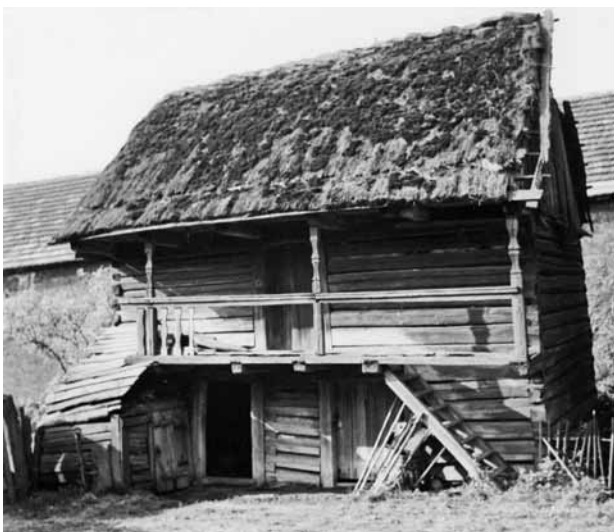
Obr. 7. Vejvanov (okr. Rokycany), zemědělská usedlost čp. 14, sroubek ve dvoře. Drobný roubený objekt značné památkové hodnoty byl přibližně v 80. letech 20. století nahrazen zděnou novostavbou. (Foto A. Jichová, 1969)