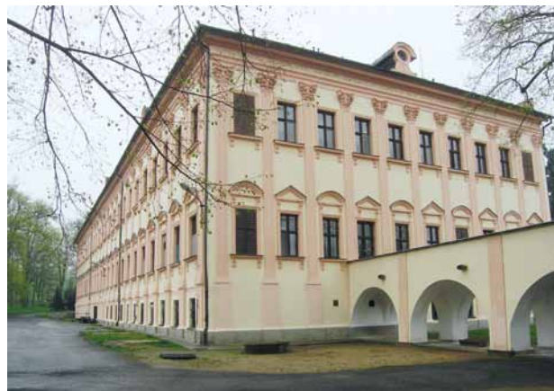
Obr. 2. Liblín, areál zámku. Hlavní zámecká budova. Pohled od severovýchodu. (Fotoarchiv Národního památkového ústavu, ú. o. p. v Plzni, foto M. Hradecká, 2006)

služeb. Záměr předpokládá, že pavilon vznikne jako třípodlažní samostatná stavba (suterén a dvě nadzemní podlaží) s plochou střechou v poloze naproti monumentálnímu východnímu průčelí hlavní zámecké budovy (obr. 2). Pavilon by působil velmi rušivě jak ve vztahu k zámku, tak i v zámeckém parku, z něhož se sice dochovalo pouze torzo, ale jenž je stejně jako zámek kulturní památkou a měl by být rehabilitován. Předmětem kritiky vznášené členy rady byla i nízká architektonická úroveň zamýšlené novostavby a rozsáhlé výkopové práce, související se záměrem propojit ji provozně s historickou budovou zámku pomocí podzemní chodby o značném průřezu, jako by tunelem. Památková rada doporučila, aby se pro nový pavilon hledalo pomocí ověřovací studie jiné umístění – například v prodloužení jižního zámeckého křídla, nebo při jižním okraji areálu, kde lze navázat, z urbanistického hlediska poměrně logicky, na obytnou zástavbu rodinnými domky, aniž by došlo k vážnějšímu poškození památkových hodnot. 3