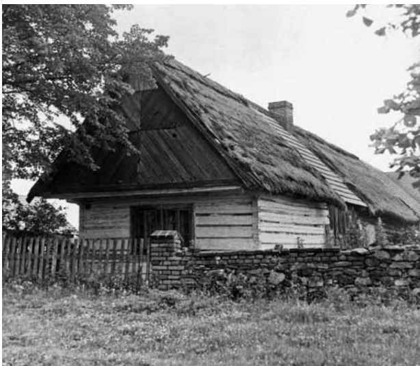
Obr. 5. Studená (okr. Plzeň-sever), chalupa čp. 29. Stavba s doškovou střechou, pocházející z 19. století, byla zbourána v roce 1974. Památková ochrana byla zrušena dodatečně o 2 roky později. (Foto K. Tůma, 1963)