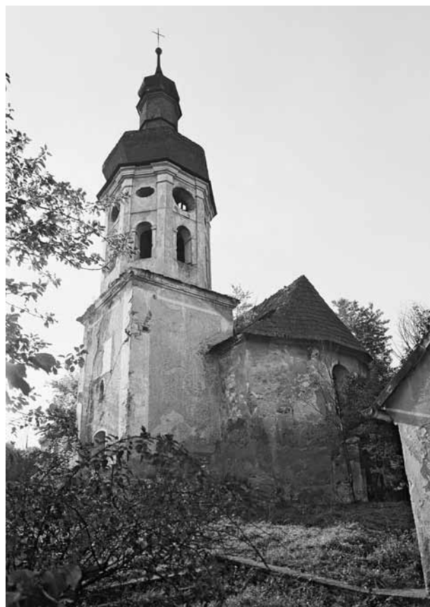
Obr. 4. Šitboř, kostel sv. Mikuláše. Pohled od jihovýchodu.

Krajský úřad Plzeňského kraje v rozhodnutí ze dne 1. 11. 2012, sp. zn. ZN/220/KPP/12, jímž zrušil pro nezákonnost závazné stanovisko Městského úřadu Rokycany vydané 26. 3. 2012 ve prospěch předchozí (neúplné) dokumentace pro územní rozhodnutí a v rozporu s písemným vyjádřením Národního památkového ústavu ze dne 28. 2. 2012, čj. NPÚ-341/12094/2012, poukázal na několik skutečností významných pro posouzení záměru. Kromě jiného upozornil, že