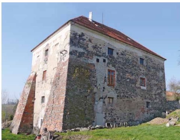
Obr. 11. Štěpánovice (okr. Klatovy), budova čp. 112 – bývalá středověká tvrz. Pohled od severovýchodu.