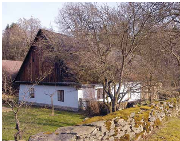
Obr. 12. Plánice (okr. Klatovy), část obce Vracov, mlýn č. ev. 1. Pohled od severozápadu na obytné stavení s mlýnicí.

Objekt středověké tvrze, barokně adaptovaný na panskou sýpku (obr. 11), stojí na západním okraji obce, v jejím nejvýše položeném místě, poblíž kostela sv. Michala.