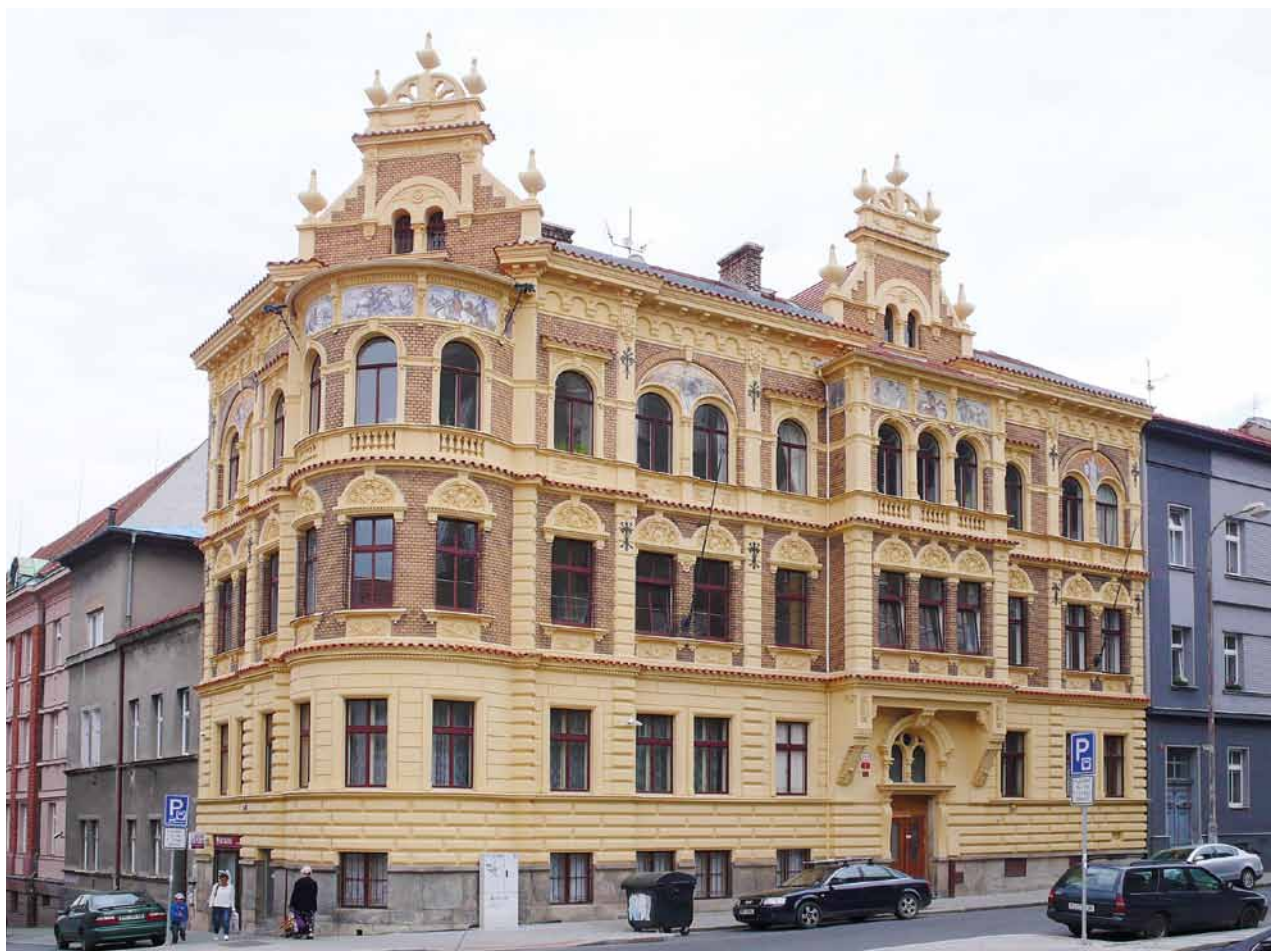
Obr. 6. Plzeň, činžovní dům čp. 948. Západní průčelí do Petákovy ulice. Fasády zdobeny sgrafity podle návrhu od M. Alše.

jsou členěny bosáží v přízemí a pilastrovým řádem. Volné plochy průčelí obou pater mají keramický obklad na způsob rezného cihelného zdiva. Nad okny 2. patra se nalézá sgrafitová výzdoba, jež připomíná osudy krále Ludvíka Jagellonského a vznikla podle předlohy od M. Alše. Budova je řešena jako trojtrakt se vstupním vestibulem a ústředním schodišťovým prostorem. Vestibul je bohatě vybaven štukovou výzdobou, na stropě je dekorativní výmalba. Prostor schodiště dále zdobí fládované obložky dveřních zárubní s vyřezávanými supraportami. Na úrovni takzvaného piana nobile se v nárožním rizalitu dochovala bohatá nástropní štukatura. V Plzni dům patří k významným stavbám z konce 19. století a obsahuje řadu hodnotných umělecko-řemeslných detailů. Prošel celkovou obnovou, při které byla restaurována výše zmíněná sgrafita.