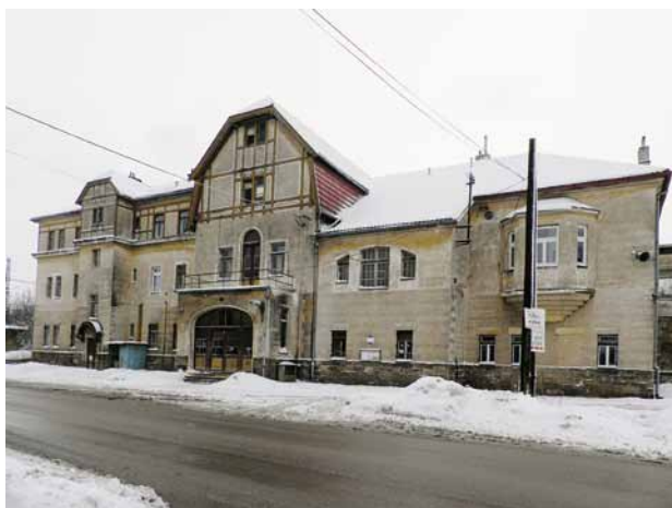
Obr. 4. Kařez (okr. Rokycany), výpravní a obytná budova železniční stanice Zbiroh čp. 71. Pohled v prostoru před nádražím od jihovýchodu.