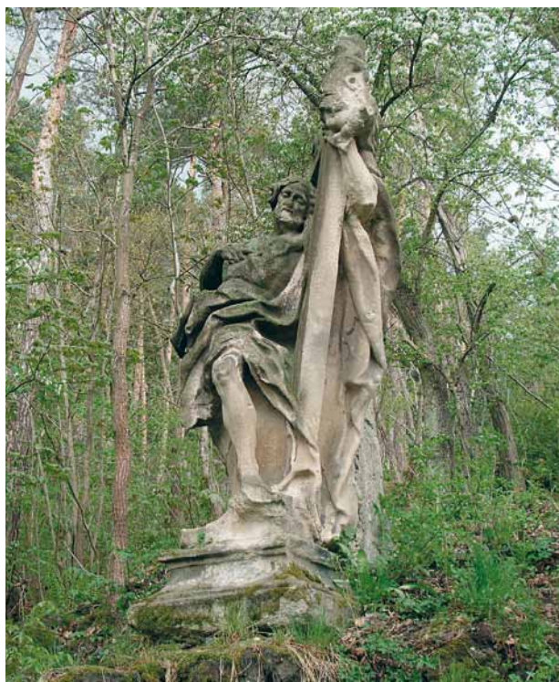
Obr. 8. Kladruby (okr. Tachov), část obce Pozorka, socha Vítězného Krista. Pohled od jihozápadu.

Socha stojí v zalesněném svahu východním směrem od bývalého benediktinského kláštera v Kladrubech (obr. 8). Barokní pískovcová plastika v nadživotní velikosti (výška přibližně 3 m). Socha s podstavcem je osazena přímo na skalnatý terén a ze zadní strany podepřena zděným válcovým pilířem. Postava Krista ve výrazném kontrastu s levou nohou nakročenou, horní část těla je v mírném záklonu. Pravá ruka se přimyká k tělu, dlaň spočívá na prsou a prst ukazuje k místu, kde je srdce. V levé ruce Kristus drží velký latinský kříž (jedno příčné břevno poškozeno – uraženo), za kterým vyhlíží okřídlená andělčí hlavička (rovněž poškozena). Hlava Krista je prostovlasá, sklání se a otáčí směrem k levému rameni. Obličej s plnovousem je jasně modelován, bez výraznějšího mimického akcentu, pohled směřuje ke kříži. Vrcholně barokní sochařská práce vysoké umělecké úrovně s poměrně vzácným způsobem ztvárnění Krista, kterou musel provést významný umělec. Hypoteticky lze soudit, že jím byl plzeňský sochař Lazar Widemann, jenž ve třicátých letech 18. století zřejmě působil ve službách kladrubských benediktinů. S jeho jménem je spojován vznik soch dvou atlantů na vstupním portálu východního křídla takzvaného Nového konventu kláštera v Kladrubech, které mají se sochou Vítězného