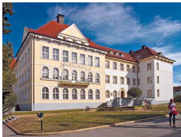
Obr. 5. Plzeň, budova čp. 1692, Benešova škola. Pohled na západní průčelí z Doudlevecké třídy.

Soubor školních budov na nároží Doudlevecké třídy a Helldovy ulice se skládá z budovy bývalé dívčí a chlapecké školy (čp. 1692), mateřské školy (čp. 1691), parkově upravené plochy při Doudlevecké třídě a někdejší školní zahrady (obr. 5). Vznikl podle jednotného architektonického návrhu