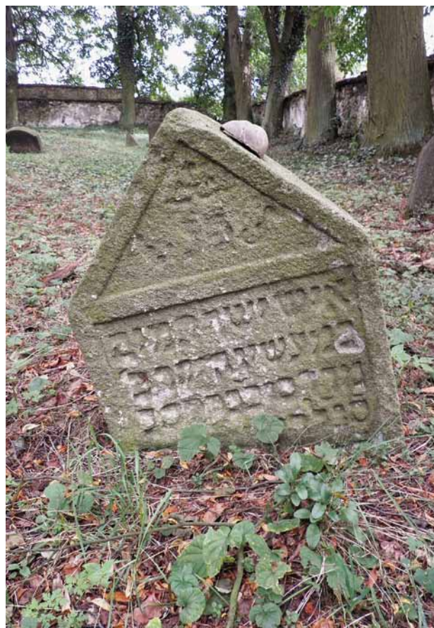
Obr. 9. Radnice (okr. Rokycany), židovský hřbitov. Jedna z dochovaných kamenných stél.

Torzo kruhové vápenné pece ve vzdálenosti asi 1,5 km východně od Javorné, při křižovatce cest u Střední Svinné. Pec měla oválný půdorys s hlavní osou ve směru severozápad-jihovýchod. Celkové rozměry 14, 2 × 38 m. Dnes jde z větší