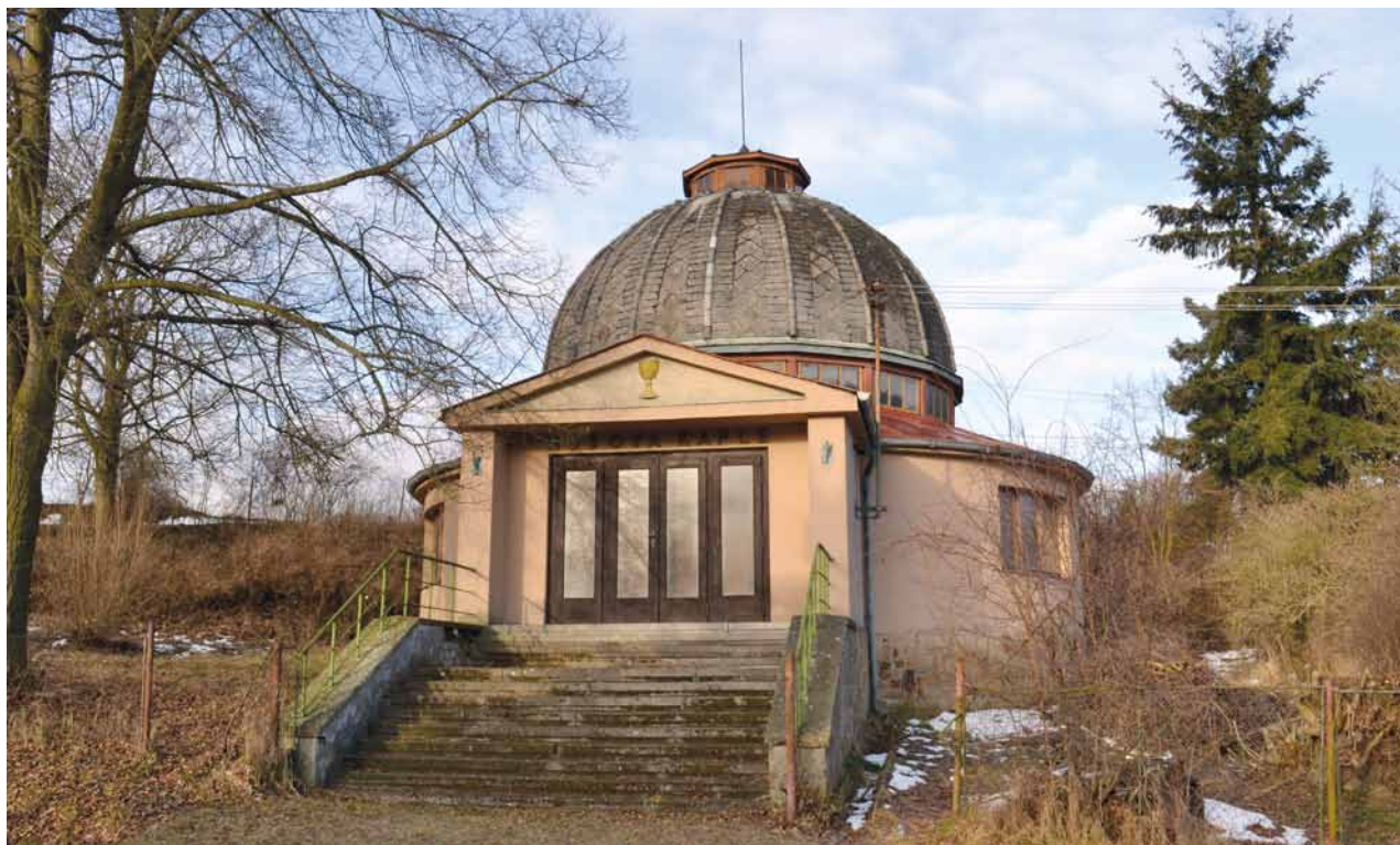
Obr. 1. Dolní Bělá (okr. Plzeň-sever), Husova kaple. Vstupní průčelí.