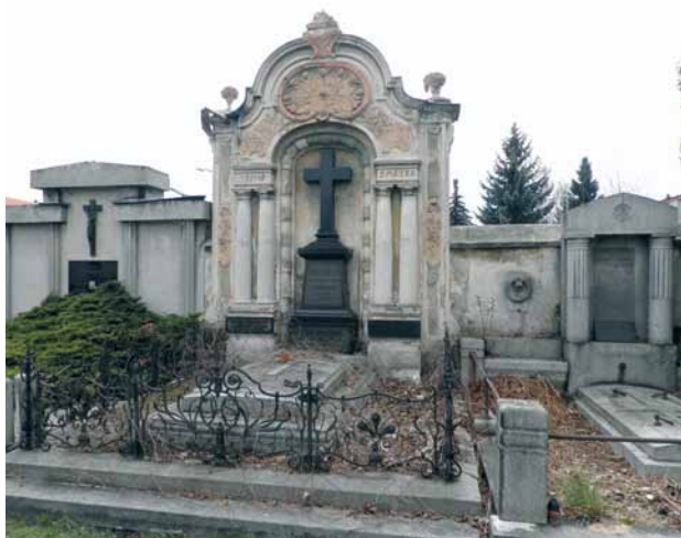
Obr. 2. Horažďovice (okr. Klatovy), hrobka rodiny Majerovy. Pohled od severu. (Foto D. Tuma, 2012)

stavbou sakrální části Korandova sboru v Plzni z období let 1935–1936, projektovanou rovněž J. Fišerem. Projekt Husovy kaple v Dolní Bělé představuje soudobý pokus o vytvoření specifického chrámového typu, účelného, esteticky kvalitního a zároveň levného. Kaple stojí ve svahu v jihozápadní části obce, při silnici na Horní Bělou, a vede k ní široké jednoramenné vnější schodiště. Má mírně předstupující vstupní předsíň s tympanonem. Vlastní liturgický prostor kruhového půdorysu o průměru přibližně 11 m se skládá z ochozu a střední části s kupolí o výšce zhruba 9 m, které jsou navzájem odděleny šesticí sloupů. Ochoz je osvětlen čtyřmi pravidelně rozmístěnými trojdílnými okny. Do střední části proudí světlo okny osazenými v řadě po obvodu tamburu pod kupolí. Interiér je velmi prostý. Podlahu tvoří keramická dlažba šedé a cihlově červené barvy ve skladbě nakoso do šachovnicového vzoru. V čele liturgického prostoru se nalézá dřevěná kazatelna. Kupole je sestavena z dřevěných segmentových vazníků. Lucerna, ve které je zavěšen zvon, má devítiboký tvar, rovněž dřevěnou konstrukci a řadu obdélníkových oken po svém obvodu.