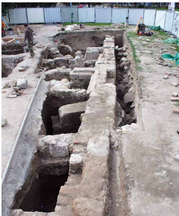
Obr. 7. Plzeň, archeologické pozůstatky špitálního kostela sv. Maří Magdalény. Pohled od jihovýchodu.

určený k zastavění, konkrétně novou budovou Západočeské galerie v Plzni; počítá se s tím, že pozůstatky špitálního kostela zůstanou jako kulturní památka zachovány.