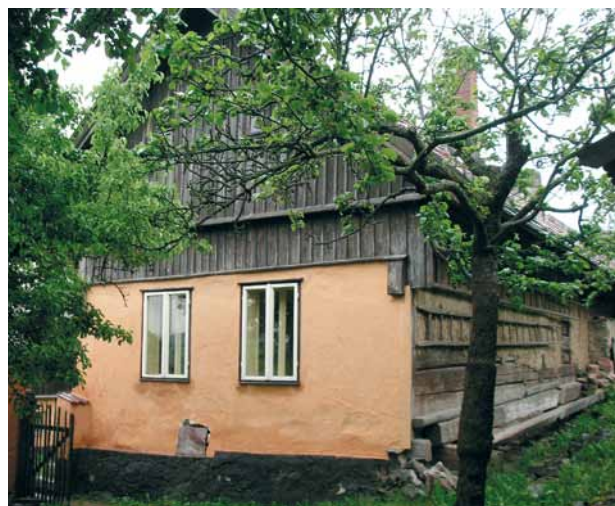
Obr. 3. Ježovy (okr. Klatovy), venkovská usedlost čp. 36. Obytné stavení. Pohled od jihozápadu.

Novobarokní hrobka, stojící při jižním úseku ohradní zdi hřbitova (obr. 2). Hrobové místo je zakryto souborem žulových desek, ohrazených původní nízkou železnou mříží. V čele hrobky se nalézá zděná stavba na způsob monumentální barokní výklenkové kaple s konvexkonkávním štítovým nástavcem. Výklenek je sklenut konchou, opatřen po stranách párem podvojných polosloupů a uprostřed něho se tyčí krucifix z černé leštěné žuly, osazený na vysokém podstavci. Úseky kladí nad sloupy nesou nápis RODINA D. MAJERA . Štítový nástavec je bohatě zdoben štukaturami. Některé zdobné články jsou z terakoty. Na fasádě včetně terakotových prvků se dochovaly zbytky