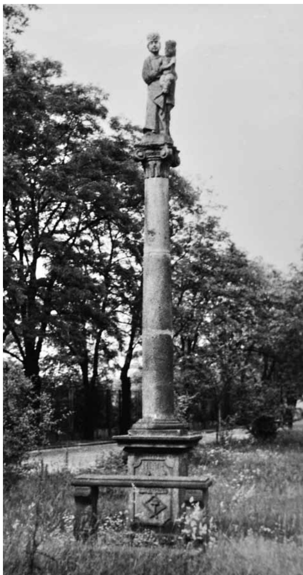
Obr. 13. Plzeň, sloup s Pannou Marií Svatohorskou. 1737. Stav po přesunu provedeném v roce 1934.

plzeňský sochař. Stalo se tak pravděpodobně z vlastního popudu a se zbožným úmyslem; klečící postava dárcova a jeho manželky tomu zřejmě nasvědčují. Ale sloup postaven zde také proto, že na tomto místě, těsně před branami Plzně, mívala procesí svá zastavení“. 27