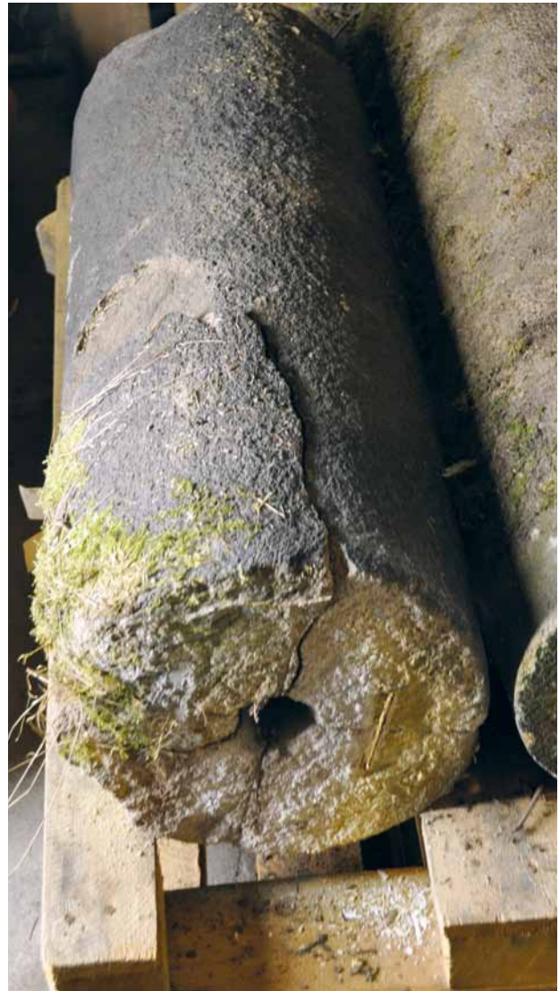
Obr. 18. Plzeň-Křimice, areál zámku, depozitář. Torzo sloupu s Pannou Marií Svatohorskou. 1737. Spodní část dřívku.

Osudy těchto fragmentů, lépe řečeno několika z nich, lze souhrnně vyjádřit takto: Jednotlivé části byly přesunuty do prostoru za presbytář bývalého františkánského kostela v Plzni stejně jako fragment sloupu s kaplicí a sochou Krista po bičování. Zatímco socha Madony včetně hlavičky sloupu a horní dvě třetiny jeho dřívku zmizely během následujících let neznámo kam, dochovala se (podobně jako podstavec sloupu s kaplicí a sochou Krista) patka podstavce, osazená dosud na provizorním kamenném základě na vlhkém a zanedbaném místě při stěně jednoho z opěráků presbytáře františkánského kostela v Plzni (obr. 15). Do terénu ponořená patka s nánosy špíny a bahna svým materiálem (středně- až hrubozrnný pískovec) i rozměrově přesně odpovídá střednímu dílu podstavce dochovaného pro změnu v Křimicích. Na povrchu patky jsou patrné zbytky barevných nátěrů, které jsou shodné s nátěry zbývajících kusů podstavce, takže o provenienci patky a její příslušnosti nemůže být pochyb. Střední díl podstavce sloupu spolu s římsou a patkou a spodní třetinou dřívku byl zřejmě počátkem devadesátých let 20. století převezen spolu s několika dalšími fragmenty, jak již bylo výše zmíněno, do areálu zámku v Plzni-Křimicích. Zde zbytky mariánského sloupu byly pohozeny volně v terénu a pozvolna zarůstaly vegetací (obr. 16). Teprve nedávno došlo k jejich lepšímu umístění: podstavec byl osazen