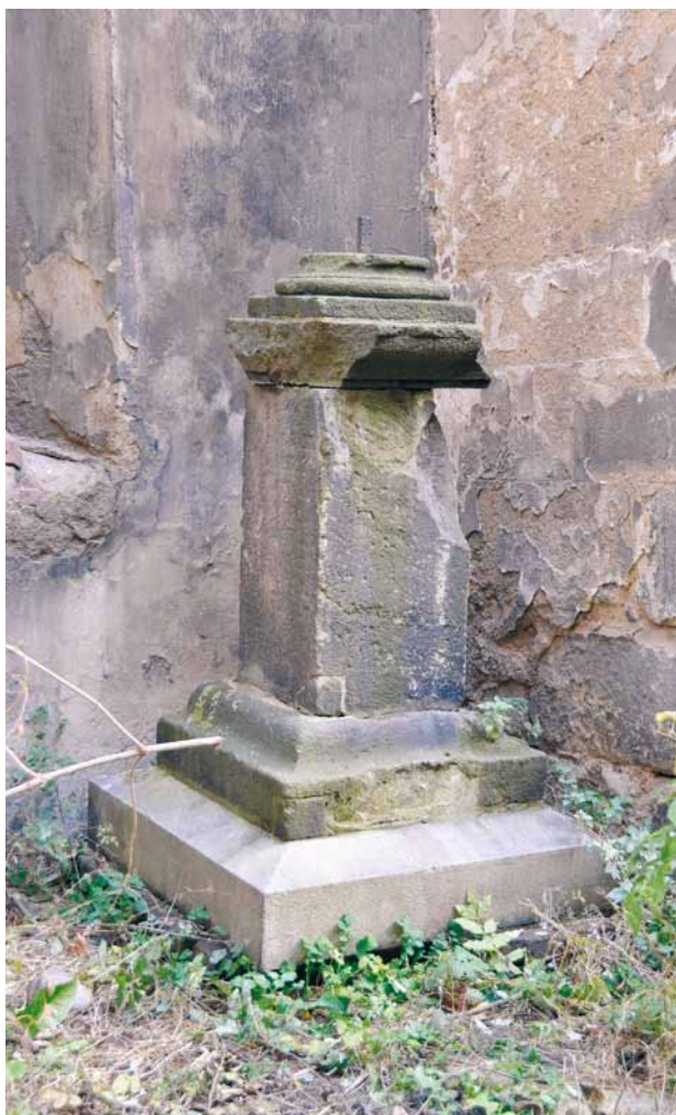
Obr. 7. Plzeň, torzo sloupu s kaplicí a sochou Krista po bičování. 1659. Podstavec umístěný u obvodového pláště presbytáře klášterního kostela františkánů.