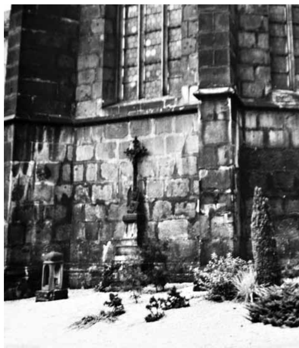
Obr. 6. Plzeň, vnější plášť presbytáře s opěráky bývalého klášterního kostela františkánů. Kaplice zhotovená v roce 1906 (na snímku je vlevo dole na zemi) pocházející z vrcholu sloupu s kaplicí a sochou Krista po bičování z roku 1659.

za městem, směrem k jihu, patřil plzeňské městské obci a byl nyní z druhé ruky prodán plzeňskému izraelitovi. Jak se proslýchá a v důsledku všech okolností je tento pozemek – stejně jako všechny ostatní přilehlé pozemky – určen k tomu, aby byl brzy rozparcelován na staveniště. Z příčin,