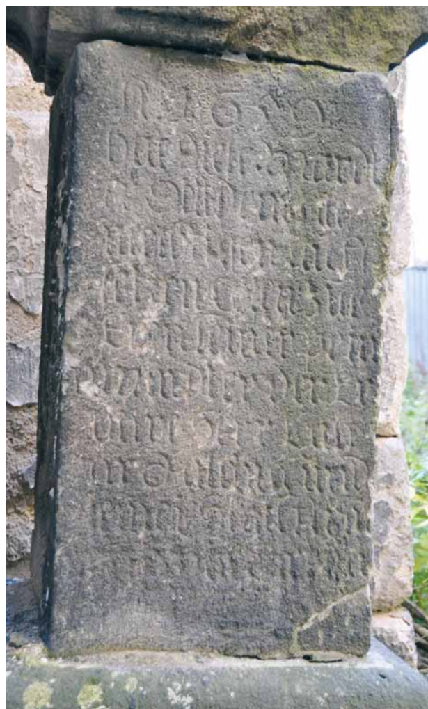
Obr. 8. Plzeň, torzo sloupu s kaplicí a sochou Krista po bičování. 1659. Pravá boční stěna podstavce s nápisem.

kteří mi jsou neznámy, se nový majitel ještě před převzetím tohoto pozemku rozhodl, že tato boží muka na jejich původním místě nestrpí a dá je bez dalších ohledů odstranit. Tato okolnost mě přiměla k tomu, abych bez meškání do této záležitosti vstoupil prostřednictvím zdejšího obecního úřadu, abych tak zabránil zničení těchto božích muk. To se stalo na začátku května tohoto roku, tedy více než měsíc předtím, než zpráva v »Pilsner Zeitung« dala panu konzervátoru E. Glocknerovi podnět k jeho zmíněnému zákroku u c. k. Centrální komise. Už v polovině května tohoto roku byla tato boží muka zaměstnanci našeho muzea na místě opatrně rozebrána a prozatím deponována v muzeu, dokud se nepodaří vyhledat vhodné místo v městském parku poblíž nové muzejní budovy. V samotné budově nebylo možno tuto památku postavit kvůli její výšce, která převyšuje výšku místností našeho ústavu, jež jsou k dispozici. Toto opatření jsem pokládal za naléhavé jednak proto, že nebylo možno pomýšlet na trvalé ponechání této památky na původním místě, jednak proto, že tato boží muka, sloužící jako nanejvýš nevhodný cíl pro dospělé i nedospělé uličníky, velice trpěla házením kamenů. To dosvědčují poškození, jako jsou uražení římsových profilů, okrajů akantových