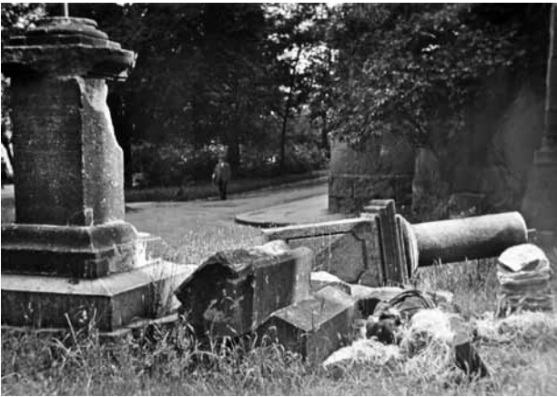
Obr. 14. Plzeň, torza sloupu s Pannou Marií Svatohorskou – podstavec, spodní část dřívku s patkou, socha Madony, hlavice s horní částí dřívku (na obrázku leží torza na zemi uprostřed a vpravo). 1737. Stav po živelném transferu v roce 1956. (Na obrázku stojí vlevo torzo sloupu s kaplicí a sochou Krista po bičování z roku 1659.)