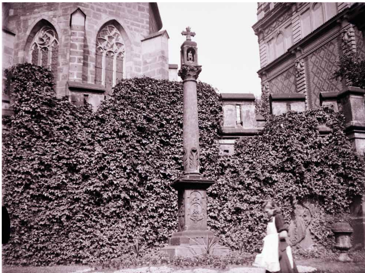
Obr. 3. Plzeň, sloup s kaplicí a sochou Krista po bičování. 1659. Nová poloha poblíž budovy plzeňského muzea. Celkový pohled. (Západočeské muzeum v Plzni, Národopisné muzeum Plzeňska, Kroužek přátel starožitností, inv. č. 11516, foto J. Karel, 1935)

uražen mu křížek s vrcholu. Nápis delší, německý, již zpo- la nečitelný“. 6