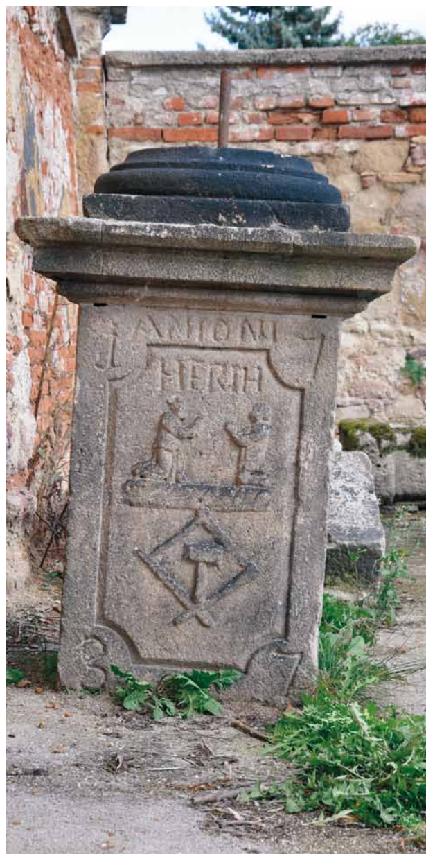
Obr. 17. Plzeň-Křimice, areál zámku, torzo sloupu s Pannou Marií Svatohorskou. 1737. Podstavec po přesunu na zpevněnou plochu. Pohled na čelní stěnu s reliéfní výzdobou a chronogramem. (Foto V. Kovařík, 2012)

Vzhled památky po jejím transferu dokládá několik fotografií z archivního fondu L. Lábka (jedna z nich viz obr. 13). 39 Je na nich vidět nově zhotovená hlava Panny