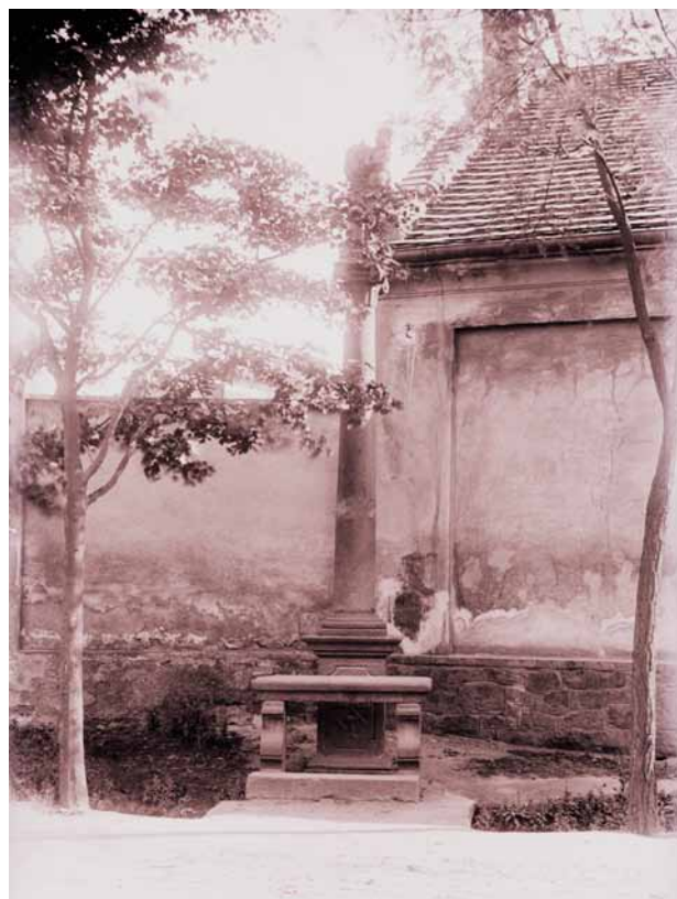
Obr. 12. Plzeň, sloup s Pannou Marií Svatohorskou. 1737. Původní poloha u městského pivovaru, u takzvané Doubravecké cesty. Celkový pohled. (Západočeské muzeum v Plzni, Národopisné muzeum Plzeňska, Kroužek přátel starožitností, inv. č. 104, b. a., 1911)