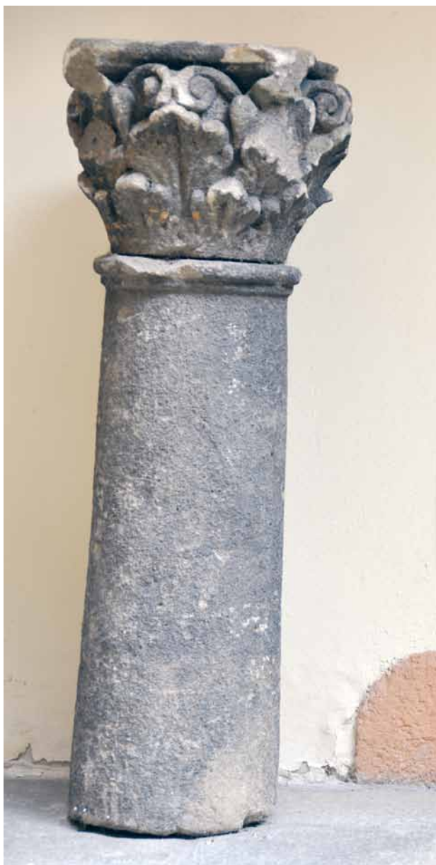
Obr. 11. Plzeň, Prešovská ul. 7, dům U Zlatého slunce, dvůr. Torzo dřívku sloupu neznámé provenience s korintskou hlavicí. 17. století (?).

přínejmenším do roku 1992, načež byl podstavec převezen nejprve na jakési neznámé místo, a poté byl uskladněn v depozitáři Technických služeb města Plzně. 20 Na několika snímcích ve fotoarchivu územního odborného pracoviště v Plzni Národního památkového ústavu pořízených v roce 1989 je však vidět, jak torzo sloupu (podstavec) stojí mezi opěráky u vnější stěny presbytáře bývalého františkánského klášterního kostela Nanebevzetí Panny Marie v Plzni; 21 památka musela tedy být na toto tmavé místo přenesena někdy v době před rokem 1989. Na jiném snímku, datovaném do roku 1975, leží na zemi v ploše před polygonálním závěrem presbytáře kostela kaplice (již bez sochy Krista; obr. 6), kterou lze s vysokou mírou pravděpodobnosti ztotožnit s kaplicí tvořící původně součást námi sledovaného barokního sloupu. 22 O dalším