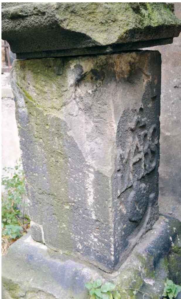
Obr. 9. Plzeň, torzo sloupu s kaplicí a sochou Krista po bičování. 1659. Zadní a levá boční stěna podstavce s monogramy.

Ještě v roce 1906 stál sloup na svém novém místě, u regotizované části městského opevnění poblíž nové muzejní budovy, jak se dovídáme ze záznamu od L. Lábka: „Dne 21. listopadu 1906 dostavena Boží muka u musea a zasažen nový kříž na jejich vrcholku z bílého pískovce“. 13 Při obnově památky roku 1906 bylo ovšem nutno některé její části zhotovit zcela nově, jak dokládá popis sloupu, pořizovaný Z. Wirthem pro zamýšlený soupis památek města Plzně (opis nápisu poté dne 12. 5. 1927 Z. Wirth poslal L. Lábkovi), jenž zní: „Před Umělprům. museem. Stávala při silnici Klatovská (Ferd.), sem přenesena 1906, přičemž dány nová deska, podstavec, nový kříž a soška Ecce homo. [...] Pískovec, vys. 4.45 m. Sokl profilován vlnovkou, hladký hranolový stylobat s převislou římsou, sloup korintský, dolní třetina obložena čtyřmi akanthy, na něm otevřená kaplice, na 3 strany segm. oblouky, římsa vypiatá a kříž; v kaplici soška Ecce homo. Na stylobatu v mělce prohloubených výplních: 1. monogram MARS pod titlou, dole srdce. 2. [Dvě slova nečitelná, poté monogram AM s trojitým křížem.] 3. A. 1659/hat diese Mardt= / er Gott dem All= / mechtigen aufs: / setzen Lasen zur/ Eren seiner Pein/ mardter der er/ bare Herr Las: / ar de Utern und/ seiner ... (dále řádek nečit.)“. 14