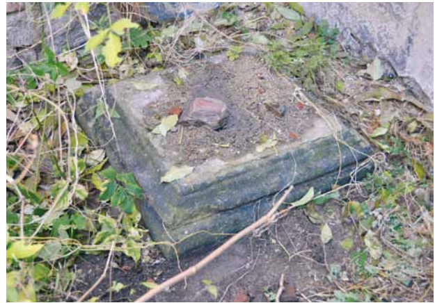
Obr. 15. Plzeň, torzo sloupu s Pannou Marií Svatohorskou. 1737. Patka podstavce nalézající se u obvodového pláště presbyteria klášterního kostela františkánů.

Původní umístění sloupu (pokud nepočítáme jeho polohu v době před rokem 1842) včetně klekátko nám dokládá fotografie z roku 1911, uložená ve sbírkách Národopisného muzea Plzeňska (obr. 12). 35 Je na ní mimo jiné patrná starší podoba překladové desky klekátko a při pohledu na vrcholové sousoší zjistíme, že chybí hlava Panny Marie, po které tehdy zbyl pouze železný čep. Když se v důsledku rozšíření areálu pivovaru památka ocitla v roce 1929 na jeho pozemku a v její těsné blízkosti došlo k rozsáhlé stavební činnosti (stavbě pivovarských sladoven), bylo rozhodnuto o transferu sloupu. Zpráva úřadu pro technické záležitosti města Plzně z 12. 5. 1930 k transferu uvádí: „Boží muka s Mariánskou sochou z r. 1737, ke které se pojí tradice popravy Jana Kozíny, stojící na pozemku č. kat. 2318/3 předaném do majetku pivovaru, budou Měšťanským pivovarem po dohodě s obcí přemístěna na vhodnější místo, veřejně přístupné.“ Město poté požádalo o posudek městského archiváře F. Macháčka, který dne