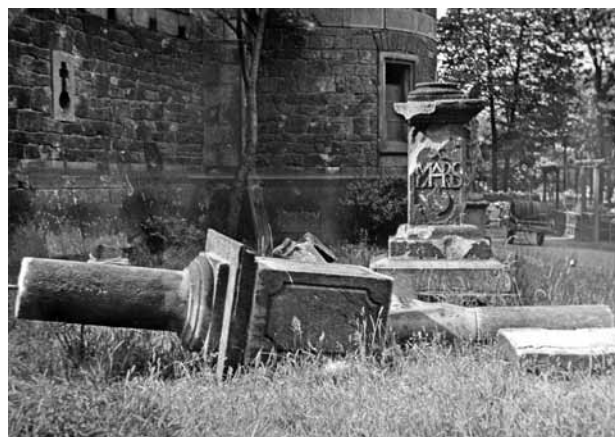
Obr. 5. Plzeň, torzo sloupu s kaplicí a sochou Krista po bičování (na obrázku stojí vpravo). 1659. Stav po živelném transferu v roce 1956. (Na obrázku vlevo leží na zemi torzo sloupu s Pannou Marií Svatohorskou z roku 1737.)