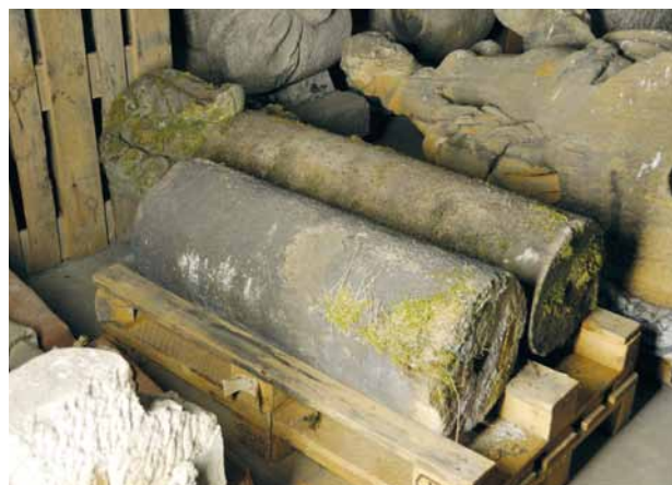
Obr. 10. Plzeň-Křimice, areál zámku, depozitář. Torzo dříku sloupu neznámé provenience se čtveřicí zdobných akantů (na obrázku uprostřed). 17. století (?).

Ještě v roce 1906 stál sloup na svém novém místě, u regotizované části městského opevnění poblíž nové muzejní budovy, jak se dovídáme ze záznamu od L. Lábka: „Dne 21. listopadu 1906 dostavena Boží muka u musea a zasažen nový kříž na jejich vrcholku z bílého pískovce“. 13 Při obnově památky roku 1906 bylo ovšem nutno některé její části zhotovit zcela nově, jak dokládá popis sloupu, pořizovaný Z. Wirthem pro zamýšlený soupis památek města Plzně (opis nápisu poté dne 12. 5. 1927 Z. Wirth poslal L. Lábkovi), jenž zní: „Před Umělprům. museem. Stávala při silnici Klatovská (Ferd.), sem přenesena 1906, přičemž dány nová deska, podstavec, nový kříž a soška Ecce homo. [...] Pískovec, vys. 4.45 m. Sokl profilován vlnovkou, hladký hranolový stylobat s převislou římsou, sloup korintský, dolní třetina obložena čtyřmi akanthy, na něm otevřená kaplice, na 3 strany segm. oblouky, římsa vypiatá a kříž; v kaplici soška Ecce homo. Na stylobatu v mělce prohloubených výplních: 1. monogram MARS pod titlou, dole srdce. 2. [Dvě slova nečitelná, poté monogram AM s trojitým křížem.] 3. A. 1659/hat diese Mardt= / er Gott dem All= / mechtigen aufs: / setzen Lasen zur/ Eren seiner Pein/ mardter der er/ bare Herr Las: / ar de Utern und/ seiner ... (dále řádek nečit.)“. 14