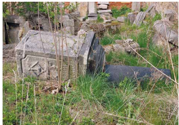
Obr. 16. Plzeň-Křimice, areál zámku, torzo sloupu s Pannou Marií Svatohorskou. 1737. Podstavec s římsou, plintem, patkou a oddělenou spodní částí dřívku, ležící na zemi.