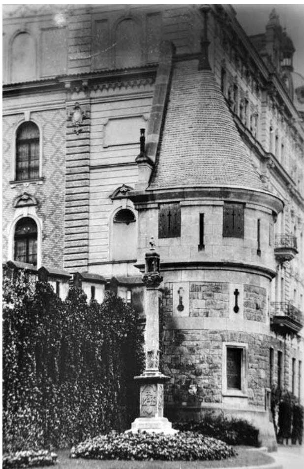
Obr. 4. Plzeň, sloup s kaplicí a sochou Krista po bičování. 1659. Nová poloha u budovy plzeňského muzea, celkový pohled (půlválcová bašta ani hradba s cimbuřím dnes již neexistují, vysoká budova v pozadí je hotel Continental).

odtamtud zmizel, se nachází, jak se nám sděluje, v městském muzeu. Ředitelství ho zamýšlí, nebude-li obecní zastupitelstvo mít proti tomu námitky, postavit v prostoru mezi kostelem a muzejní budovou.“ Výstřižky z obou čísel Pilsner Tagblattu spolu s fotografií sloupu poté zaslal konzervátor památkové péče Emil Glocker dne 30. 6. 1906 vídeňské Centrální komisi pro péči o památky, která se díky tomu o zamýšleném transferu dozvěděla. 9 Centrální komise se hned 19. 7. obrátila s žádostí o bližší informace na J. Škorpila, jenž jí odepsal obšírným přípisem z 24. 7. 1906. V něm se pokusil mimo jiné i přepsat nápis na sloupu a zevrubně vysvětlil okolnosti, jež vedly k transferu památky. V tomto přípisu čteme: „Tato památka pochází z roku 1659. Německý nápis, pokud ho lze přečíst: »A 1659/ hat dieses Martd/ --- Gott dem all/mechtigen auff/setzen lasen zur/ Eren seiner Pein/ ---- der er/ bare Herr Kasp/ar ---- und/ seine ----«, dokazuje, že památka nemá vůbec nic společného s hranicí údajného Valdštejnova tábora. Od bližšího popisu upouštím. Fotografie, kterou c. k. Centrální komisi poslal profesor E. Glocker [správně: Glocker], je zajisté dost jasná, aby bylo možno z tohoto hlediska vydat správný posudek. Pozemek poblíž borské trestnice, vzdálený ½ hodiny