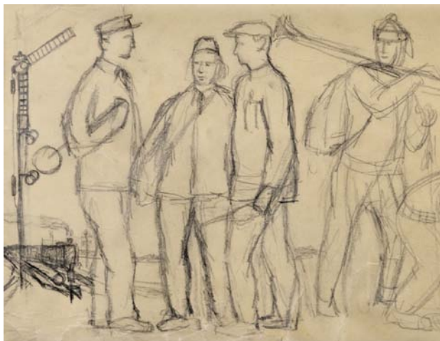
Obr. 2. Václav Matas: Skupina železničářů. Skica zpřesňující předchozí návrh. Uhel, pauzovací papír, 24,3 × 203 cm, 1959 (?). Soukromý archiv.