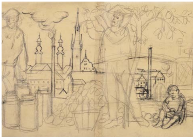
Obr. 10. Václav Matas: Sadař. Hrubá skica. Uhel, karton, 24,5 × 200 cm, 1959 (?). Soukromý archiv.

Sgrafitový pás v Klatovech je z hlediska stylu mnohem čistší než například výše zmíněné sgrafito v Olomouci. Stylově má k němu asi nejbližší sgrafitová výzdoba haly smíchovského nádraží v Praze. Autor klatovského díla tím, že použil poněkud zkratkovitější a lineárnější, až typizované vyjádření figur, jejich výrazů a drapérií,