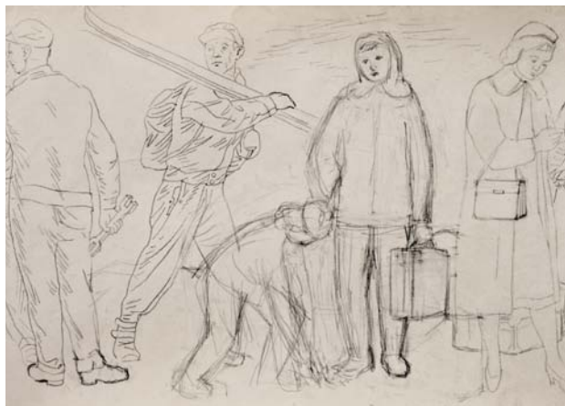
Obr. 6. Václav Matas: Skupina lyžařů. Skica zpřesňující hrubý návrh. Tužka, karton, 23,7 × 189 cm, 1959 (?). Soukromý archiv.

Sgrafitový pás s názvem Československý lid, v životě, práci a výstavbě socialismu v hale nádraží Praha-Smíchov vznikl v letech 1952–1953 podle návrhu Richarda Wiesnera. 6 Reprezentuje velmi dobře dobu a výtvarná schémata vrcholného socialistického realismu v Československu. Je také v odborné literatuře zatím nejčastěji