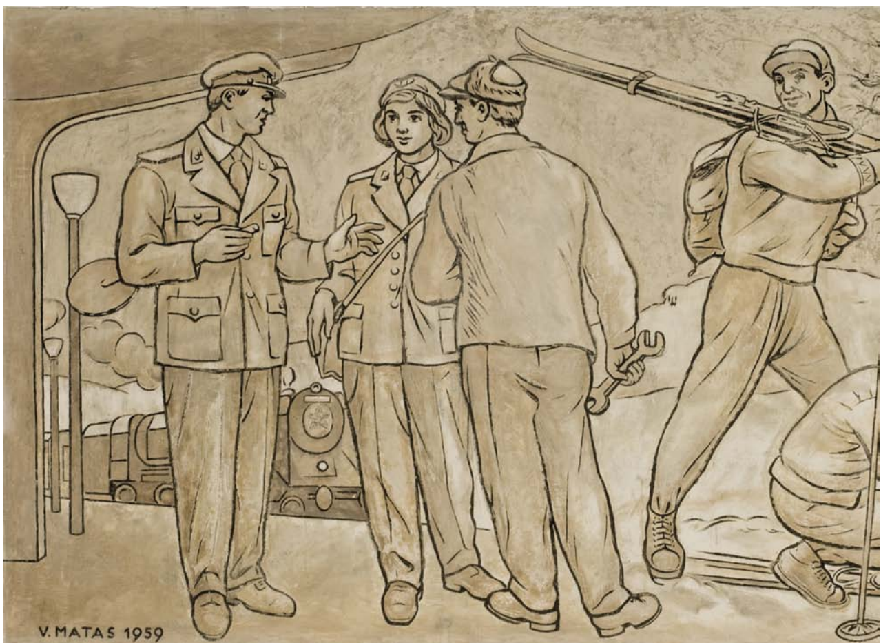
Obr. 5. Klatovy, vlakové nádraží, vestibul výpravní budovy. Výřez ze sgrafitového pásu podle návrhu od V. Matase zobrazující skupinu železničářů.