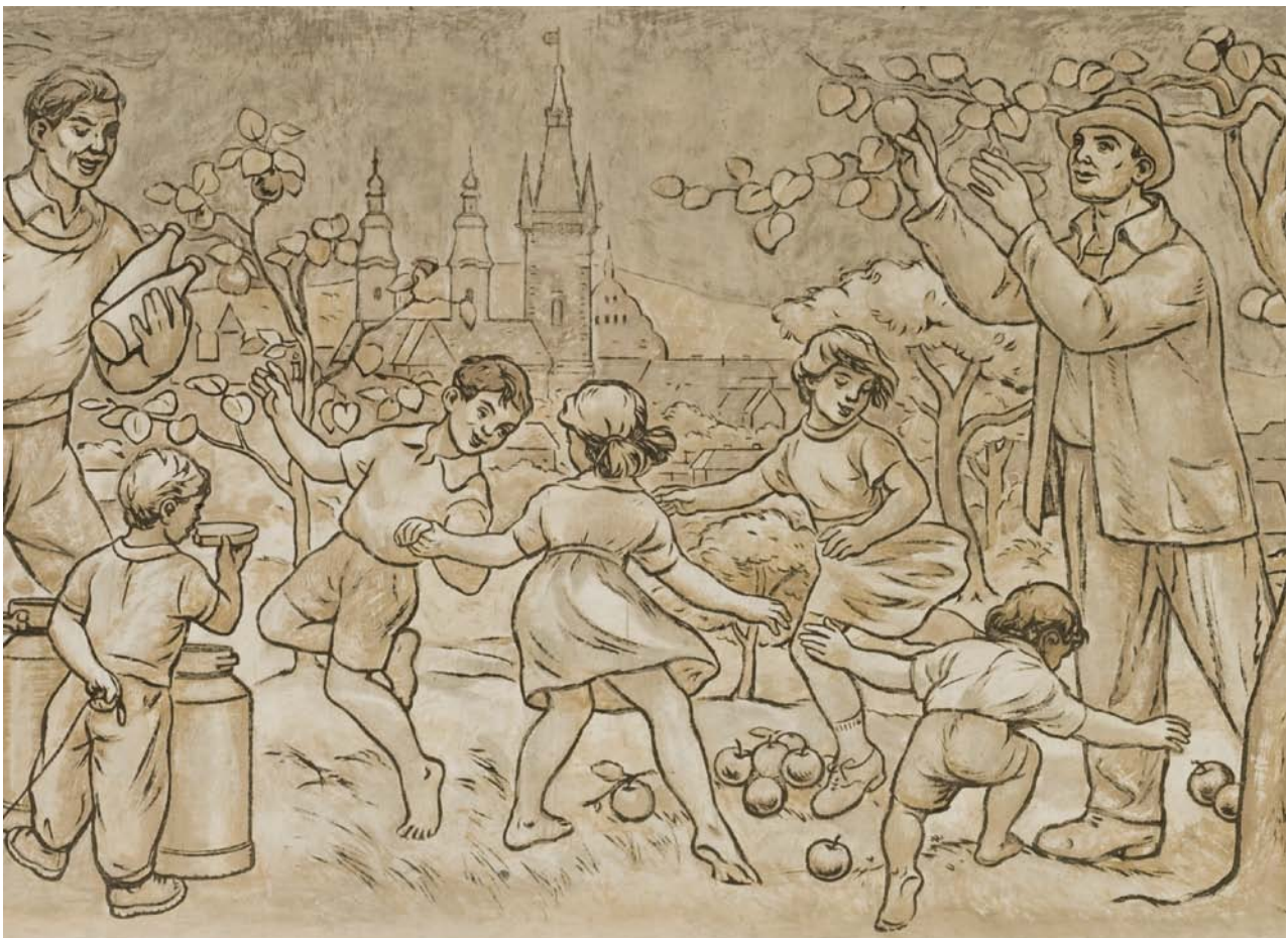
Obr. 13. Klatovy, vlakové nádraží, vestibul výpravní budovy. Výřez ze sgrafitového pásu podle návrhu od V. Matase zobrazující skupinu tančících dětí a sadařem.