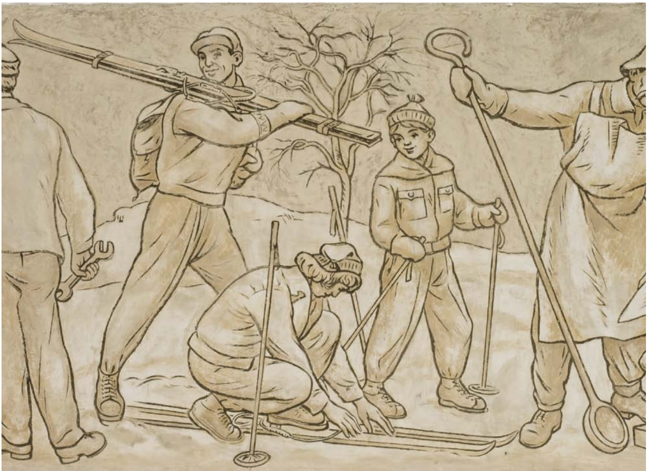
Obr. 9. Klatovy, vlakové nádraží, vestibul výpravní budovy. Výřez ze sgrafitového pásu podle návrhu od V. Matase zobrazující skupinu lyžařů.