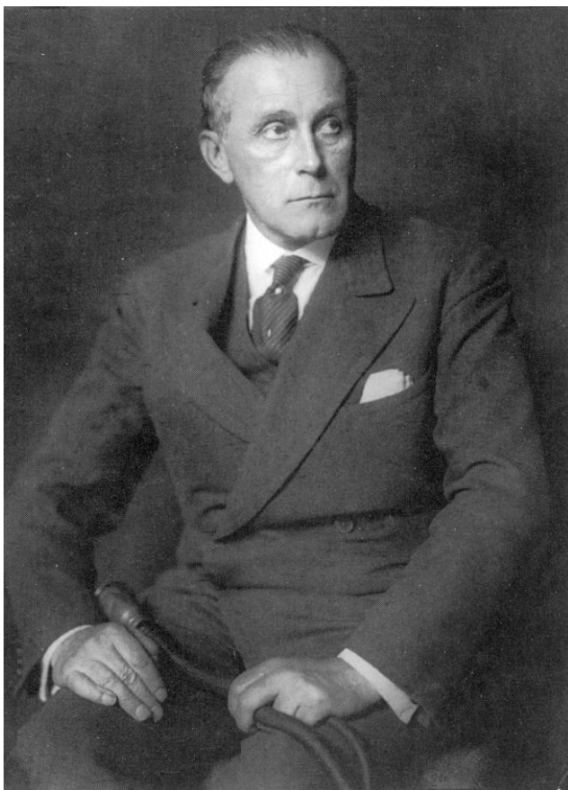
Portrét Adolfa Loose z roku 1930

Koncem letošního roku uplyne 150 let od narození jedné z nejznámějších osobností architektury počátku 20. století, Adolfa Loose. Tento světový architekt a kritik je známý především jako tvůrce prostorového uspořádání interiérů, tzv. Raumplanu, a představitel purismu. V Plzni realizoval více než desítku svých návrhů bytových interiérů. Na této výstavě můžete vidět dílo Adolfa Loose tak, jak se je podařilo v průběhu času zachytit objektivami fotoaparátů pracovníkům územního odborného pracoviště v Plzni. Fotodokumentace z konce šedesátých let 20. století tvoří unikátní sbírku, neboť je z té doby jediným a prvním obrazovým dokladem podoby interiérů pořízeným od jejich vzniku.