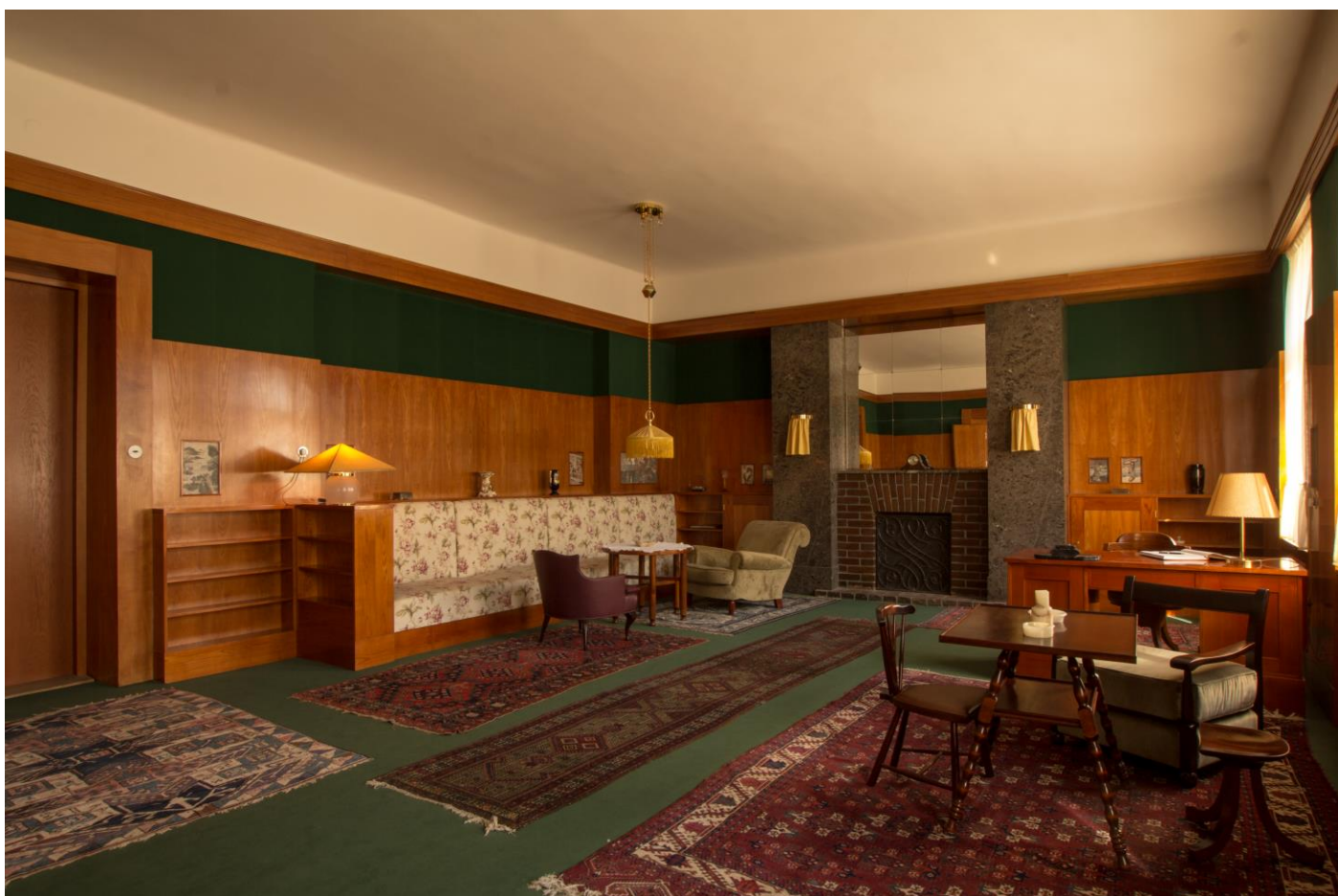
Interiér bytu Voglových procházel od roku 2004 postupnou kompletní obnovou včetně zhotovení replik volně stojícího nábytku. Pohled do severní části obývacího pokoje.