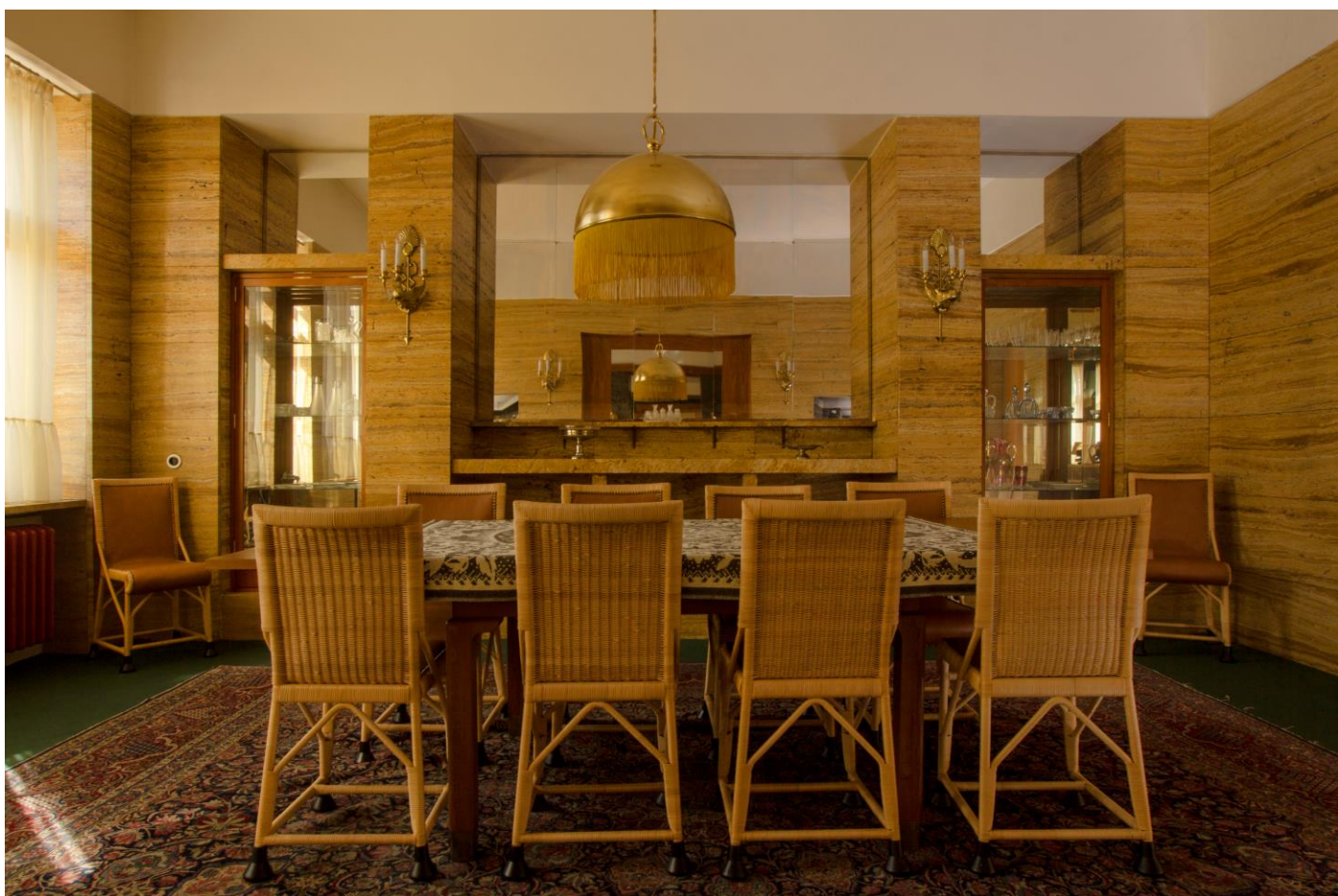
Obnovenému interiéru jídelny dominuje přírodní struktura žlutého travertinu, zrcadlové plochy a replikovaný lehký pletený nábytek (foto R. Kodera, 2016)