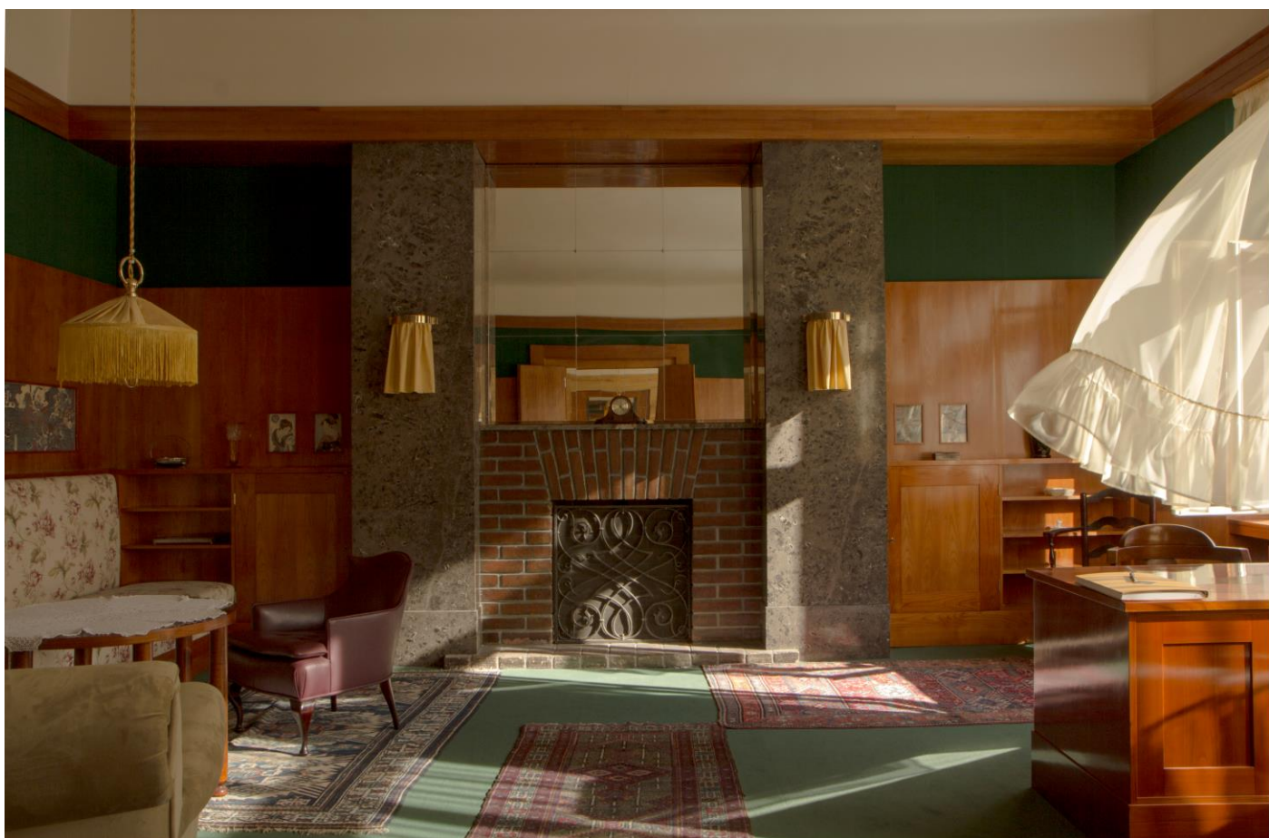
Čelní stěna obnoveného obývacího pokoje