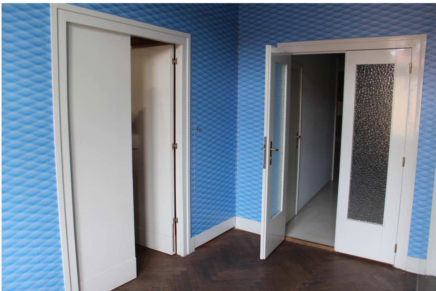
Barevné řešení vstupní chodby. Vstup vpravo ústí do obývacího pokoje, dveře rovně do chodby vedoucí k ložnici a koupelně. (foto K. Foud, 2020)