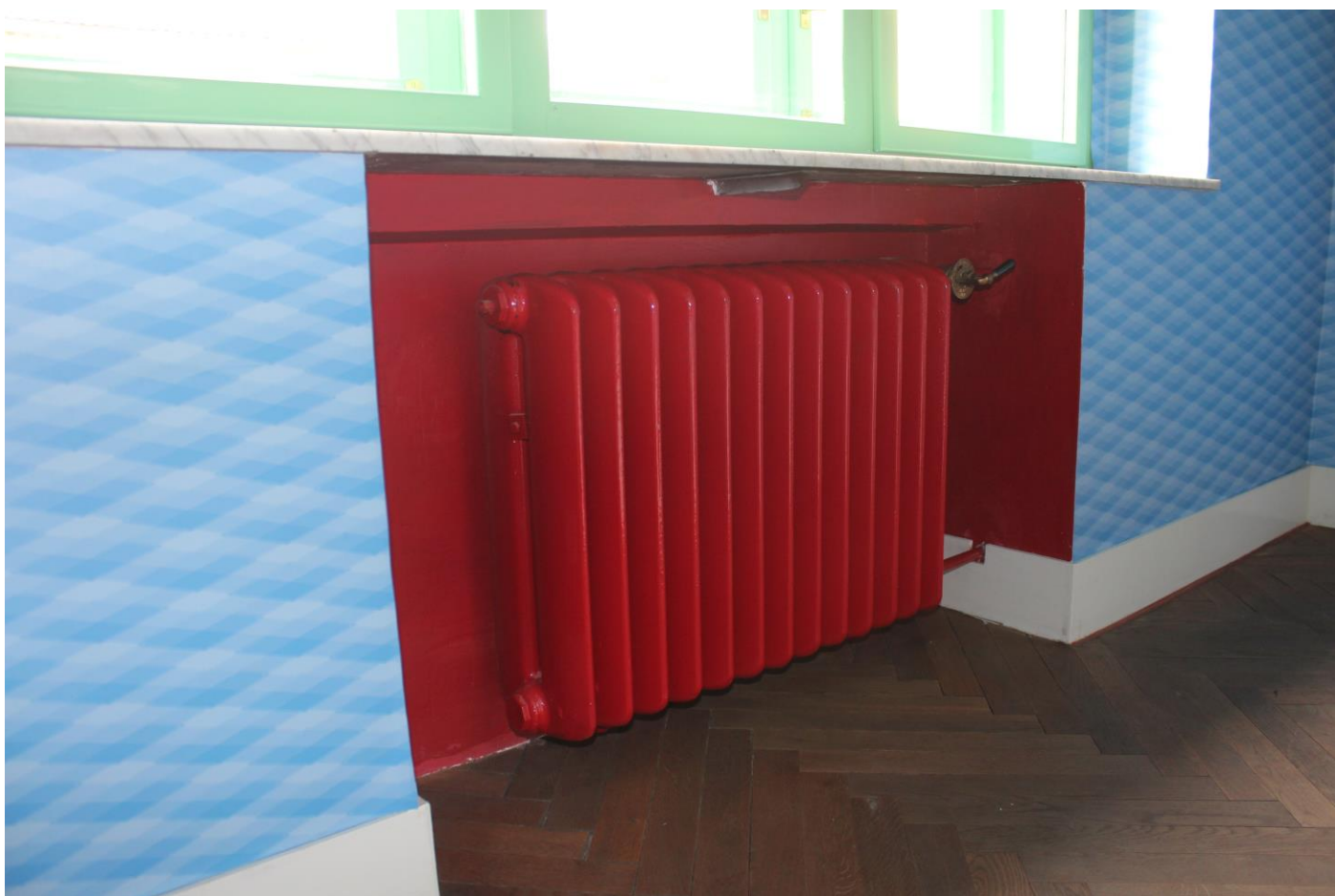
Detail barevného řešení chodby