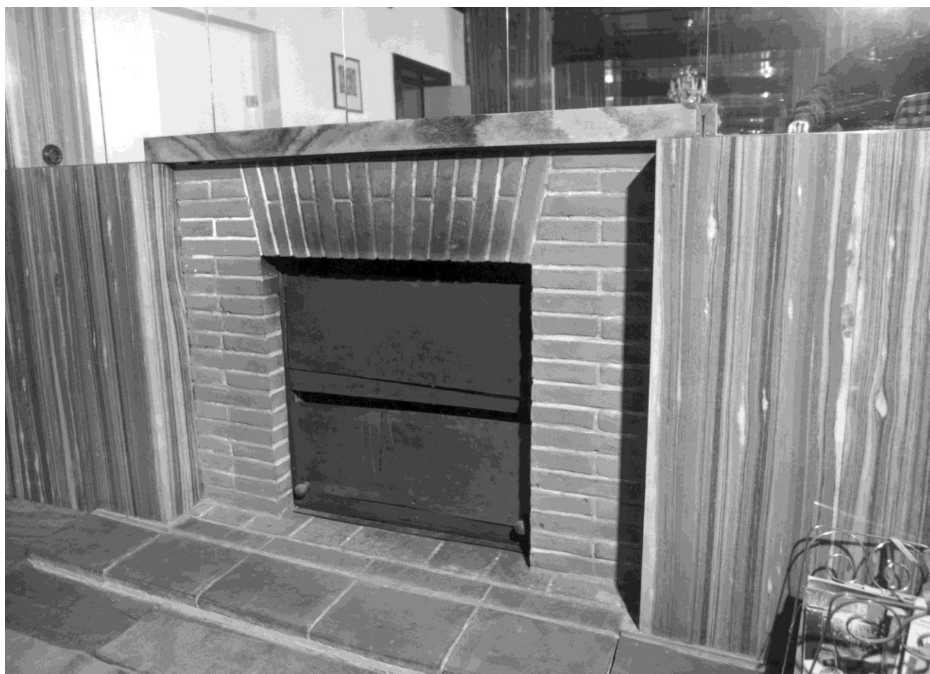
Detail krbu v čelní stěně obývacího prostoru. Krb je provedený z režného cihlového zdiva a obložen mramorovými deskami.