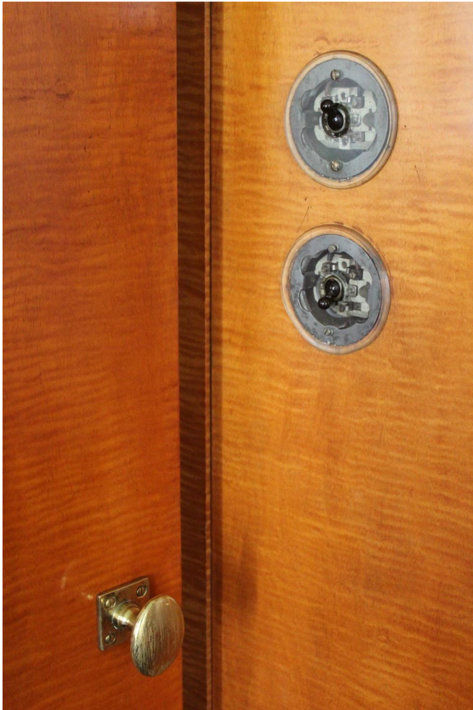
Detail skleněných vypínačů na javorovém obkladu stěn.