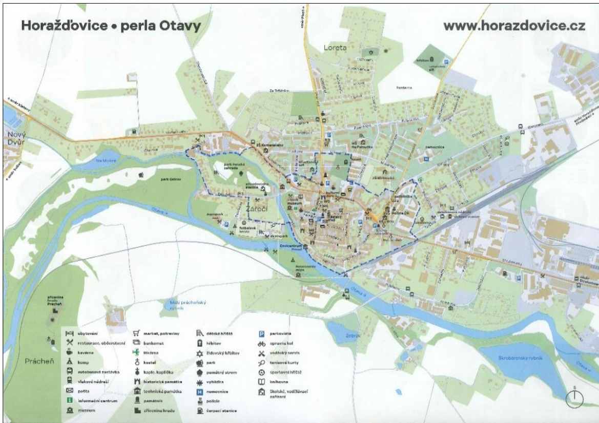
Vyznačení MPZ Horažďovice