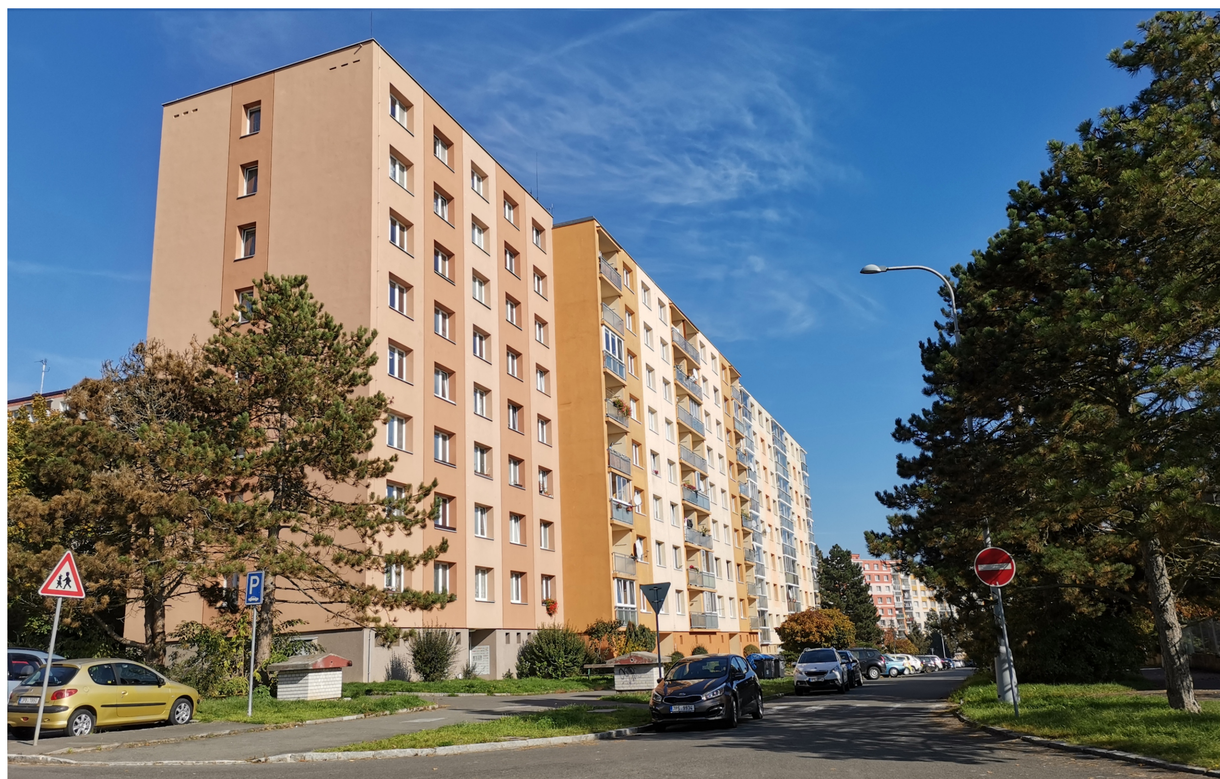
Severní Předměstí, Lochotín I, Elišky Krásnohorské čp. 753/48 – 749/40, pohled od jihozápadu.