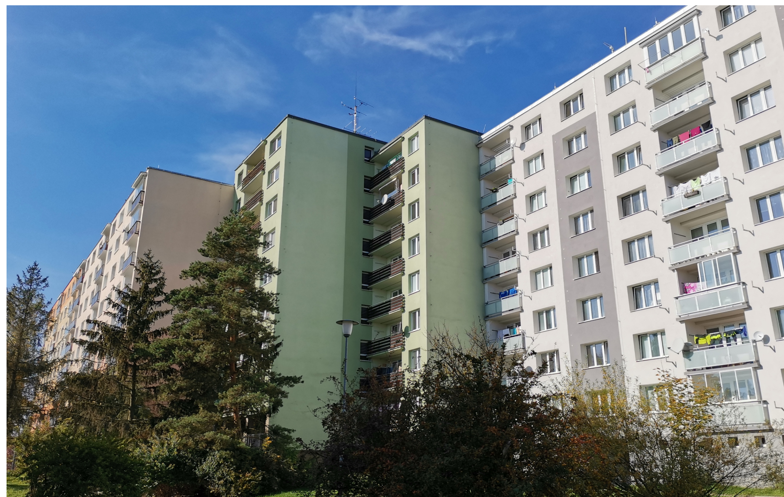
Severní Předměstí, Lochotín II, Sokolovská čp. 761/7 – 769/23, pohled od jihovýchodu. (2022)