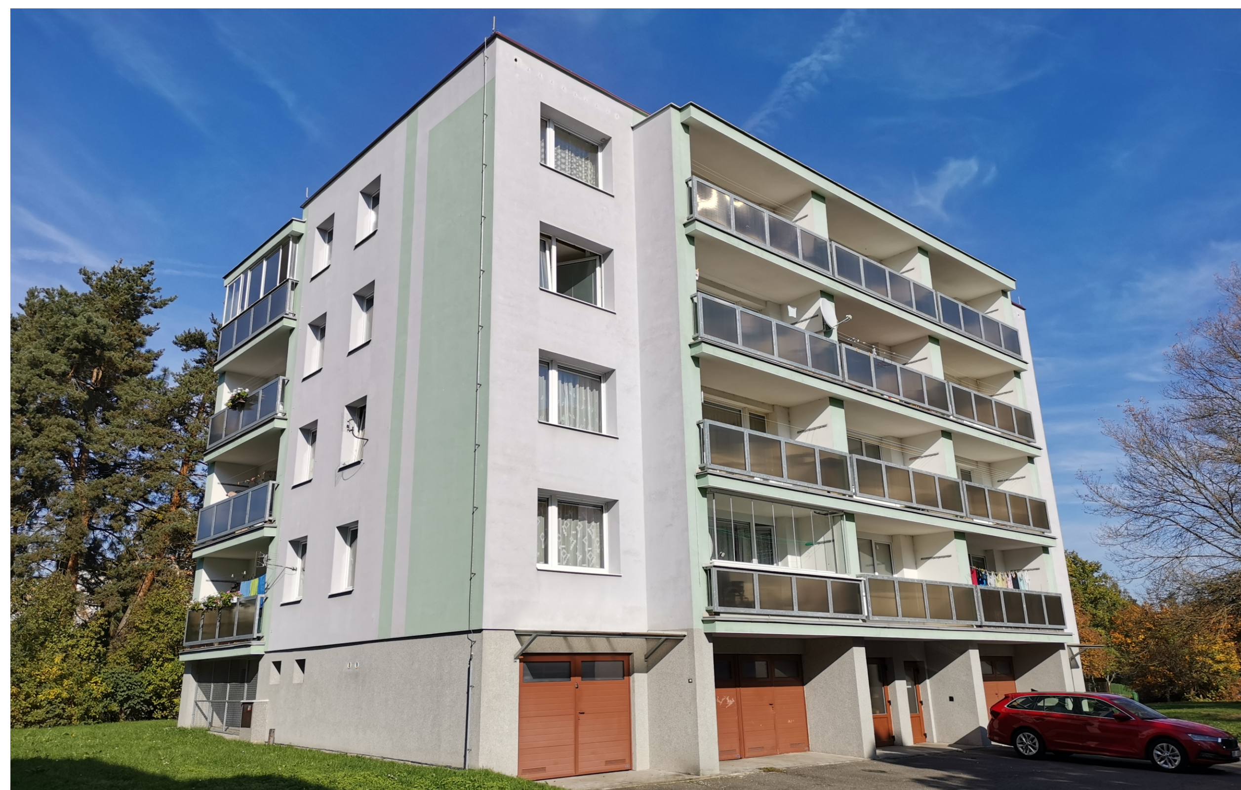
Severní Předměstí, Lochotín I, Elišky Krásnohorské čp. 734/6, pohled od jihozápadu.