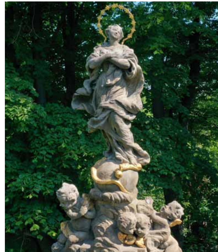
Panna Marie Immaculata