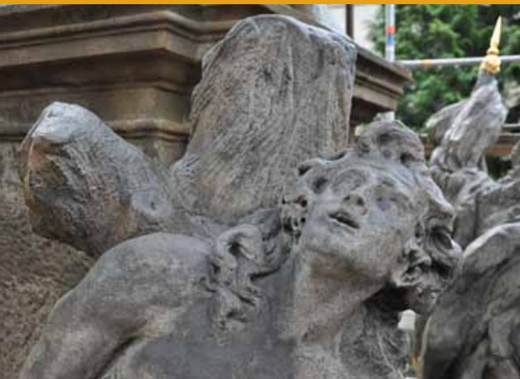
Sv. Šebestián, detail světcovy tváře

Samotné sousoší nesené tímto mohutným podstavcem, vysekané z prvotřídního jemnozrného královédvorského pískovce, typického pro dílnu Braunovu, kvalitou svého provedení architekturu sloupu výrazně převyšuje. I po staletích jsou v kameni patrné stopy použitých nástrojů a nejjemnější detaily modelace tváří a těl světců i jejich rouch nepřestávají udivovat dokonalostí svého zpracování.