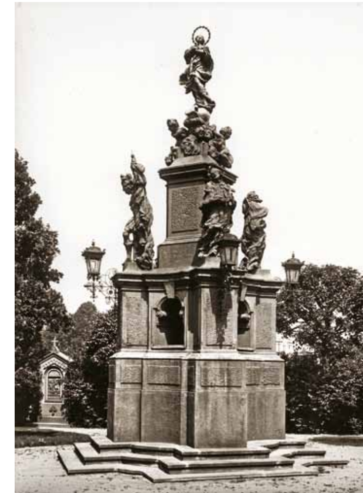
Sloup se sochou Panny Marie a sochami světců v zahradě kostela Nalezení sv. Kříže. V pozadí jedno ze zastavení křížové cesty. Foto kolem roku 1930.