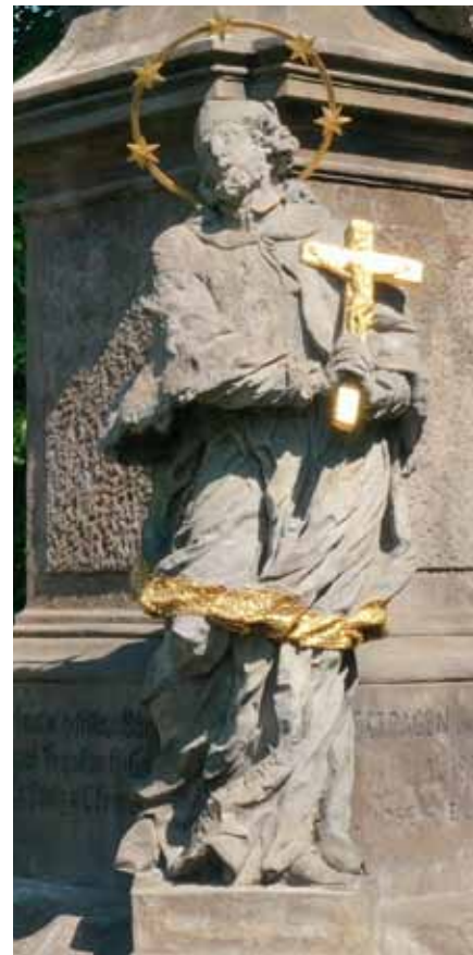
Sv. Jan Nepomucký

Jedná se přitom o krásu vsutku nevšední. Na třech pískovcových schodech je založen mohutný dvoustupňový oktogonální podstavec o půdorysu rovnoramenného kříže, čtyři předsazené pilíře přitom vynášejí sochy čtveřice světců. Hmota střední části sloupu je odlehčena barokně tvarovaným průhledem, ve kterém kdysi hořívla lampa. V této souvislosti stojí za zmínku, že světa morových sloupů bývala často jediným celonočním osvětlením náměstí. Druhý stupeň podstavce pak tvoří kvadratický pilíř, ve spodní části nesoucí tři nápisy, jeden vztahující se ke zřízení sloupu a dva k jeho obnovám v letech 1830 a 1877. Tento střední pilíř, členěný stejně jako první stupeň architektury pravouhlými kartušemi a výrazně profilovanými římsami, vrcholí sochou samotné Panny Marie. Architektura sloupu je vytvořena z hrubozrného pískovce pocházejícího z kamenolomu v Křížanech. Použitý materiál, provedení v poměrně jednoduchých formách a záznamy v městských účtech přitom nasvědčují, že podstavec nebyl součástí daru Karla Christiana Platze a vytvořili jej patrně místní umělci či řemeslníci.