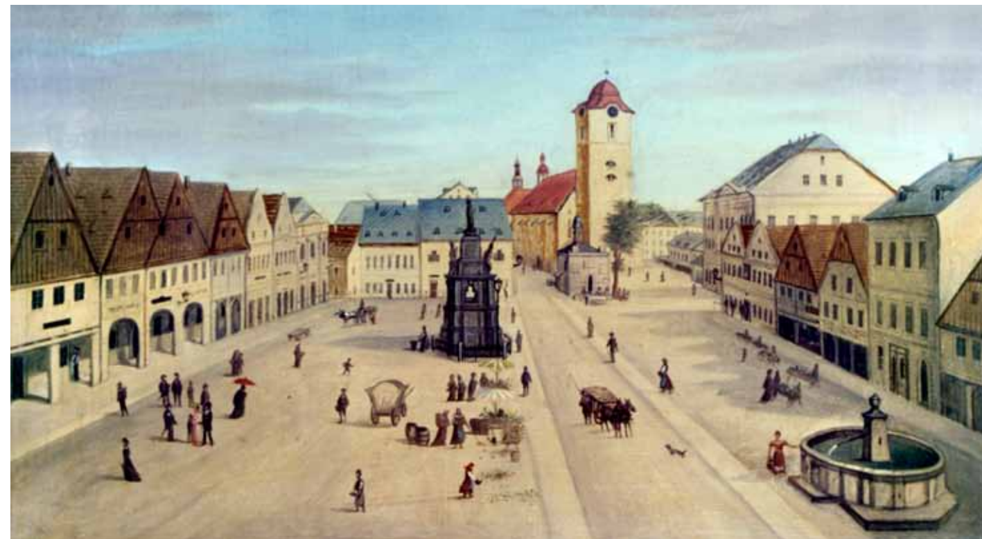
Na Novoměstském náměstí se sloup původně nacházel spolu s kaplí Božího hrobu patrnou v pozadí vyobrazení z 60. let 19. století. Kapli nyní rovněž nalezneme v zahradě kostela Nalezení sv. Kříže.

Dne 3. května 1719 se na Novoměstském, dnešním Sokolovském náměstí konala velká slavnost. Účastnili se jí představitelé města, zástupci církve, vrchnostenští i císařští úředníci, chudým se dostalo almužny, urození pánové rozhazovali peníze mezi přihlížející mládež a jeden zednický tovaryš dostal na pamětnou tři rány bičem. Toho dne byl totiž na náměstí položen základní kámen nového monumentu, sloupu zasvěceného Panně Marii, nejmocnější ochránkyni před morem. Panský hejtmán si jeho zhotovení objednal, nejen pro vyjádření vděčnosti za boží přízeň, ale jistě též pro stvrzení velkoleposti svého donátorského počínu i vlastní význačnosti, u nejpřednější ze sochařských dílen v Čechách, dílny Braunovy.