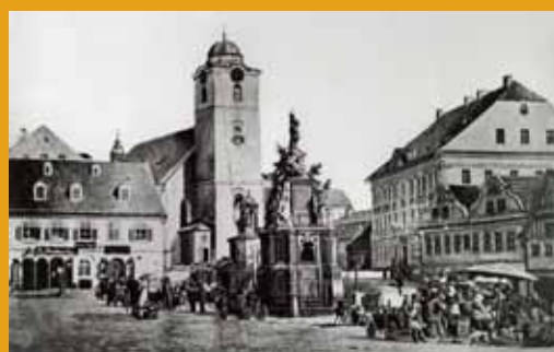
Mariánský sloup ve svém původním umístění na někdejší Novoměstském náměstí. V centru dění a všem na očích, stával sloup od svého zřízení roku 1719 do transferu v roce 1877. Vyobrazení před rokem 1870.

V zahradě kostela Nalezení sv. Kříže, v sousedství křížové cesty a kaple Božího hrobu, stojí téměř skryto zrakům veřejnosti dílo, zaujímající přitom jak svým stářím, tak především uměleckou kvalitou, čelné místo mezi sochařskými památkami nejen v samotném Liberci, ale i v jeho širokém okolí. Sloup se sochou Panny Marie a sochami světců pocházející z první čtvrtiny 18. století, zhotovený věhlasnou sochařskou dílnou Matyáše Bernarda Brauna, je výjimečným a velmi dobře dochovaným dokladem vynikajícího barokního umění. Sloup vznikl jakožto takzvaný morový, byl tedy díkuvzdáním, v tomto případě spíše osobním, gallasovského panského hejtmána Karla Christiana Platze z Ehrenthalu (1663–1722), za úspěšné přečkání nebezpečí černé smrti, která jen za hejtmánova života obcházela České země hned třikrát, v letech 1680, 1694 a 1713. Bývalo zvykem vyjadřovat vděčnost svatým ochráncům prostřednictvím budování památek, božích muk, kostelů, kaplí či kupříkladu oltářů, zasvěcených především Panně Marii, ale i dalším patronům proti moru, forma morových sloupů však byla relativně nová. V našich zemích se sloupy vztýčovaly od poloviny 17. století, nejvíce jich vzniklo po morových ranách let 1680 a především 1713. Zpravidla jim náležela čestná místa na náměstích či náběhách, na očích všem místním i příchozím. Nejinak tomu bylo v případě mariánského sloupu libereckého.