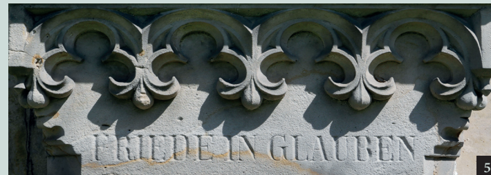
1/ Náhrobek Augusta Schimmela.