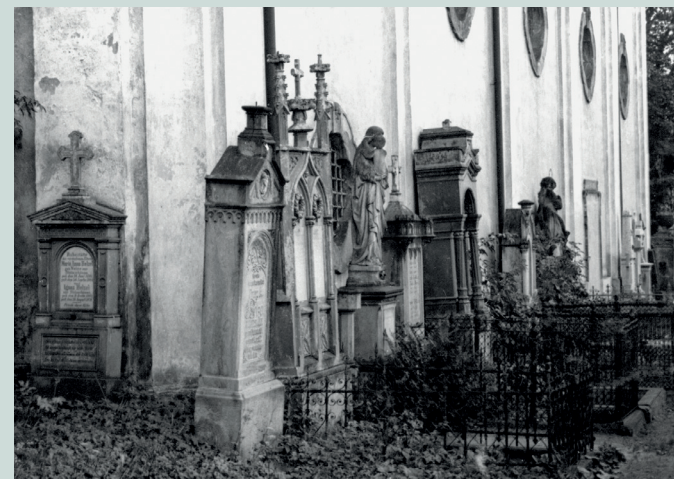
Jižní strana hřbitova v roce 1935.