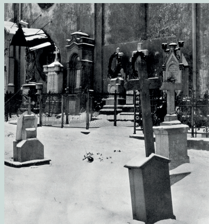
Jižní strana hřbitova před rokem 1910.

Koncem 18. století byla jižní část hřbitova již plně obsazena a kolem roku 1820 zrušena. V roce 1826 došlo ke zbourání jihozápadní části hřbitovní zdi a zároveň byla stržena hlavní hřbitovní brána nad schodištěm z 20. let 18. století. Místo ní byl postaven současný vchod s brankou s kamennými sloupy a vázami. Ve třetí čtvrtině 19. století byla kapacita celého hřbitova téměř obsazena, proto v roce 1883 založila obec severovýchodně od kostela hřbitov nový. V témže roce byl starý hřbitov oficiálně uzavřen a v roce 1910 zplanýrován. V roce 1935 zde bylo registrováno 84 náhrobků. V současné době je jich zachováno 50.