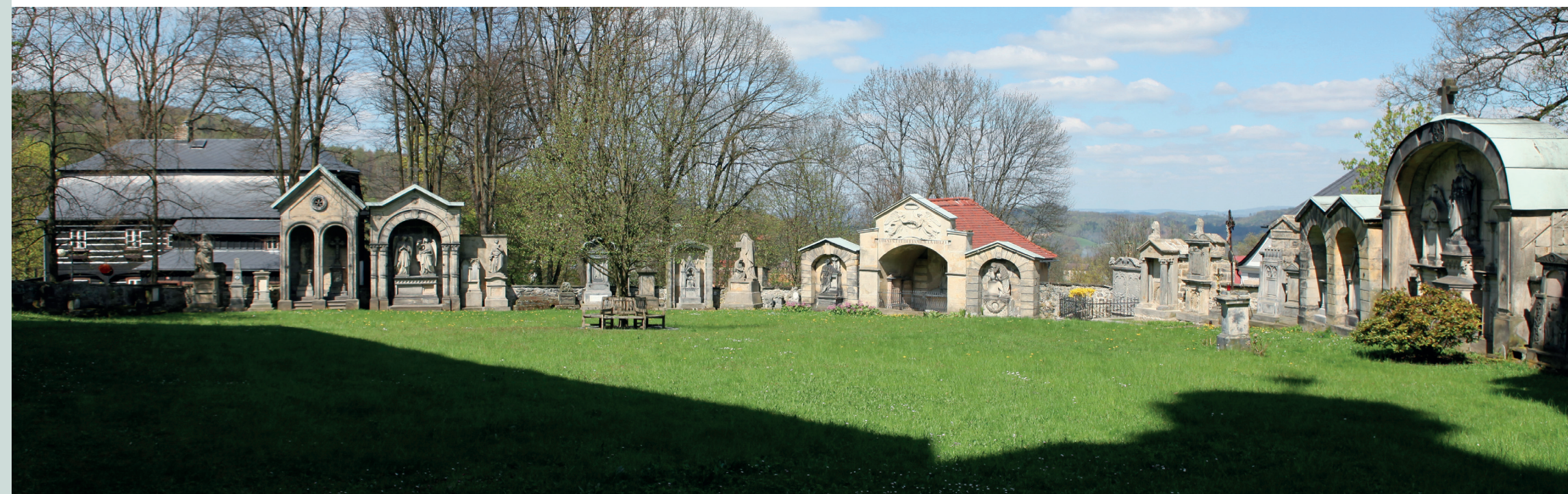
Celkový pohled na areál starého hřbitova u kostela Narození sv. Jana Křtitele.