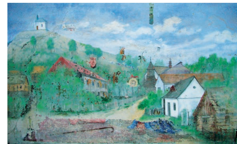
Pohled na obec Vyskeř od J. Žídky z roku 1951. Pod malbou prostupuje obraz Klanění pastýřů od F. Charouska z roku 1937. Vpravo detail sondy odhalující hlavu pastýře

malbu lidového charakteru. Na stropě se nacházel výjev zachycující pověst o šlechtičce Anně z Mladějova doplněný o nápis „SVATÁ ANNO, ORODUJ ZA NÁS.“ Nad severním a jižním vchodem do kaple namaloval Jáchym Židek proti sobě dva obrazy: na severu pohled na obec Vyskeř s procesím stoupajícím ke kapli sv. Anny s nápisem „POD OCHRANU TVOU SE UTÍKÁME, PATRONKO VYSKEŘSKÁ! K dějinám pouti na Vyskeř.“ Na protější straně znázornil klečící ženu s dětmi před vchodem do vyskeřské kaple s nápisem „ÚTOČIŠTĚ A POMOCNICE NAŠE, ORODUJ ZA NÁS! K dějinám Svatoannenské úcty ve Vyskři.“ Výsledkem restaurátorského průzkumu bylo rozhodnutí, prezentovat druhou nejstarší vrstvu výmalby, z roku 1903, s tím, že zůstane zachován obraz Klanění pastýřů od Františka Charouska a iluzivní oltář sv. Anny pravděpodobně od Jáchyma Žídky z roku 1951. Sejmuta tak měla být nejmladší vrstva výmalby (1951), která se sice svým námětem velmi úzce vázala k obci Vyskeř, ale její stav byl tak špatný, že docházelo k uvolňování malby od spodního souvrství a její upevňování ke spodním vrstvám by představovalo opakované a intenzivní fixáže a injektáže a tím přilepování mladších vrstev ke starší malbě, která by tímto krokem mohla být nenávratně poškozena. Současně měl být také sejmuto zelený emailový nátěr (1937) a tím mělo dojít k odkrytí velké většiny výmalby z roku 1903.