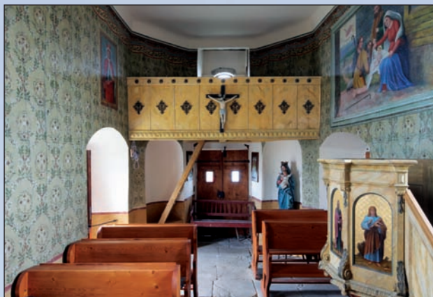
Celkový pohled do interiéru kaple sv. Anny směrem ke kůru