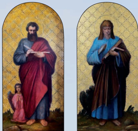
Obrazy z řečniště kazatelny, sv. Matouš a sv. Jan Evangelista

Nedílnou součástí zásahu bylo také restaurování veškerého interiérového vybavení kaple – barokní oltářní menzy, dvojstupňovitých předoltářních schodů, barokního svatostánku, kruchty pořízené v roce 1849 a na ní zavěšené plastiky ukřižovaného Krista, kazatelny s obrazy Evangelistů zhotovené firmou „Petra Buška synové“ – Dominikem Buškem z Husy u Sychrova v roce 1902, ale také i dvou novodobých sádrových soch Panny Marie a Ježíše Krista. Zachována byla poslední povrchová úprava mobiliáře, kterou získal ve 20. století, pravděpodobně v souvislosti s jednou z úprav interiéru kaple (1937, nebo 1951). Kruchta, svatostánek a poprseň kazatelny nesly imitaci světlého – okrového mramoru, oltářní menza navozovala iluzi světle zeleného mramoru a její vrchní deska červeného až růžového. Oltářní stupně byly opatřeny novodobým nátěrem, kombinující tři barvy, bílou, hnědočervenou a okrovou. Barvy byly seskládané tak, že představovaly koberec položený na stupních. Obdobná kombinace hnědočervené a okrové byla použita na noze kazatelny. Veškeré dekorativní řezby na kruchtě, kazatelně a menze nesly ztmavlý bronzový nátěr. Na kazatelně zcela chyběly dva obrazy Evangelistů, sv. Lukáše a sv. Jana, které byly nahrazeny volnými kopiemi.