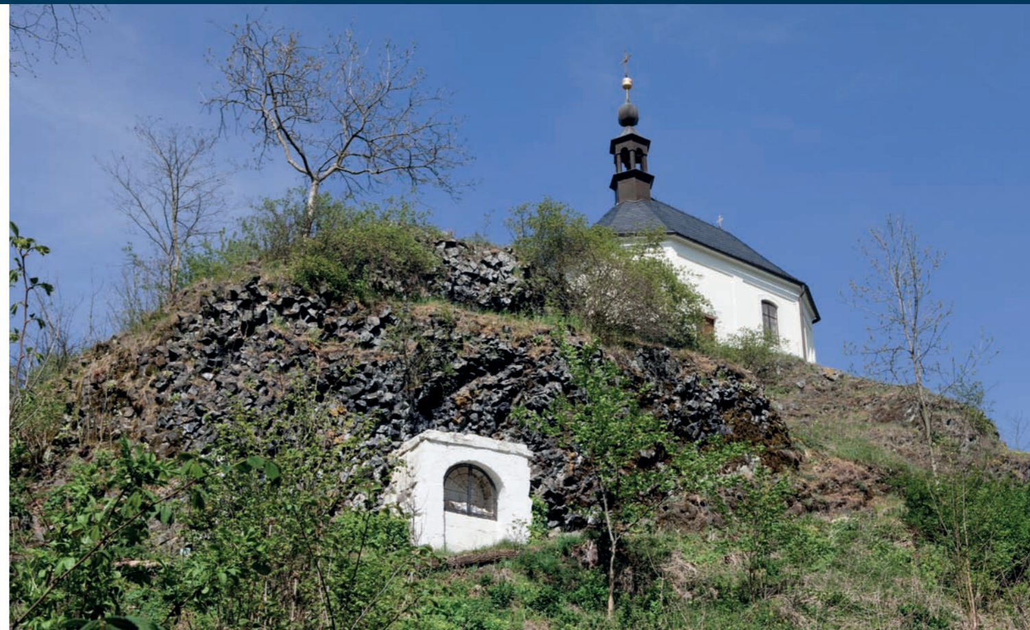
Pohled od jihu na Boží hrob a kapli sv. Anny