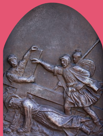
Reliéf V. zastavení křížové cesty, Šimon Syrenský pomáhá Pánu Kristu nést kříž

Kaple sv. Anny tvoří se skupinou dalších drobných objektů, čtrnácti zastaveními křížové cesty včetně Kalvárie se Svatými schody a Božím hrobem s tělem Páně nedílnou součástí areálu poutního místa, rozprostřeného nad obcí Vyskeř. Svým umístěním v nejvyšším bodě čedičového vrchu Hůra s nadmořskou výškou 465 metrů představuje výraznou dominantu Českého ráje. V obdobích její největší slávy, zejména ve druhé polovině 19. století a na počátku 20. století plnila funkci poutního místa regionálního významu. Poutní cestu ke kapli lemují lipová alej a jednotlivá zastavení křížové cesty, která začíná hned za areálem farního kostela Nanebevzetí Panny Marie a vine se vzhůru po jižním svahu vrchu, postupně jej obchází a pokračuje až ke stavbě Božího hrobu.