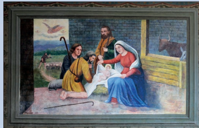
Obraz Klanění pastýřů od F. Charouska z roku 1937