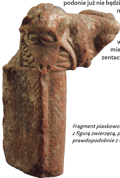
Fragment piaskowcowej dekoracji z figurą zwierzęcą, pochodzący prawdopodobnie z wieży

nać dokładnego opisu poszczególnych pomieszczeń zamku, przede wszystkim tych mieszkalnych i reprezentacyjnych.