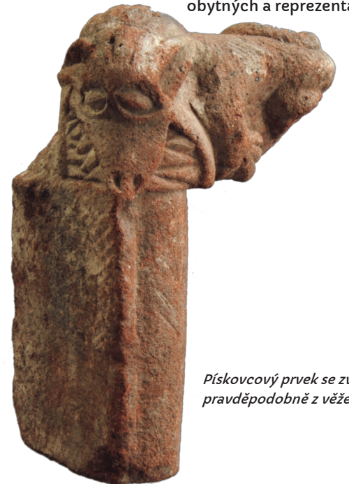
Pískovcový prvek se zvířecí figurou, pravděpodobně z věže.

Před zahájením archeologického výzkumu se na zalesněném pahorku rýsovaly pouze nepatrné zbytky zdí. Původně se předpokládalo, že zde budou zjištěny pozůstatky dřevohliněných staveb s minimem kamenných konstrukcí. V průběhu archeologického výzkumu byly oproti očekávání odhaleny pozůstatky gotického hradu, jehož zdivo dosahovalo v některých místech výšky až 8 m. Kromě objevu samotného hradu s množstvím architektonických článků zde bylo získáno velké množství archeologických nálezů, které vypovídají o životě posledních obyvatel hradu. Patří mezi ně například kamenné koule dělové i nahrubo opracované do praku, měděný kotel, manikúra či náprstek. V roce 1984 byl výzkum po odkrytí jádra hradu ukončen. Archeologické nálezy nebyly kompletně zpracovány, což ztěžuje jejich interpretaci. Naše představa o podobě hradu v době jeho zániku tak zůstane do vysoké míry hypotetická a zřejmě nikdy už nedokážeme přesně popsat podobu jednotlivých vnitřních prostor hradu, především těch obytných a reprezentačních.