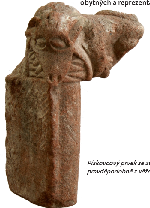
Pískovcový prvek se zvířecí figurou, pravděpodobně z věže.

Před zahájením archeologického výzkumu se na zalesněném pahorku rýsovaly pouze nepatrné zbytky zdí. Původně se předpokládalo, že zde budou zjištěny pozůstatky dřevohlíněných staveb s minimem kamenných konstrukcí. V průběhu archeologického výzkumu byly oproti očekávání odhaleny pozůstatky gotického hradu, jehož zdívo dosahovalo v některých místech výšky až 8 m. Kromě objevu samotného hradu s množstvím architektonických článků zde bylo získáno velké množství archeologických nálezů, které vypovídají o životě posledních obyvatel hradu. Patří mezi ně například kamenné koule dělové i nahrubo opracované do praku, měděný kotel, manikúra či náprstek. V roce 1984 byl výzkum po odkrytí jádra hradu ukončen. Archeologické nálezy nebyly kompletně zpracovány, což ztěžuje jejich interpretaci. Naše představa o podobě hradu v době jeho zániku tak zůstane do vysoké míry hypotetická a zřejmě nikdy už nedokážeme přesně popsat podobu jednotlivých vnitřních prostor hradu, především těch obytných a reprezentačních.