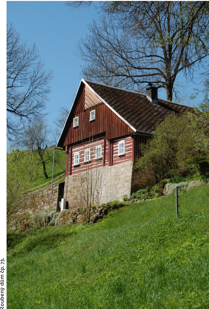
Roubený dům čp. 73.

Po skončení druhé světové války bylo německé obyvatelstvo vysídleno. Kdysi tak krásná a hustě osídlená obec již nebyla znovu obydlena a spousta domů zanikla. Z 97 domů v roce 1901 jich zůstalo jen 25. Důvodem byla špatná dopravní dostupnost, strmé kopce, v zimě sněhové závěje, velká vzdálenost k pracovním místům apod. Naopak toto vše a pak také krása údolí a nedotčená příroda podnítilo budoucí obyvatele, že si zvolili Skalku jako rekreační oblast. V obci se ustálilo rčení, že Skalka je poslední ráj na zemi .