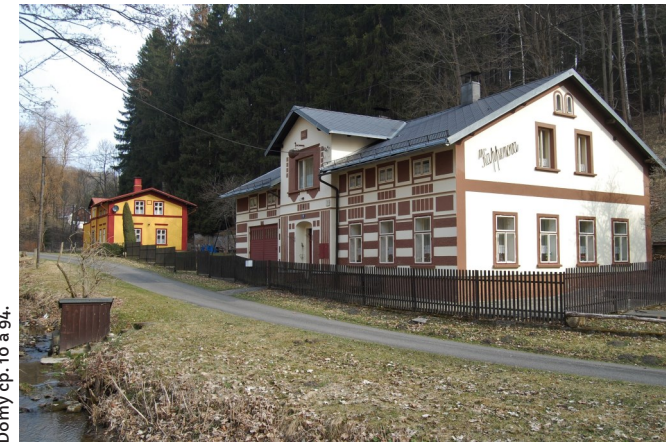
Domy čp. 10 a 94.