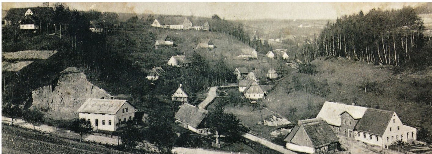
Dolní část vsi. Výřez z dobové pohlednice.

Ve vesnici se nenachází kostel ani hřbitov, Skalka byla přiřazena ke Stárkovu, dnes k hronovské farnosti. Nejbližší kostel je ovšem ve Stárkově. Není zde ani budova školy. První zprávy, které máme o vzdělávání dětí ve Skalce, hovoří o tzv. pokoutních školách. Byla to obvyklá praxe zejména na vesnicích koncem 18. a začátkem 19. století, kdy se některý z dospělých obyvatel, většinou sečtější řemeslník nebo válečný invalida, ve svém vlastním obydlí pokoušel naučit skupinku dětí základům čtení a psaní, trochu počítat a odříkávat odstavce