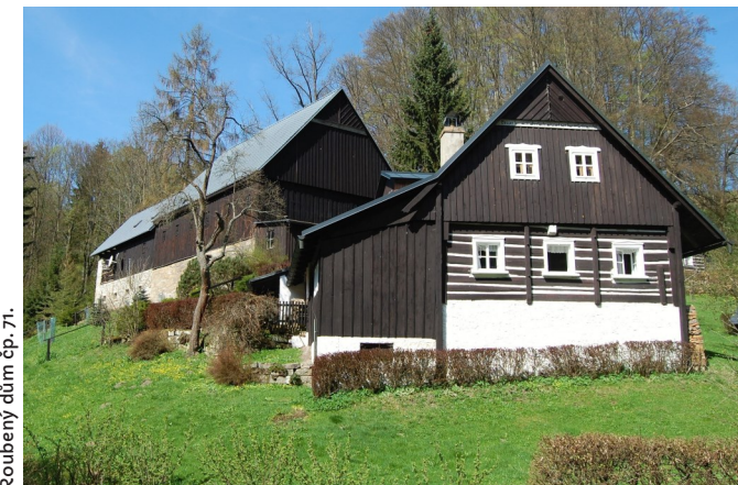
Roubený dům čp. 71.

Původní střešní krytinou byly slaměné došky, případně dřevěný šindel nebo kombinace obojího. Tyto krytiny byly od přelomu 19. a 20. století nahrazovány eternitovými šablonami nebo pálenými drážkovými taškami a po druhé světové válce falcovaným plechem.