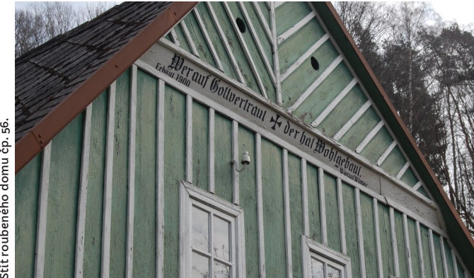
Štít roubeného domu čp. 56.

svisle kladených prken a ve vrcholu, odděleném vyřezávanou obloučkovou lištou, na koso do stroměčku nebo klasu, spáry jsou lištované. V předělu štítu mívají stavby příčná prkna opatřená nápisy obsahující kromě datací, jmen stavebníků a tesařských mistrů také různé průpovídky a rčení. Např. dům čp. 56 má na štítu nápis Wer auf Gott vertraut, der hat Wohl Gebaut. Erbaut 1900. Wenzel Winter (Kdo v Bohu věří, ten dobře staví), na štítu domu čp. 71 Besser Bau nicht all zu feste wir sind nur kurze Erdengäste (Lepší nestavět vše tak pevně, jsme jen krátkými hosty země).