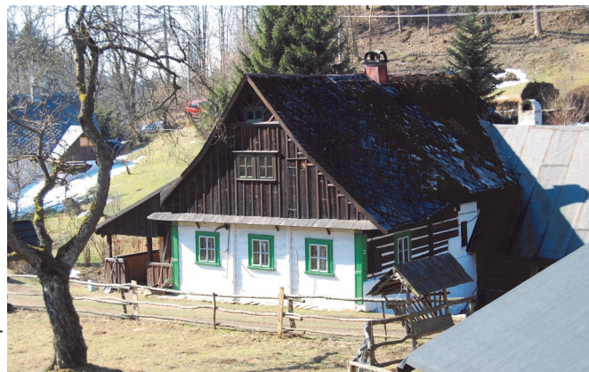
Chalupa č.e. 62

pro oblast Orlických hor. Stavby lze typologicky zařadit k širší oblasti východosudetského domu, která se táhne od Jestřebích hor až po Králícký Sněžník a Jeseníky. Venkovská zástavba je až na výjimky přízemní. Patrové stavby se omezují na významnější budovy školy nebo výrobní objekt kovárny. Základními znaky jsou roubená konstrukce často kombinovaná se zděnými hospodářskými prostory s kamennými portály, vyšší strmější střecha, obvykle jednoduše bedněný štít s podlomením a stěnové kleštiny. Domy mají tradiční trojdílné půdorysné uspořádání chlévního typu, často s chlévy přístupnými ze síně. Dochoval se i jeden dům celoroubený, č.e. 32, jen zadní chlívek je kamenný. K dalším typickým prvkům lze zařadit i samostatné bedněné přístavky vstupních zádveří se sedlovou stříškou, které poskytují ochranu před povětrnostními vlivy (č.e. 66) nebo dnes již vzácně zachovaná sdružená okénka ve štítu krytá stříškou (č.e. 64). Objevuje se i kryté bedněné zápraží, které sloužilo doslova za předsíň, ale i jako kůlna a dřevník (č.e. 40, 67). Vyskytují se i zápraží s vyřezávanými sloupky uzavřená pavláčkou, tzv. besídka (č.e. 55, 56). Ty ojediněle přechází v ochoz na vysoké podezdívce před štítovým průčelím (č.e. 64).