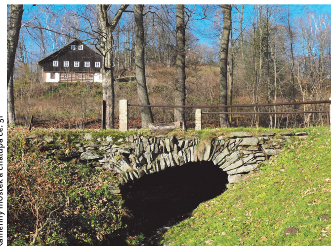
Kamenný mostek a chalupa č.e. 51

Ve střední části vsi se nachází žulový památník obětem 1. světové války a nedaleko také kaplička Panny Marie. Vystavěna byla v roce 1858, má obdélný půdorys s půlkruhově