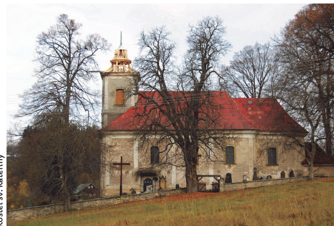
Kostel sv. Kateřiny

Architektonicky nejvýznamnější stavbou a největší dominantou Kačerova je kostel sv. Kateřiny postavený v letech 1796–1798 v raně klasicistním slohu nad dolní částí vsi. Jedná se o poměrně mohutnou orientovanou jednolodní stavbu obdélného půdorysu s mírně předsazenou západní věží zasazenou do hmoty kostela a trojbokým presbytářem, na němž v jedné ose navazuje obdélná sakristie. Fasády tektonicky člení hladké lizénové rámy v kombinaci s plochami s hrubou omítkou. Velmi pěkný je klasicistní západní portál s kolovratským znakem a vročením 1798. Návrh kostela je připisován A. Kermerovi, případně se může jednat o dílo kolovratského stavitele. Kostel v současnosti prochází kompletní obnovou a postupně se mu vrací původní krytina z dřevěného štípaného šindele.