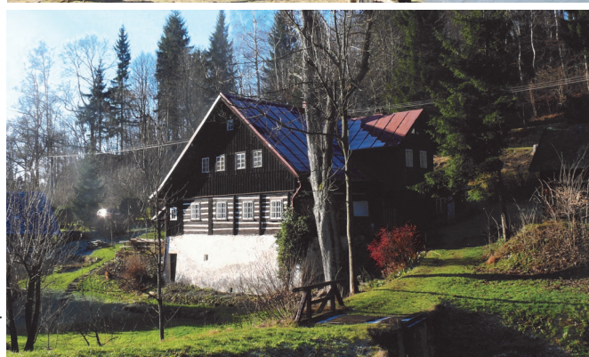
Chalupa č.e. 56

Od poslední čtvrtiny 19. století byly obytné stavby často přestavovány a rozšiřovány. Byly navyšovány o bedněná polopatra (např. č.e. 63, 66, 67, 68). Objevují se také velké sedlové obytné vikýře (např. č.e. 40, 42, 56). Jejich výstavba by mohla, obdobně jako v sousedních Krkonoších, souviset s postupným rozvojem turistického ruchu.