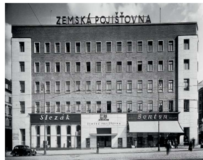
Historická fotodokumentace Moravské zemské životní pojišťovny.