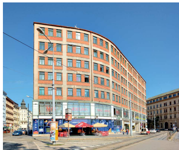
Vnější plášť Paláce Morava s příznačným strukturálním členěním, současný stav.