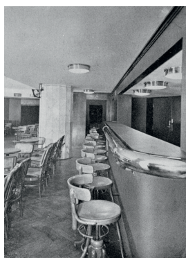
Historická fotodokumentace interiéru Paláce Morava a Moravské zemské životní pojišťovny.