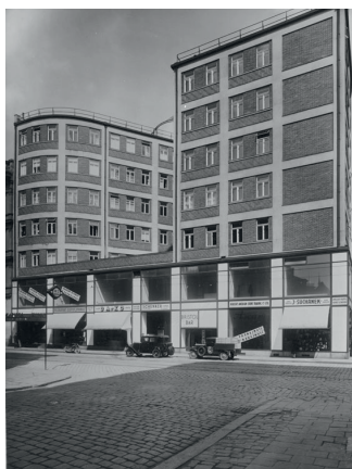
Historická fotodokumentace Paláce Morava.