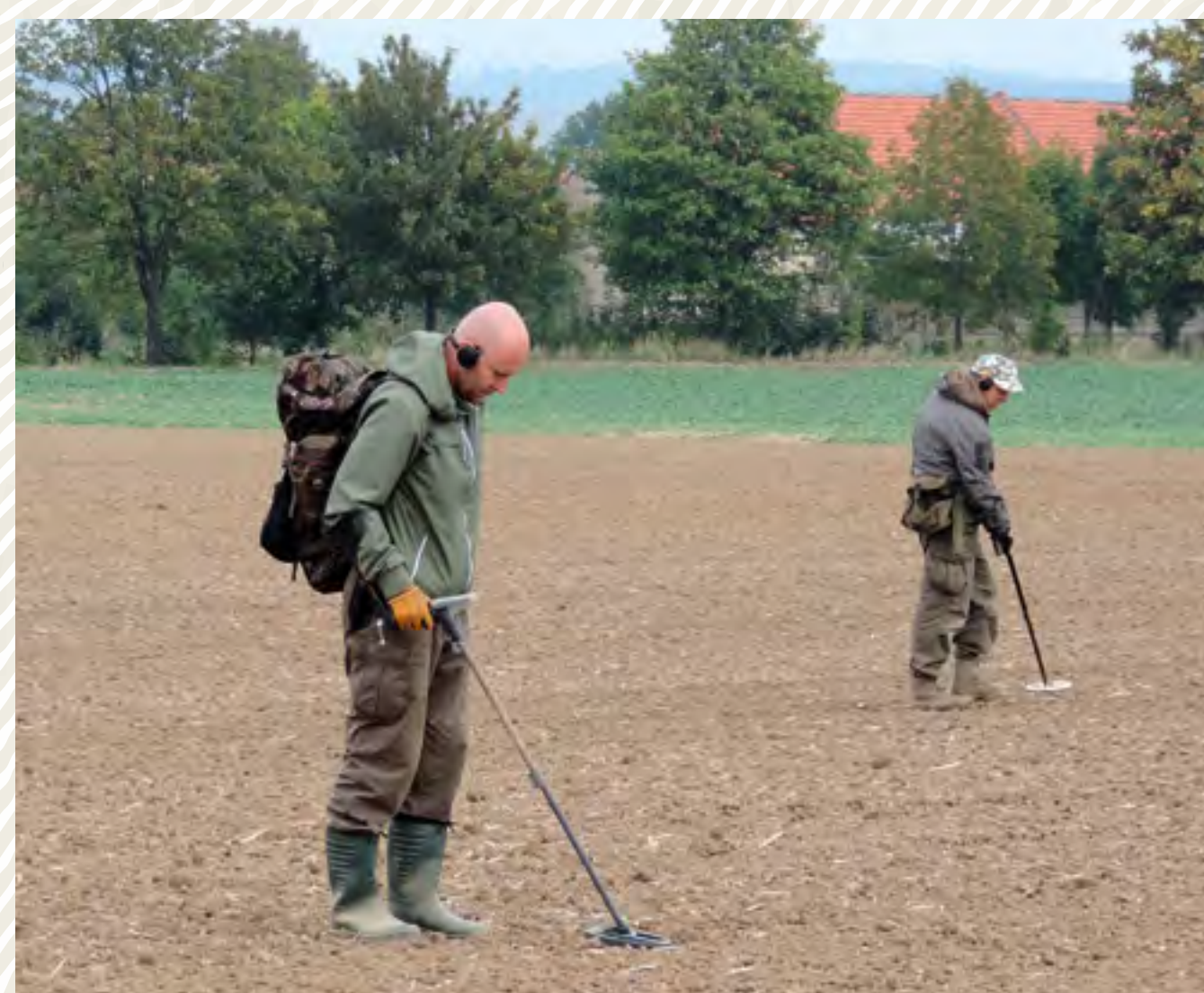
Aplikace detektorové prospekce v prostoru areálu středověkého bojiště u Lipan