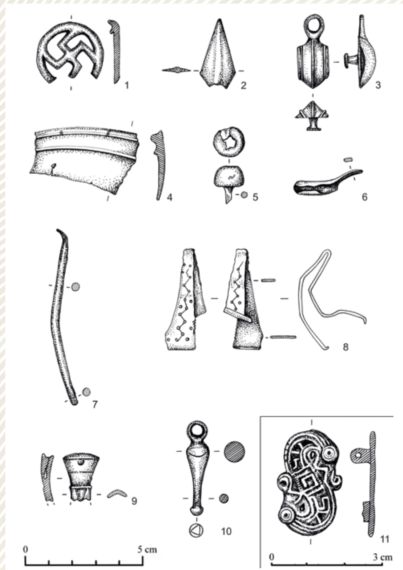
Drobné nálezy získané detektorovou prospekcí v letech 2018 a 2019