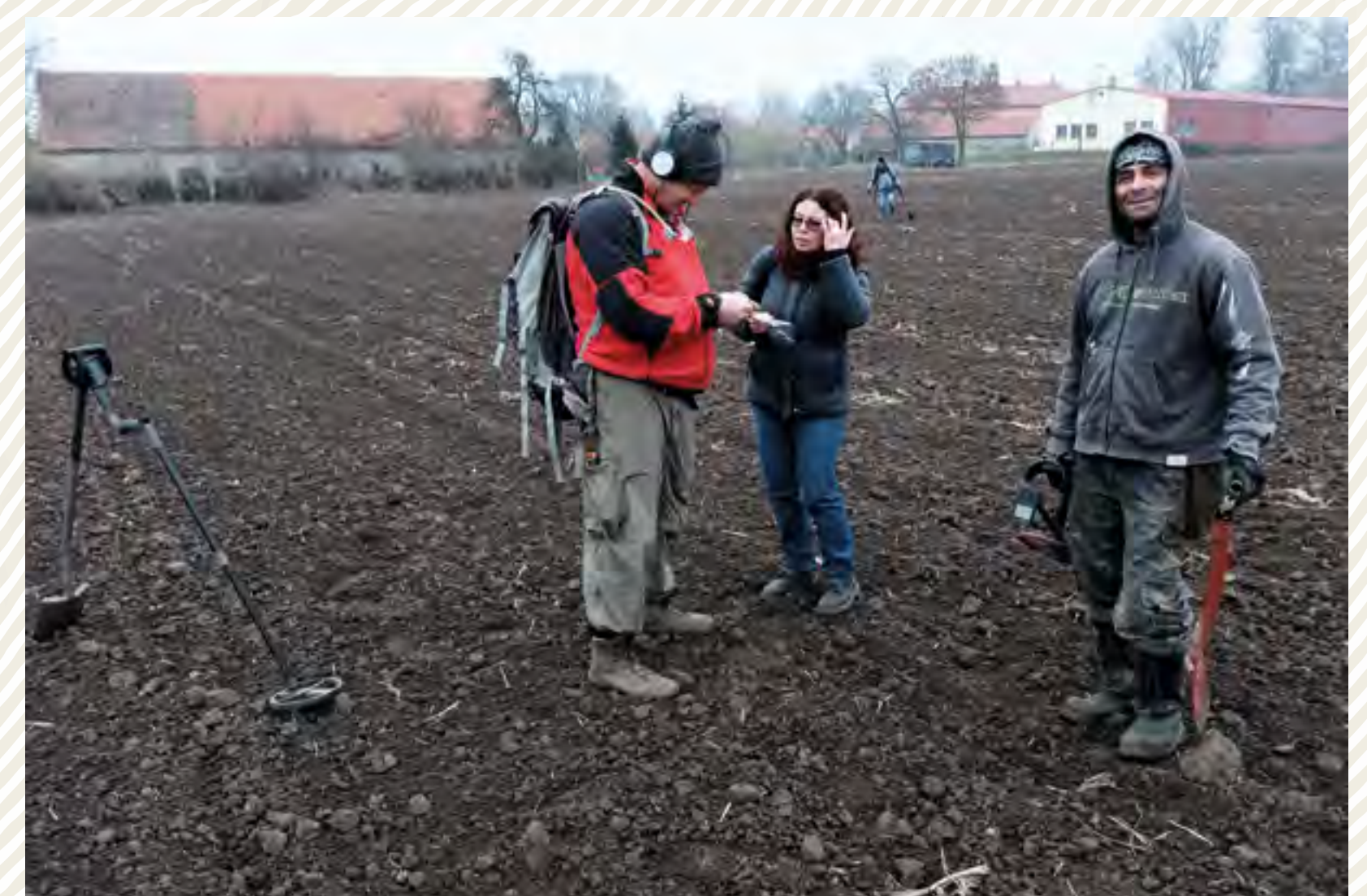
Autor: Mgr. Lenka Militká