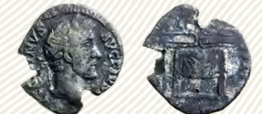
Denár Antonina Pia (138–161)