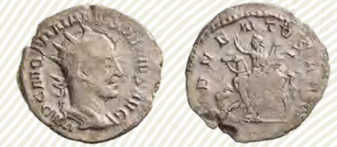
Antoniniani Traiana Decia (249–251)