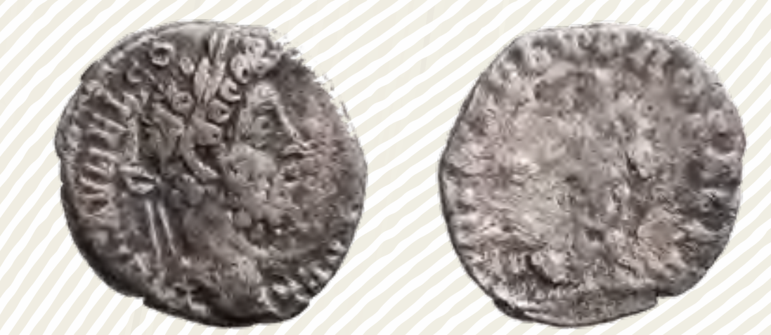
Denár císaře Commoda (180–191)