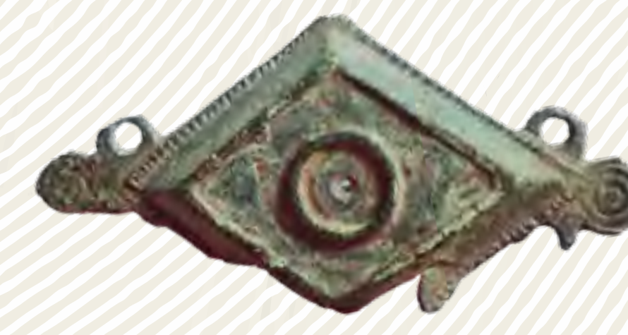
Destičkovité spony vyrobené v oblasti severních římských provincií (2.–3. století)