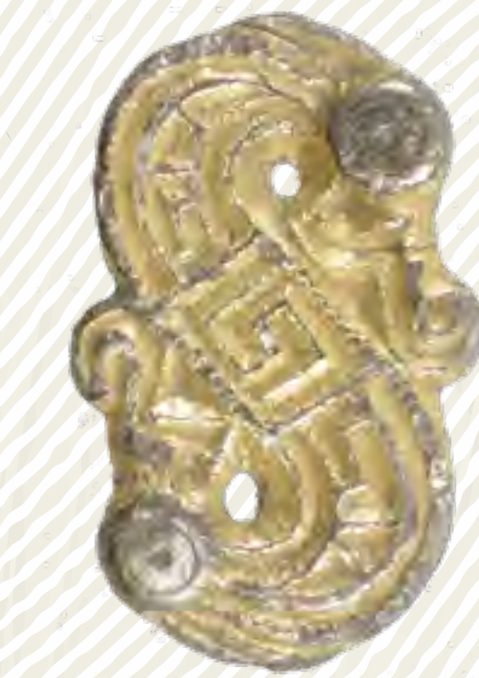
Esovitá ptačí spona vyrobená ze stříbra, na lící straně pozlacená (doba stěhování národů)