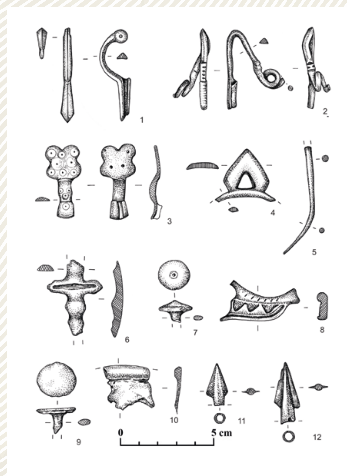
Nálezy získané detektorovou prospekcí v letech 2016–2018