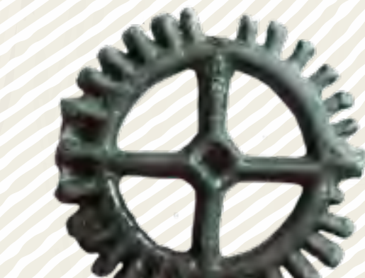
Loukořtové kolečko (pravděpodobně amulet) z doby laténské (2.–1. století př. Kr.)