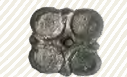
Avarské postříbřené kování