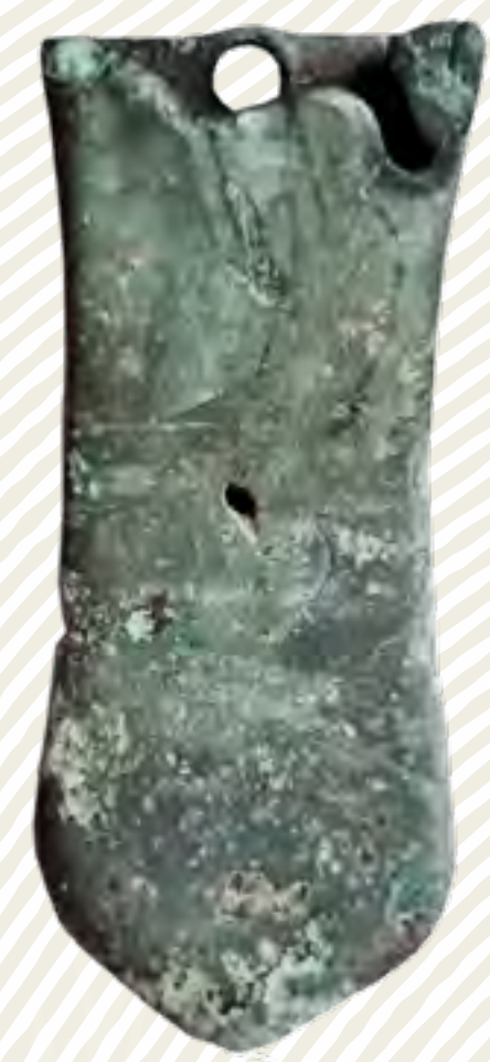
Avarské bronzové nákončí opasku (8. století)