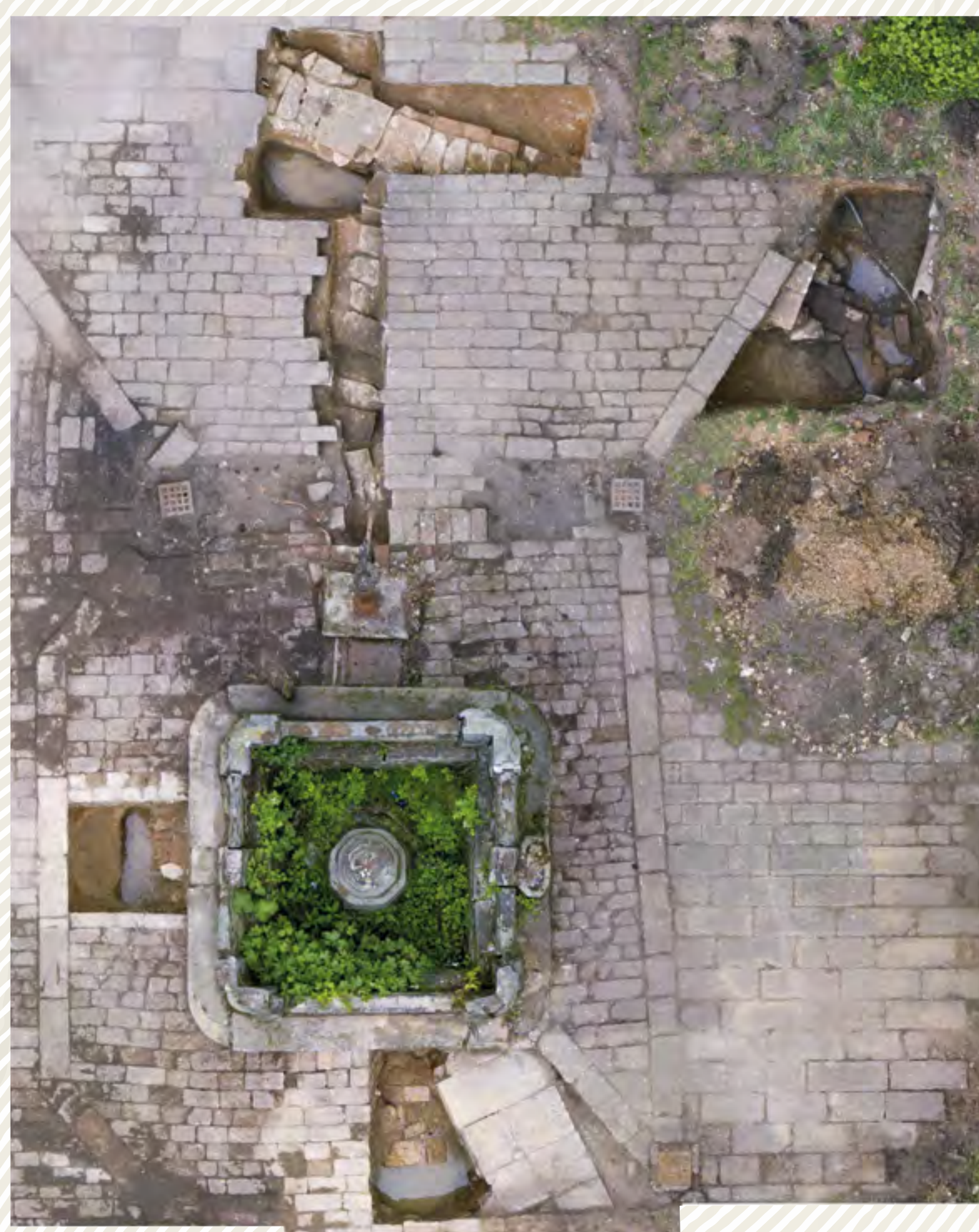
Obr. č. 1, 1a: Státní zámek Hrádek u Nechanic, nádvoří jízdárny – sondáž cílená k ověření přítomnosti archeologizovaných fragmentů zdiva

Ve spolupráci s ostatními útvary Národního památkového ústavu ověřuje prostorové umístění kulturních památek archeologické povahy (obr. č. 6).