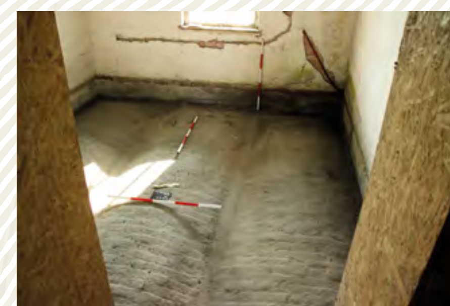
Obr. č. 3, 3a: Státní zámek Ratibořice u České Skalce, objekt čp. 10 – zášyp podlahy