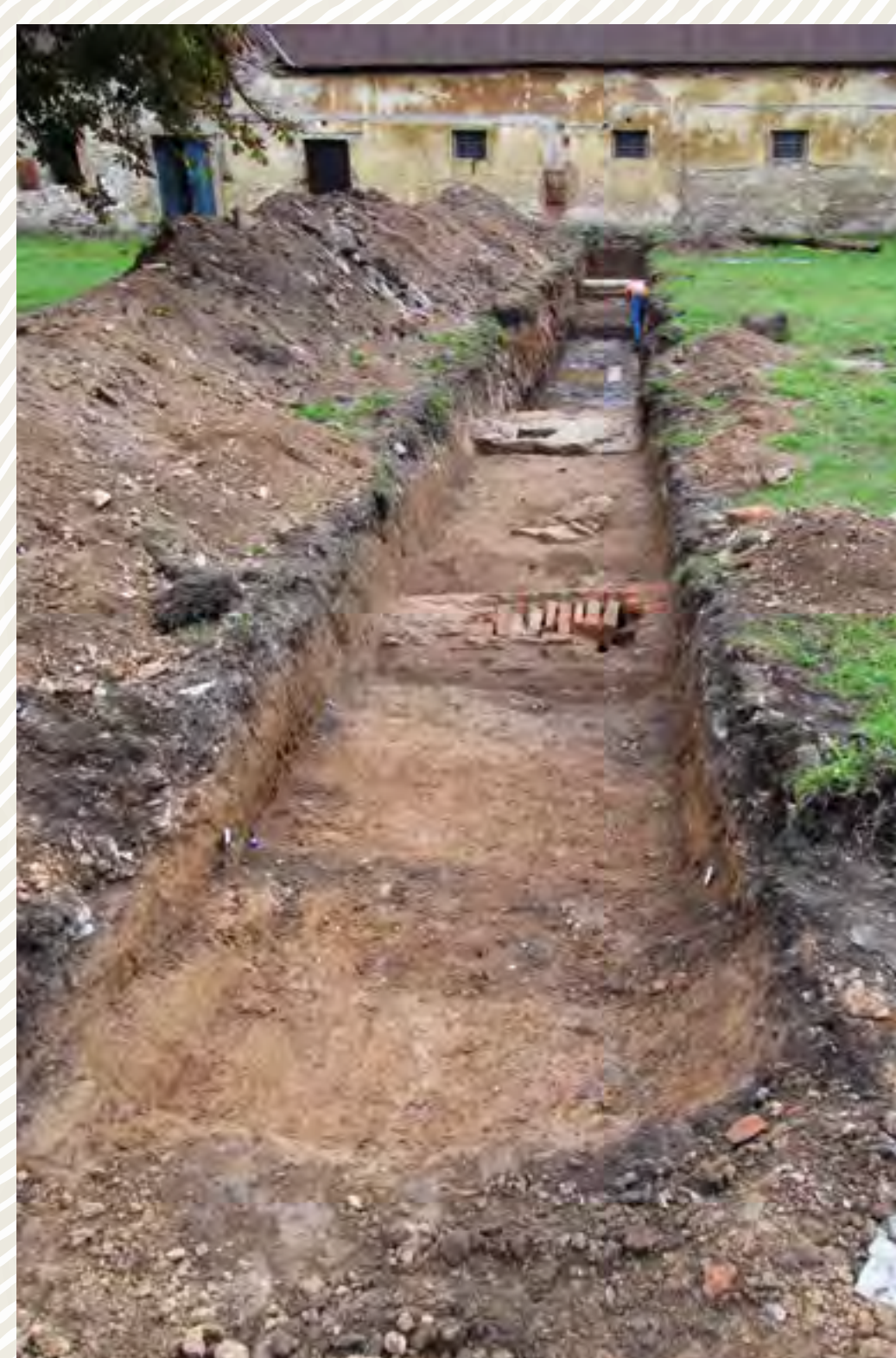
Obr. č. 4: Státní zámek Ratibořice u České Skalce, nádvoří hospodářského dvora