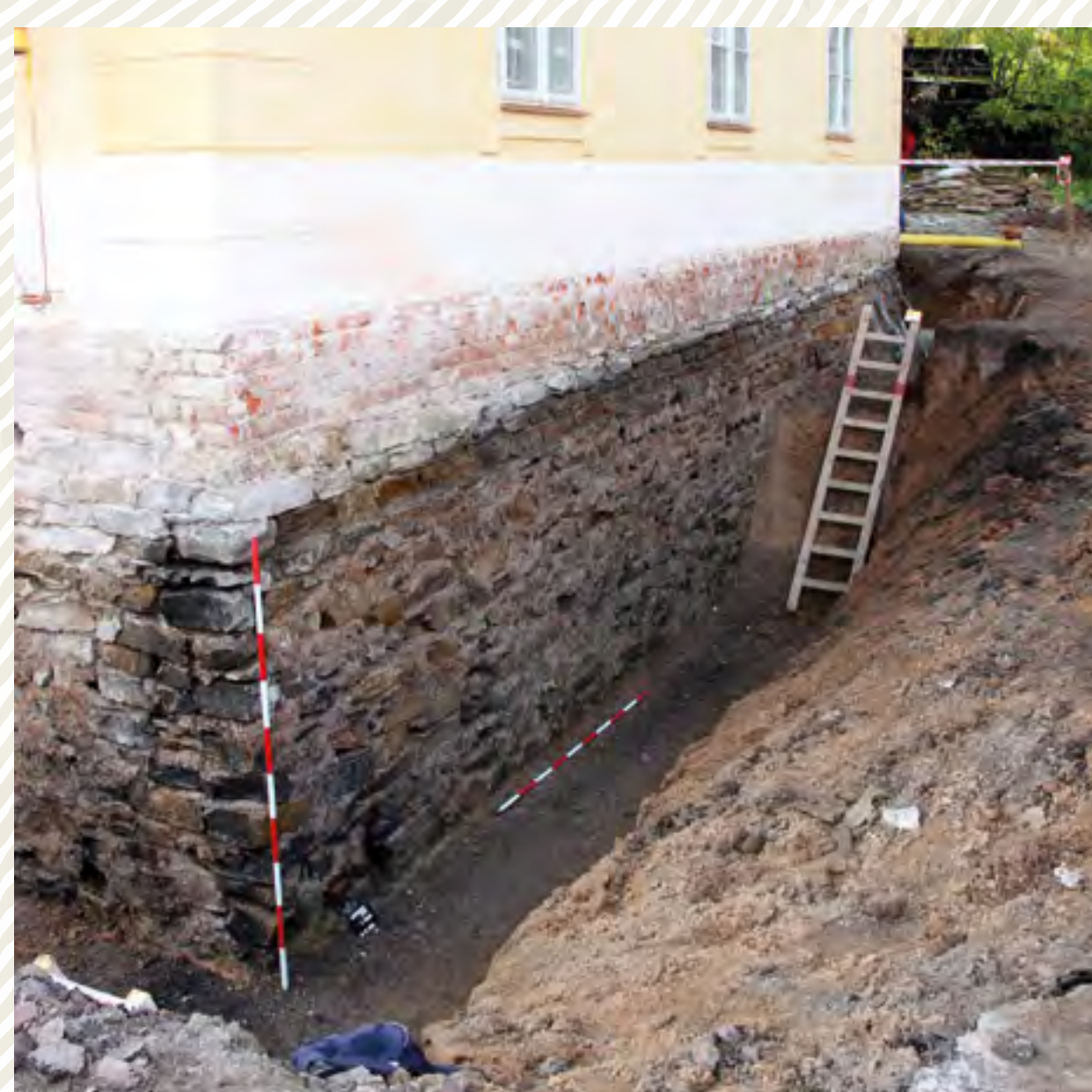
Obr. 5: Státní zámek Ratibořice u České Skalce, objekt čp. 10 – drenážní práce