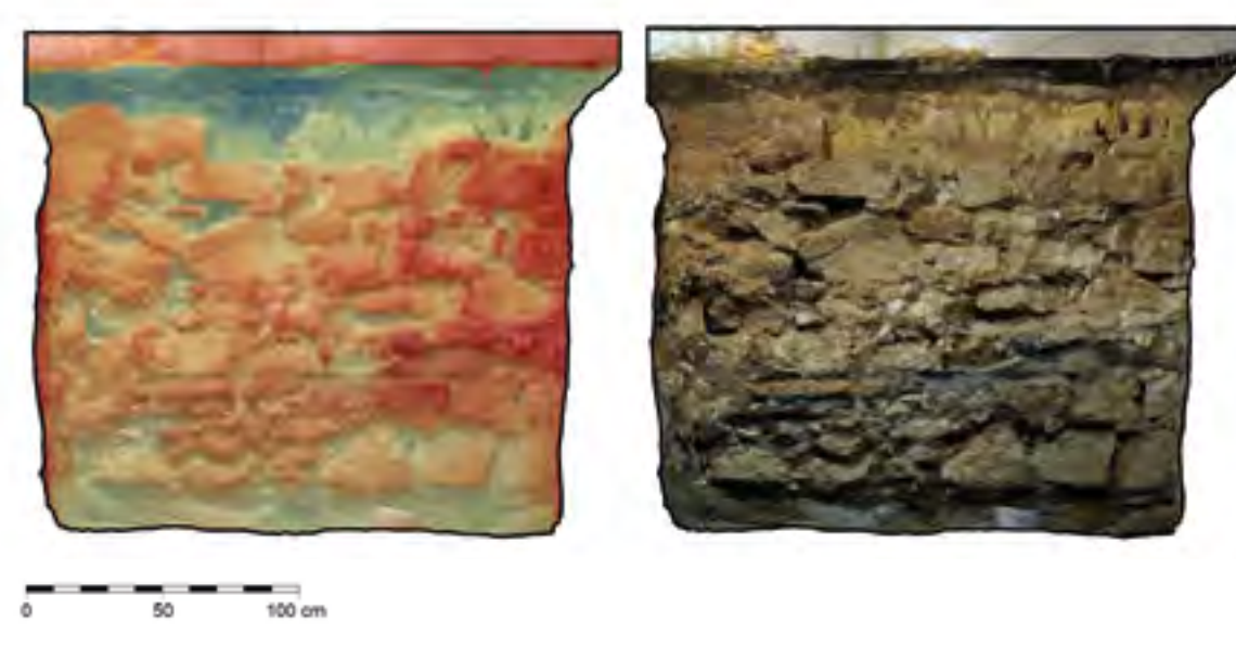
Obr. č. 2: Státní zámek Hrádek u Nechanic, čp. 40 - dokumentace zdiva, základové spáry, úroveň spodní vody a pozice fragmentů zdiva vůči jejímu lici