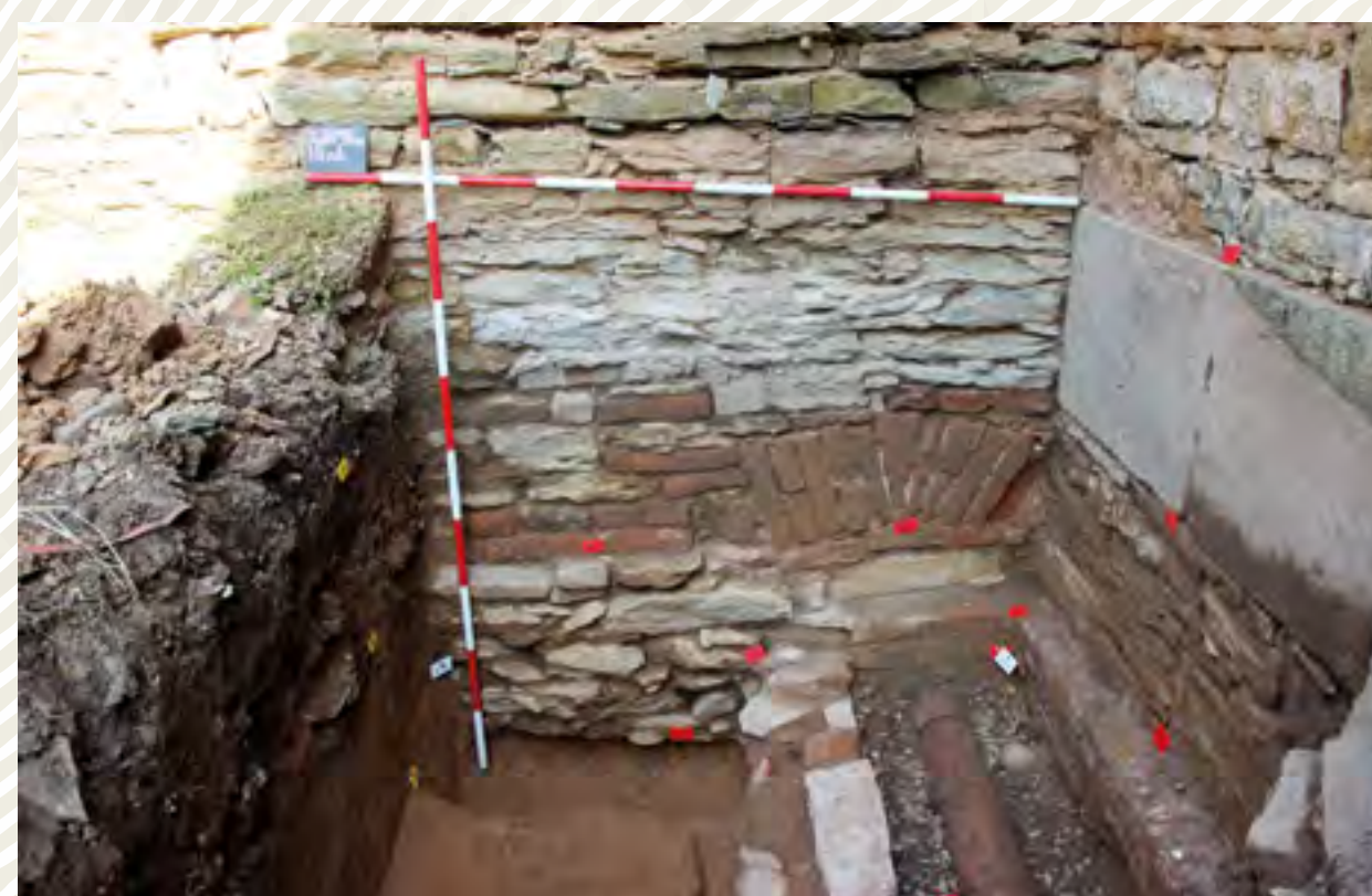
Obr. 4a: Státní zámek Ratibořice u České Skalce, vnější líc obvodového zdiva ovčína v areálu hospodářského dvora