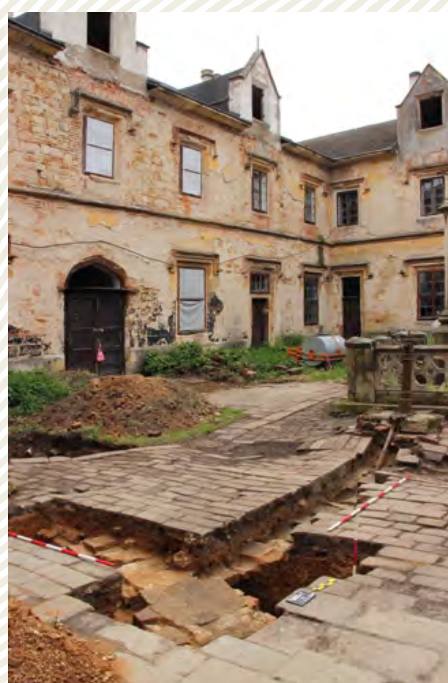
Obr. 4b: Státní zámek Ratibořice u České Skalce