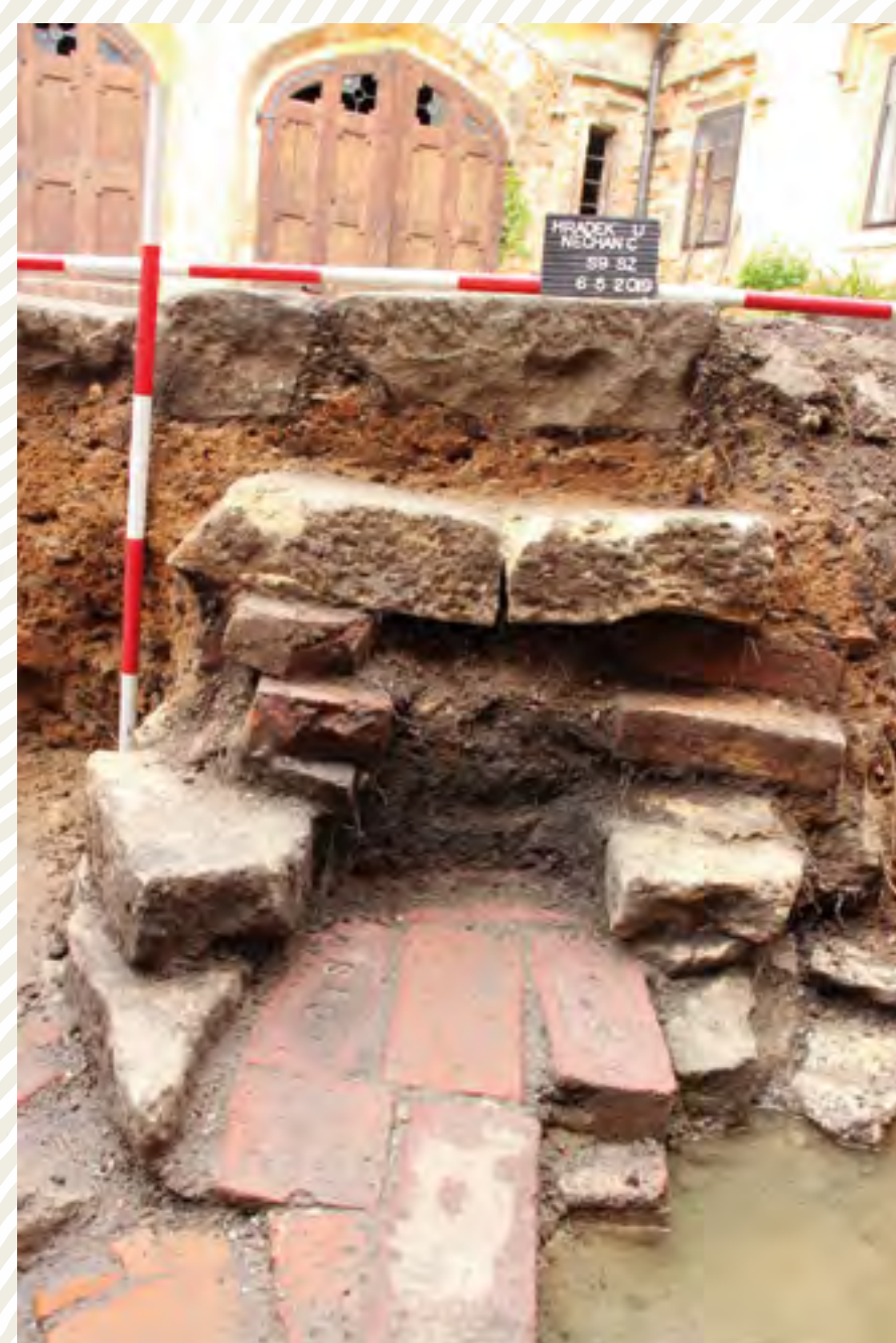
Obr. 4c: Státní zámek Ratibořice u České Skalce