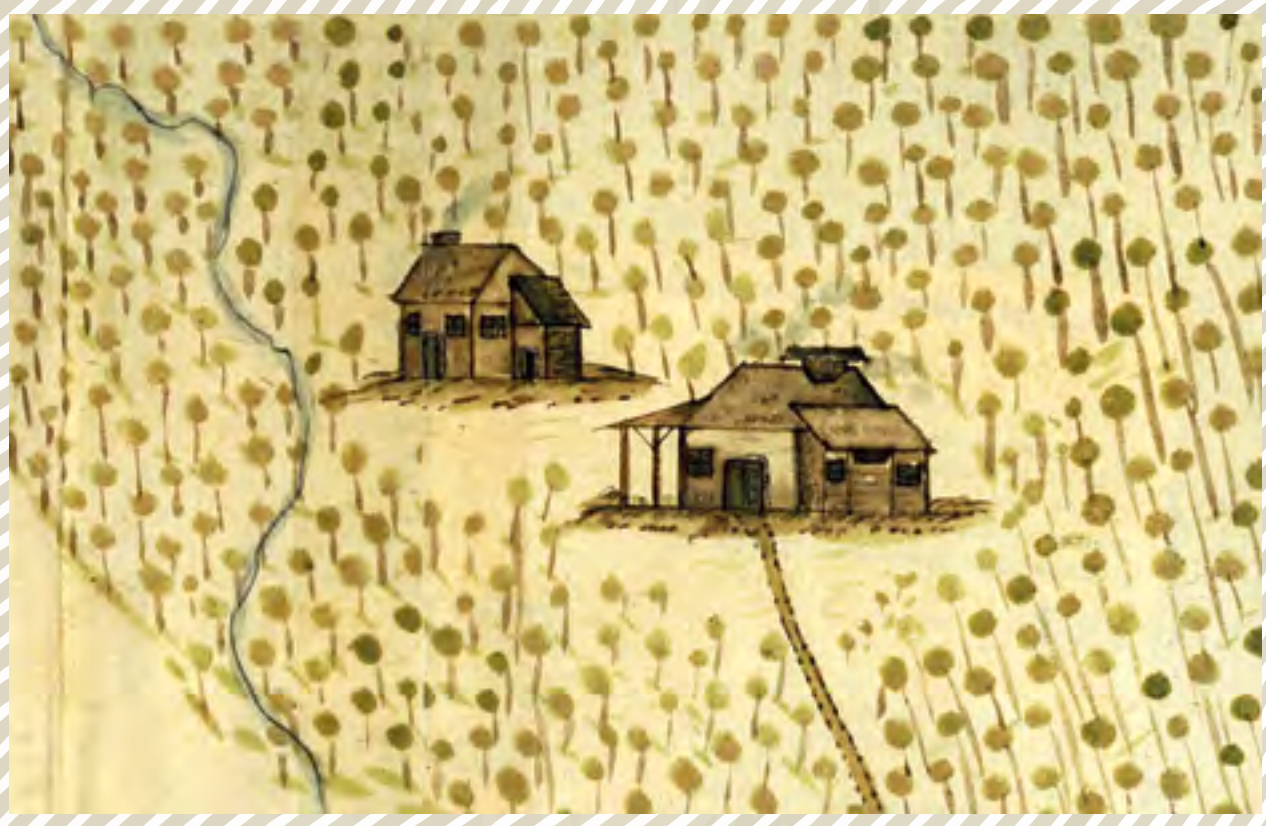
Zobrazení nové sklárny v Zadních hutích pod Třemšínem na plánu sklářské osady a hutního okrsku z r. 1744. Národní archiv Praha, fond Arcibiskupský archiv, Štumpflův urbář, B 178, str. 130, připojená mapa pozemků náležejících k huti

Ve středních Čechách byla souvisleji zalesněná území spojená s členitými geomorfologickými prvky, jako jsou Brdy a Křivoklátská vrchovina, nebo širší území kolem středního toku řeky Sázavy na styku Středočeské pahorkatiny a Českomoravské vrchoviny. Právě v tomto prostředí se v období po hospodářském úpadku třicetileté války projevuje merkantilistický přístup držitelů statků ve snaze o hospodářské využití majetků, která mimo jiné vedla k zakládání skláren jak na území starých hvozdu, tak v ne zcela zalesněné krajině. Sklárny přinášely profit relativně rychle, vyžadovaly poměrně nízkou počáteční investici a byl to také způsob, jak s poměrně rychlou návratností využít válek zpustlé, původně zemědělsky obdělávané, ale už dávno vzrostlým lesem porostlé území.