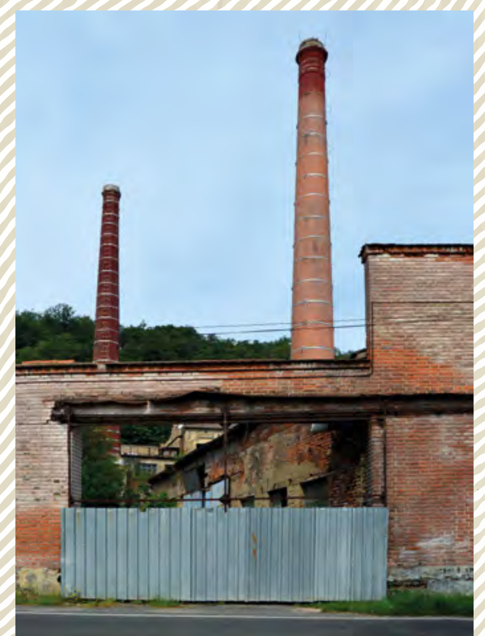
Sklárna Otovice, uliční fronta, pohled od jihu přes jižní bránu do areálu na západní fasádu hutní haly.

Autor: Ján Čáni, spoluřešitelé: Eva Volfová, Jana Tichá NPU, GmŘ, Praha 2020