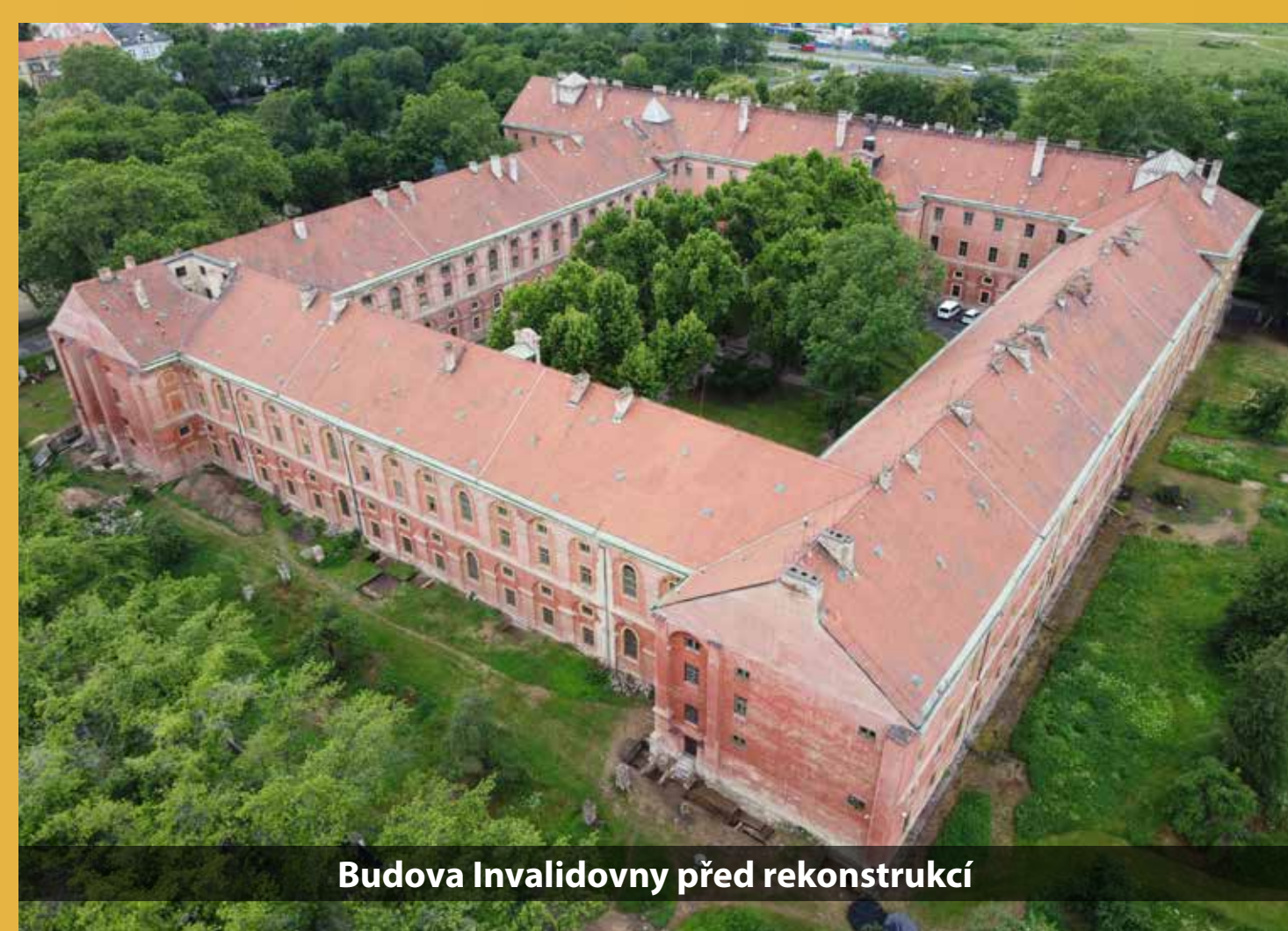
Budova Invalidovny před rekonstrukcí

Pražská Invalidovna, výkladní skříň barokního stavitelství z 18. století a národní kulturní památka, se bude v dohledné době rekonstruovat. Pro poznání historie objektu,