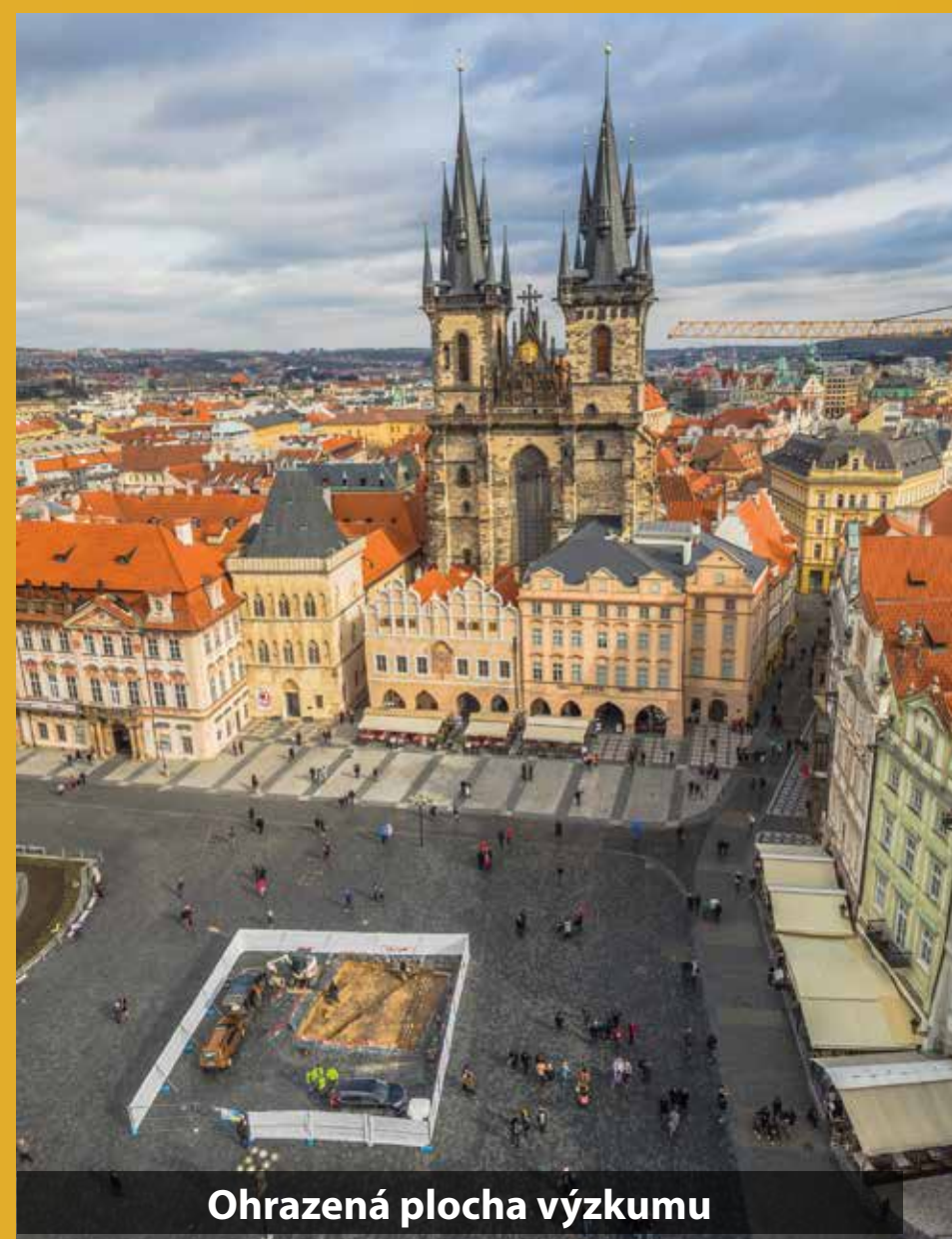
Ohraněná plocha výzkumu