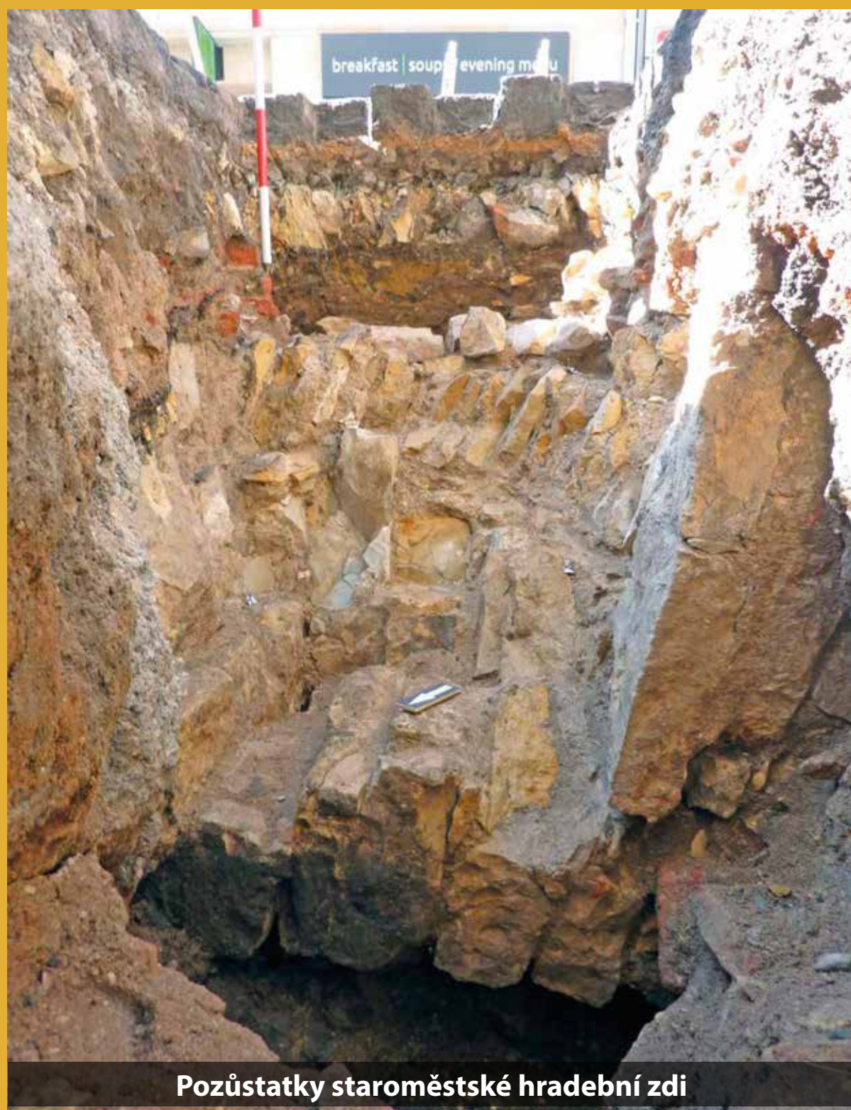
Pozůstatky staroměstské hradební zdi

Že se archeologické nálezy významné hodnoty nacházejí i těsně pod dlažbou chodníků, se mohli přesvědčit archeologové v létě roku 2020 v ulicích Dlouhá, Benediktská a Hradební na Starém Městě pražském. Podařilo se jim odhalit pozůstatky středověkého opevnění Starého Města z 13. století. V místech předpokládaného průběhu hradební zdi v Benediktské ulici byly dokumentovány zbytky kamenné konstrukce. V místech, kde se ulice stáčí do Rybné, se možná nachází pozůstatek středověké flankovací věže. Očekávaným objevem byl fragment mostu přes staroměstský hradební příkop. Zachycen byl vrchol jeho oblouku a část zábradlí.