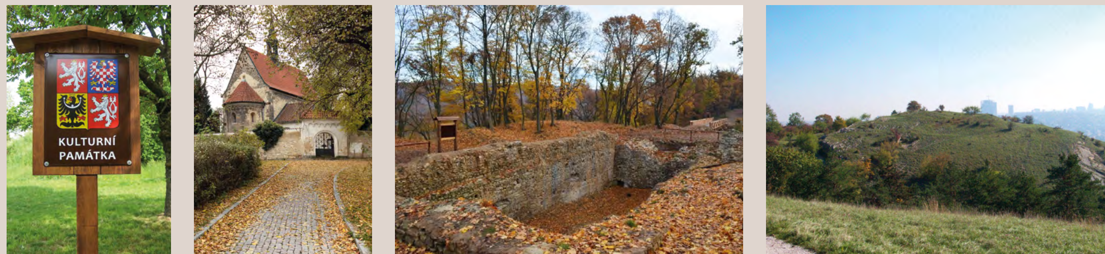
Označení KP archeologické povahy | Kostel Stětí sv. Jana Křtitele v Dolních Chabrech | Zřícenina Nového hradu v Kunraticích | Vrcholné středověké tvrzíště Divčice

Významnou a integrální činností našeho pracoviště je sledování, prevence a péče o památky archeologické povahy na území Hlavního města Prahy. Mimo centrum se ve většině případů jedná o pravěké a středověké hradíště (např. Divoká Šárka, Bohnice, Královice a další), středověké sakrální stavby a panská sídla (kostel Narození Panny Marie v Záběhlicích, kostel Stětí sv. Jana Křtitele v Dolních Chabrech, zaniklá tvrz v Čimicích) či specifické památkové areály (zřícenina Nového hradu a husitského obléhacího tábora v Kunraticích, polykulturní areál ve Víněři). Mnohé z těchto lokalit jsou ohroženy nelegálním detektorováním či neoprávněným budováním „bike trailů“.