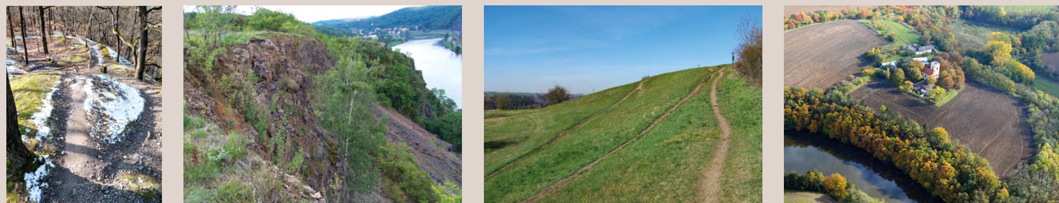
Val oppida hradíště Závist ohrožený horskou cyklistikou | Hradíště Bohnice Zámka | Rané středověké hradíště Butovice | Letecký snímek hradíště. Vlevo předhradí, vpravo akropole s kostelem sv. Markéty