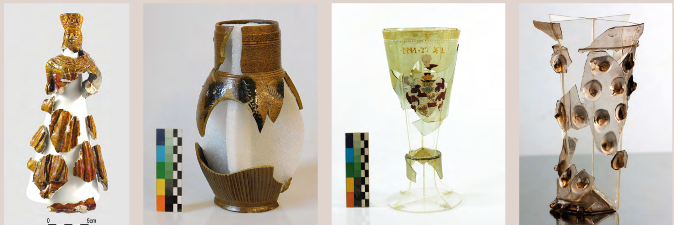
Oboustranně glazovaná exkluzivní keramická nádoba ve tvaru madony/královny | Novověký kameninový džbán | Renesanční skleněná číše s emailovým erbem | Číše s terčovými nálepy

Všechny artefakty získané archeologickou činností našeho pracoviště prochází základním ošetřením, do kterého patří očistění, stabilizace, jednoznačné označení a evidence. Významnější nálezy, především z keramiky, skla či organických materiálů, přichází do rukou našich konzervátorek a restaurátorek. Výsledky jejich pečlivé práce můžete vidět i mezi exponáty v Národním muzeu, Muzeu hlavního města Prahy, ve výstavních prostorách Senátu Parlamentu ČR nebo na různých výstavách, kde dotváří obraz hmotné kultury středověku a novověku.