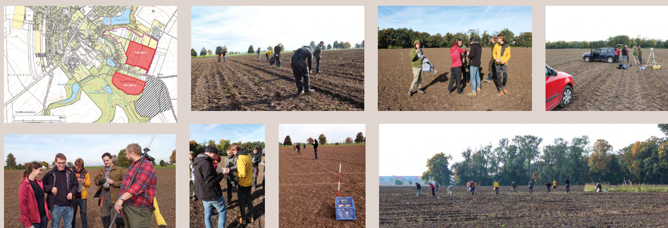
Neinvazivní výzkum na polykulturních lokalitách kolem Víněře (2022)

Na podzim 2022 náš odbor ve spolupráci se studenty archeologie ÚPA, FF UK a pedagogickým dozorem zahájil revizní nedestruktivní výzkum pravěkého naleziště polykulturního charakteru ve Víněři (lokalita V obůrkách a Kamenný stůl). Pocházejí odsud výrazné věteřovské nálezy, je zde zastoupena doba bronzová, halštatská a další. Lokalita bezprostředně sousedí s plochou pravěkého hradíště (pravěkého výšinného sídliště) V Obůrkách. Ke spolupráci byli přizváni zástupci dalších institucí, které se tímto územím kontinuálně zabývají (ARÚP, MMP, OP MHMP). Badatelský výzkum formou archeologických povrchových sběrů a detektorové prospekce předcházela rešerše dostupných dokumentačních fondů. Po ukončení akce proběhne vyhodnocení sebraných poznatků (terénní dokumentace) a ošetření získaných nálezů.