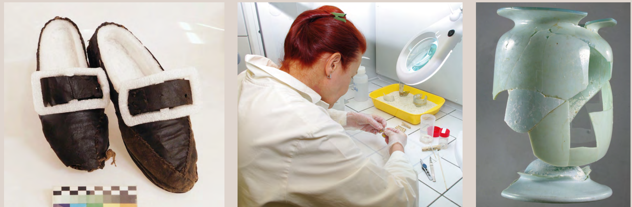
Ukázka konzervace usňových bot, Valdštejnský palác | Laboratorní ošetření archeologického skla | Novověká skleněná nádoba