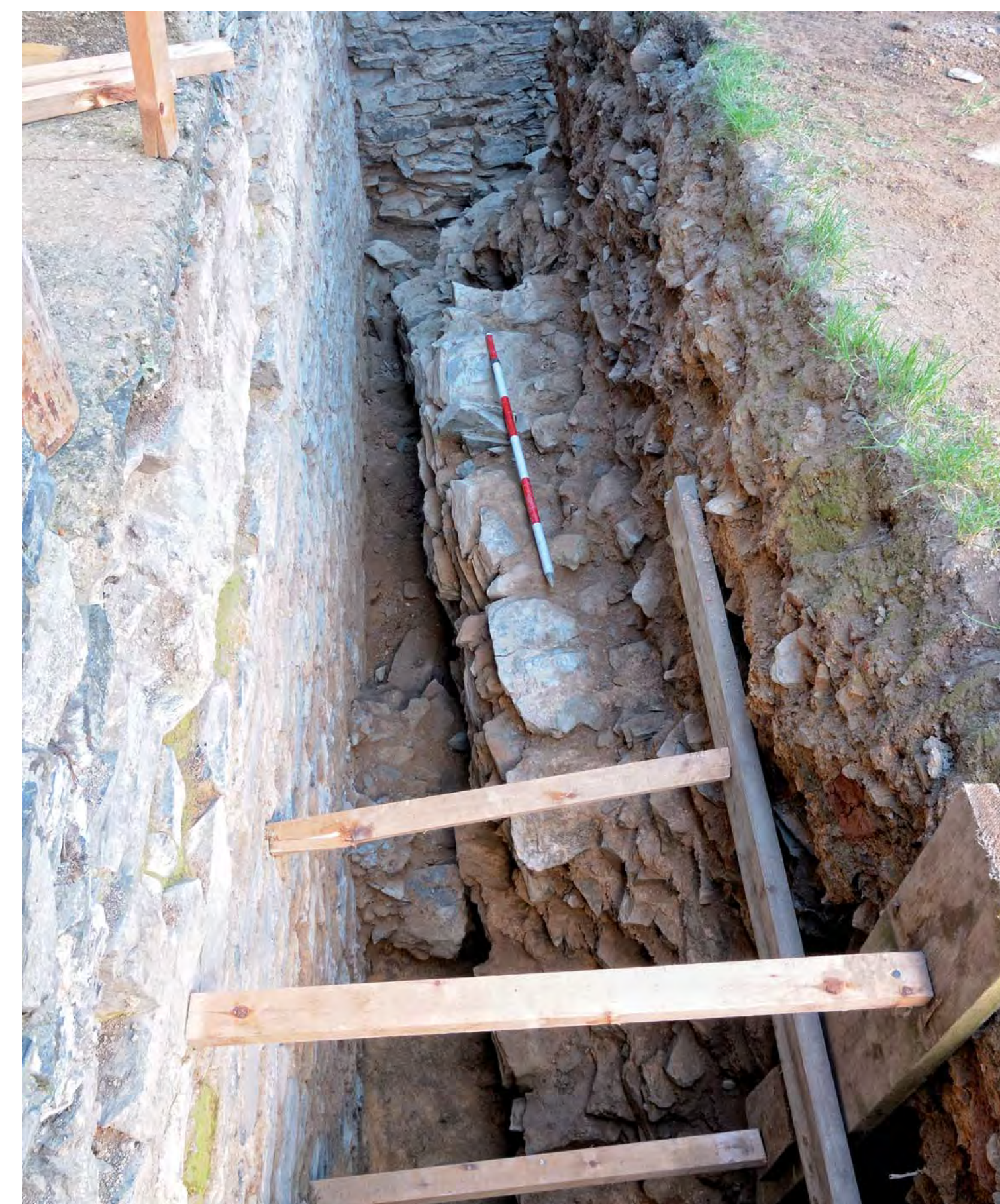
Zed' současného hradu