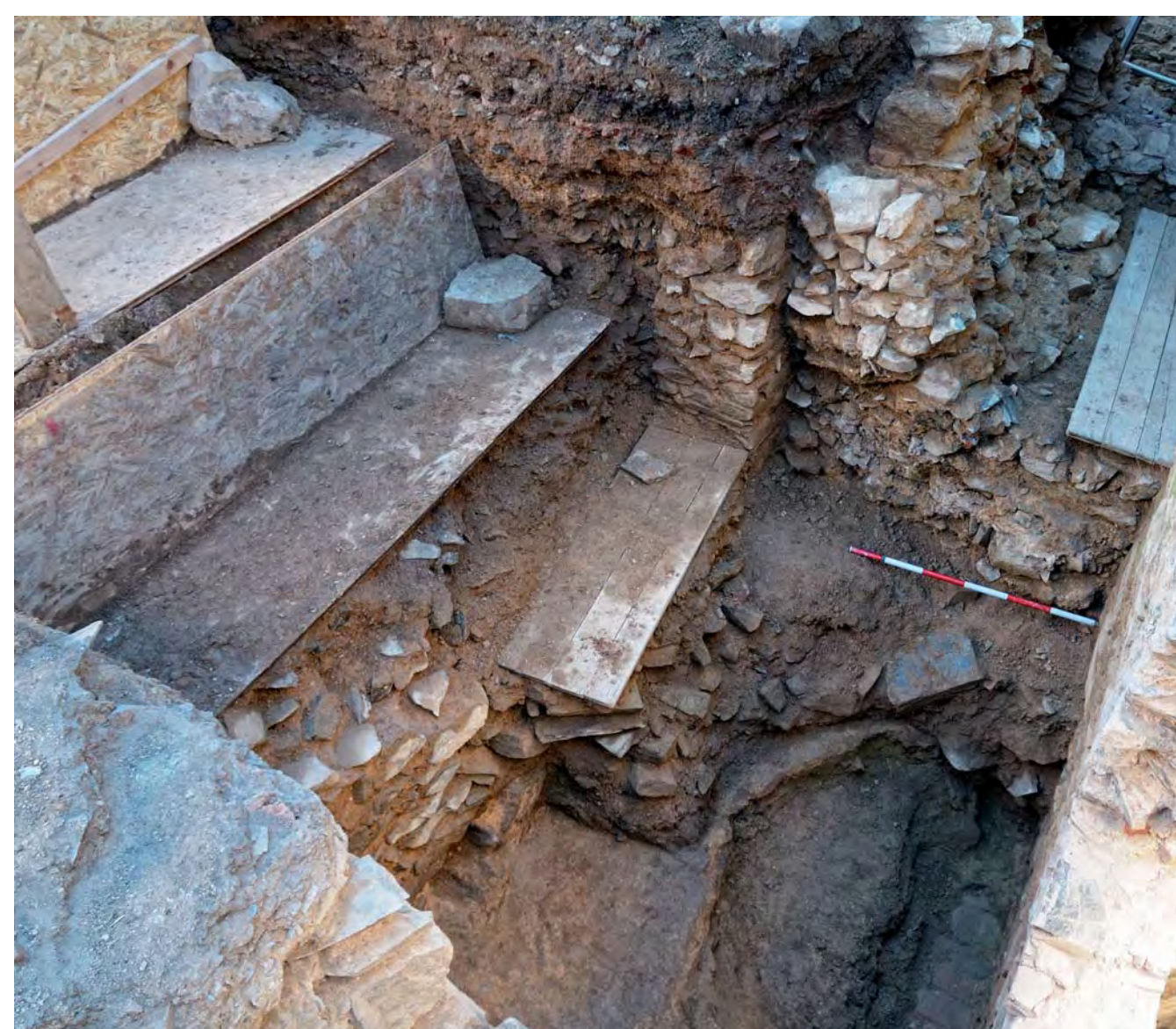
Odhalené zbytky rozbořeného hradu, vpravo zed' současného hradu