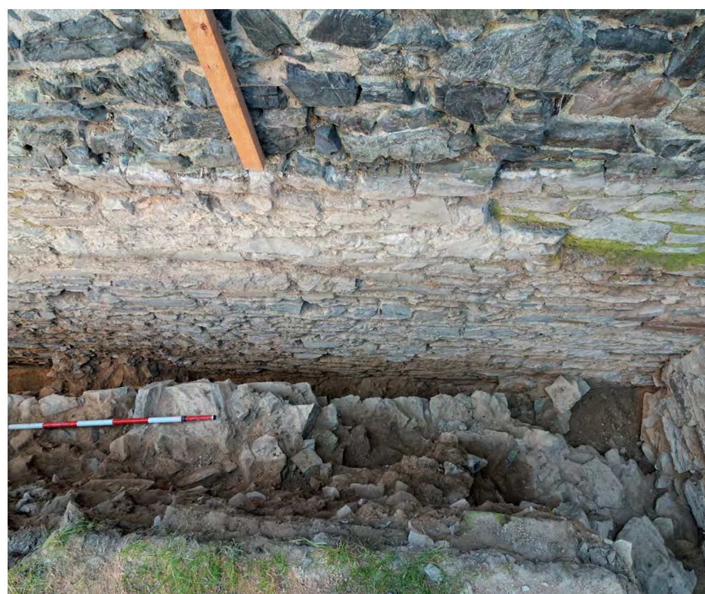
Odhalené zbytky rozbořeného hradu, vpředu a vpravo zdi současného hradu