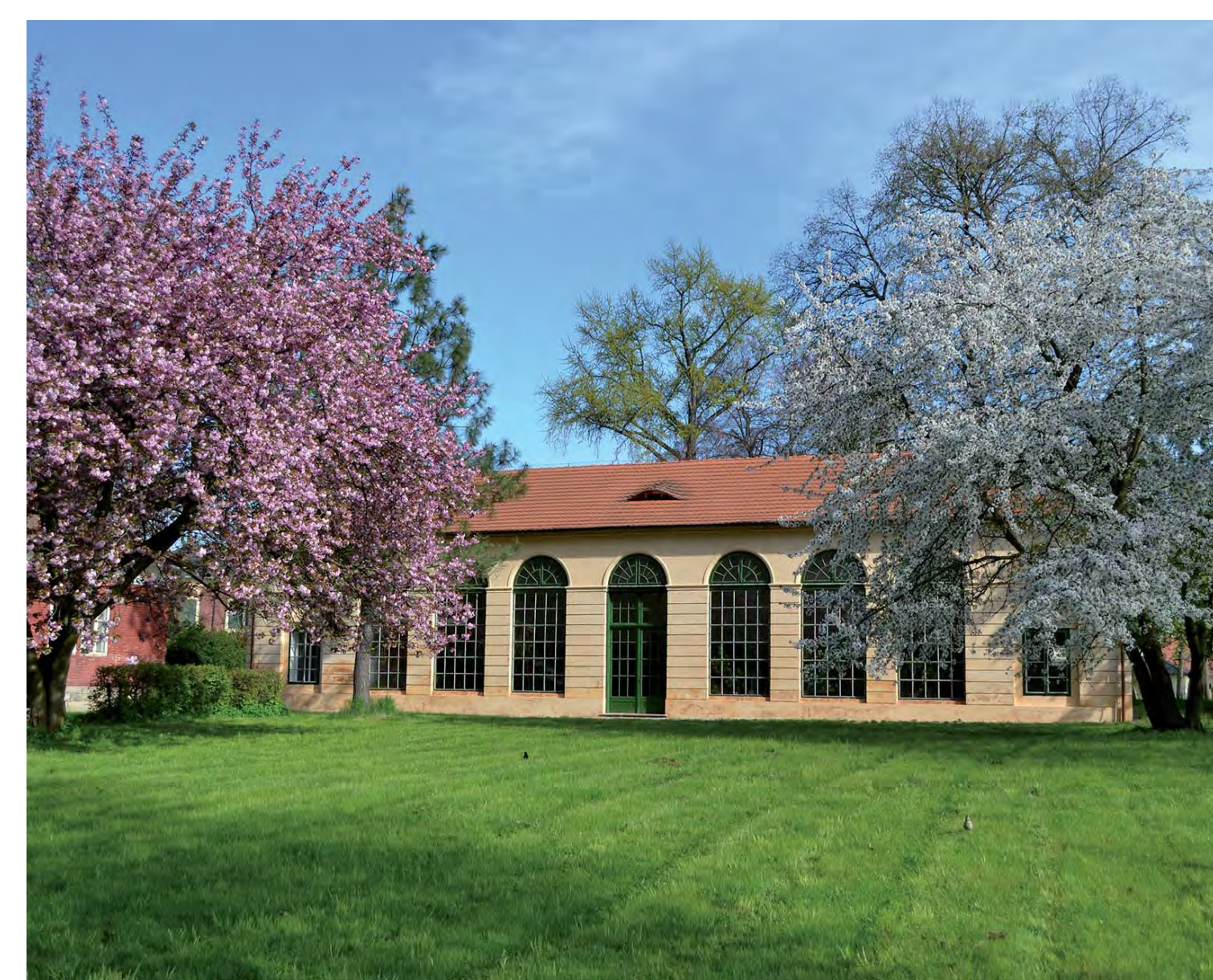
Celkový pohled na oranžerii od jihu