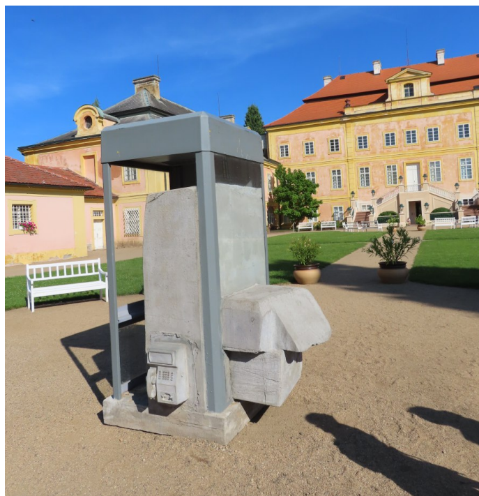
Zámek Krásný dvůr u Podbořan – Galerie HYB4 a Kampus Hyberská, „Přerušovaný hovor“, červen 2021 – Dílo umístěno nevhodně na hlavní ose čestného dvora.