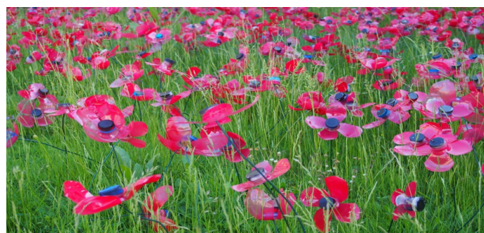
Zámek Maintenon – Jérôme Toq'r – Vlčí máky, květen 2022. Dílo bylo umístěno před průčelím zámecké budovy. Svým měřítkem a barevností netvořilo pohledovou dominantu prostoru.