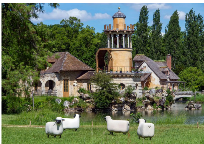
Versailles, Queen's Hamlet – památka světového dědictví UNESCO François-Xavier Lalanne – Mouton de pierre , červen–říjen 2021. Instalace ve vesničce Marie Antoinetty svým motivem navázala na rustikální charakter prostoru a umocnila jeho kompozici. I přes umístění v centrální části sochy nenarušovaly dominantní postavení staveb. (5)

V rámci přípravy výtvarné intervence pro konkrétní prostor (zahradu, park, ale i veřejné prostranství s kulturně historickými hodnotami) je třeba definovat hlavní zásady této koncepce především na úrovni kompozičních dominant různého stupně a prostorových vazeb. Je nežádoucí, aby výtvarné intervence danou kompoziční hierarchii a vazby výrazně oslabovaly nebo porušovaly. V případě nerespektování těchto zásad se z vystavovaných děl stávají pro historickou zahradu rušivé jevy .