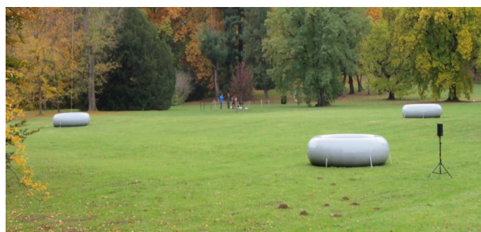
Zámek Eggenberg, Graz – památka světového dědictví UNESCO Klanglicht 2021, Kunstfestival der Bühnen Graz. Instalace umístěné v parku během několikadenního festivalu byly plně reverzibilní a nijak nenarušovaly hmotnou podstatu památky.