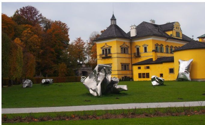
Zámek Hellbrunn – Hans Kupelwieser, červenec 2021. Díla byla umístěna mimo hlavní kompoziční osy a části areálu. Díky své neutrální barevnosti nevytvářela výraznou negativní pohledovou dominantu.